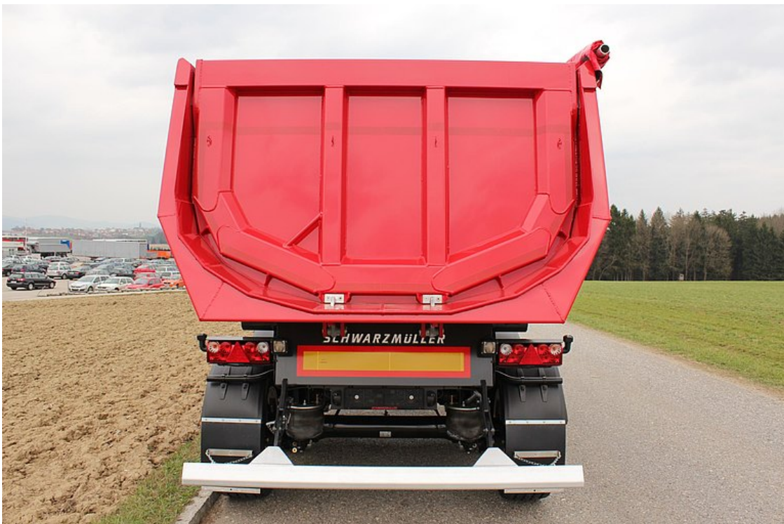
Tylna ściana = ściana wahlowa z wpuszczonymi łożyskami i automatycznym mechanicznym centralnym zamknięciem 2-hakowym