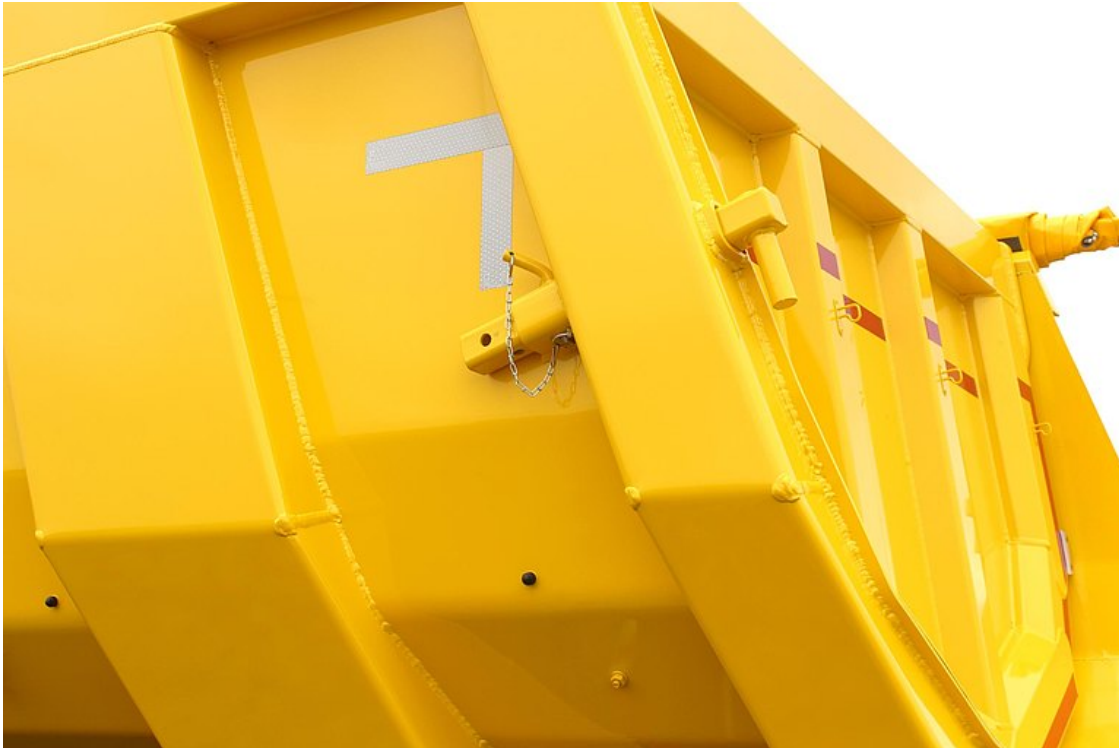
OPCJONALNIE: urządzenie dozujące do tylnej ściany wahlowej z wyciąganym ogranicznikiem rurowym