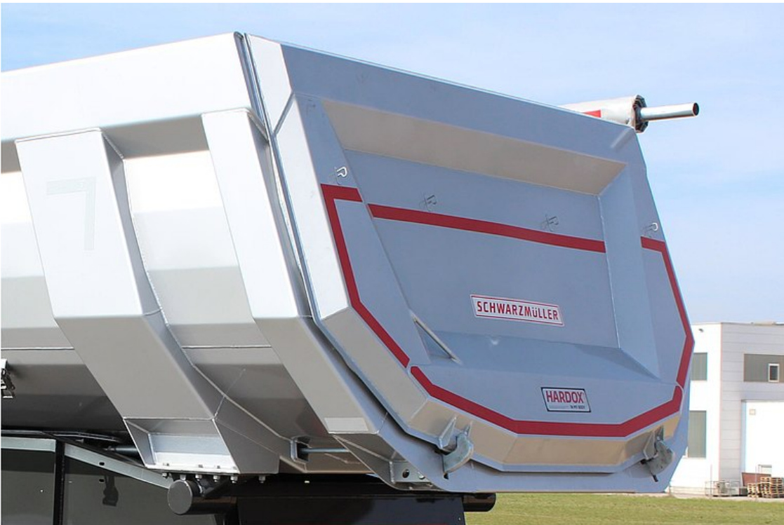
OPCJONALNIE: leżąca na zewnątrz tylna ściana - dzięki temu zapewniona większa pojemność ładunkowa