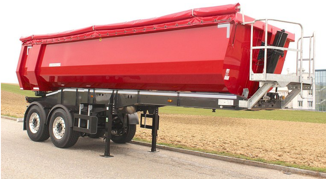
2-osiowa naczepa siodłowa wywrotka aluminiowa ze skrzynią