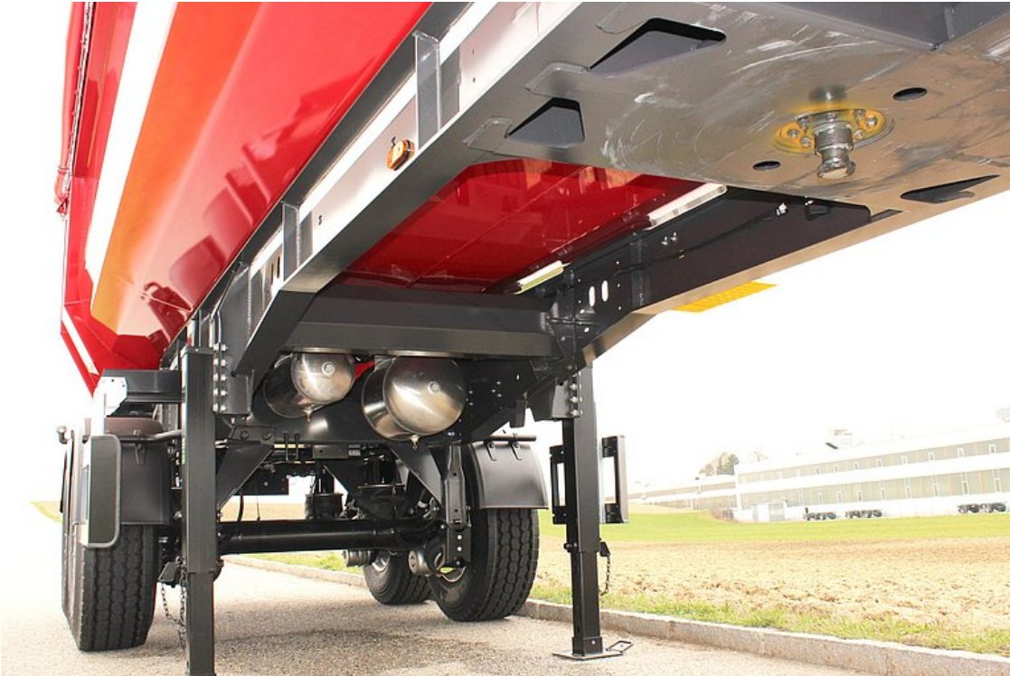
Stabilna i odporna na skręcanie konstrukcja podwozia z dodatkowymi rurami odpornymi na skręcanie