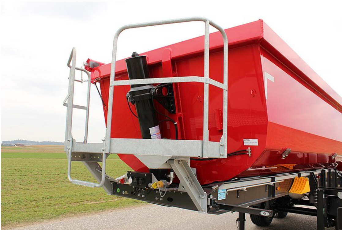
Podest stojący na ścianie przedniej do obsługi plandeki rolkowej