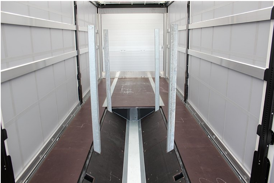
Wgłębienie na zwoje o długości użytkowej ok. 7 400 mm, z 5 parami zintegrowanych obudów wtykowych, do średnic zwojów do 2 100 mm