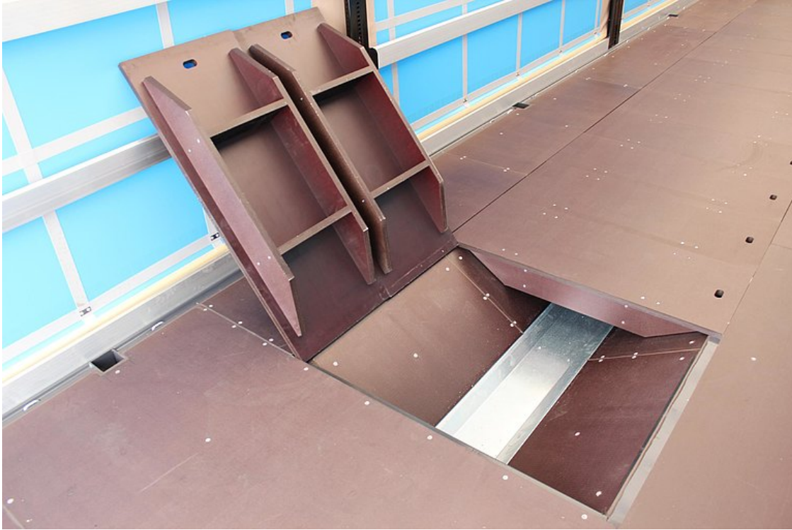
Osłona wgłębienia, po której można jeździć wózkiem widłowym, ze sklejki wodoodpornej 27 mm z podciąganiem