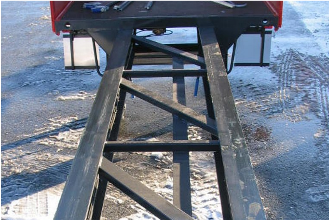
Rozciągnana rama o lekkiej konstrukcji, o długości rozciągania ok. 6 000 mm do transportu długich materiałów do 22 m