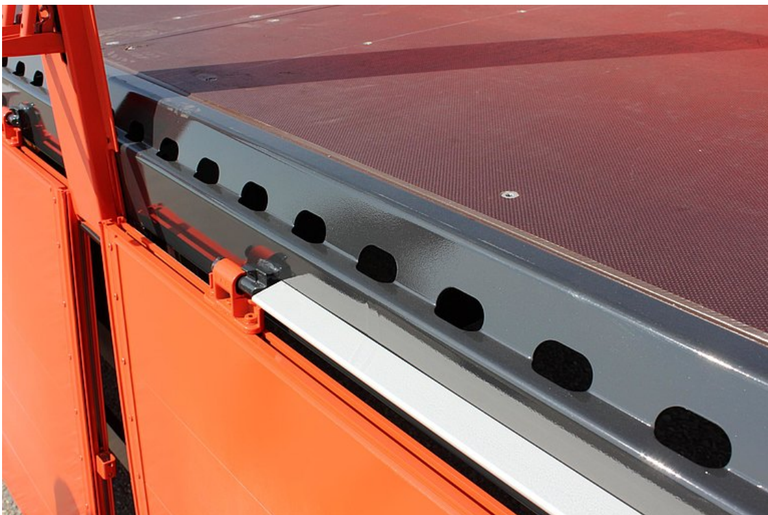
OPCJONALNIE: rama zewnętrzna z otworami o rozstawie ok. 100 mm, otwór podłużny 50/30 mm, do mocowania 2 t na każdy punkt mocujący