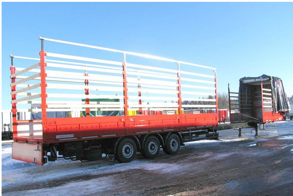
3-osiowa naczepa siodłowa płaska rozciągana