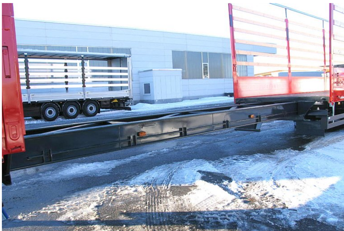
Odporne na skręcanie rozciągane stalowe ramy spawane, z 7-krotną pneumatyczną blokadą