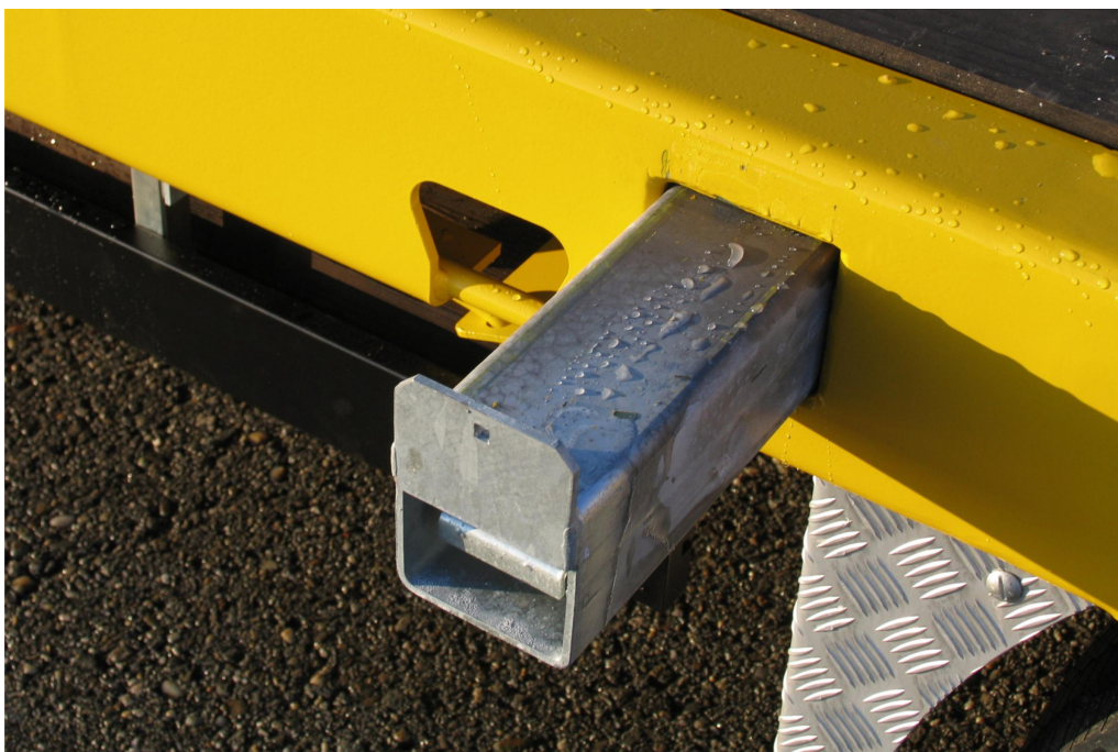
Wyciągane poszerzenia wraz z belkami poszerzającymi do transportów ponadgabarytowych