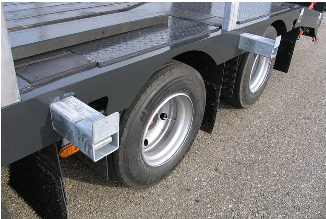
Wyciągane poszerzenia wraz z belkami poszerzającymi do transportów ponadgabarytowych