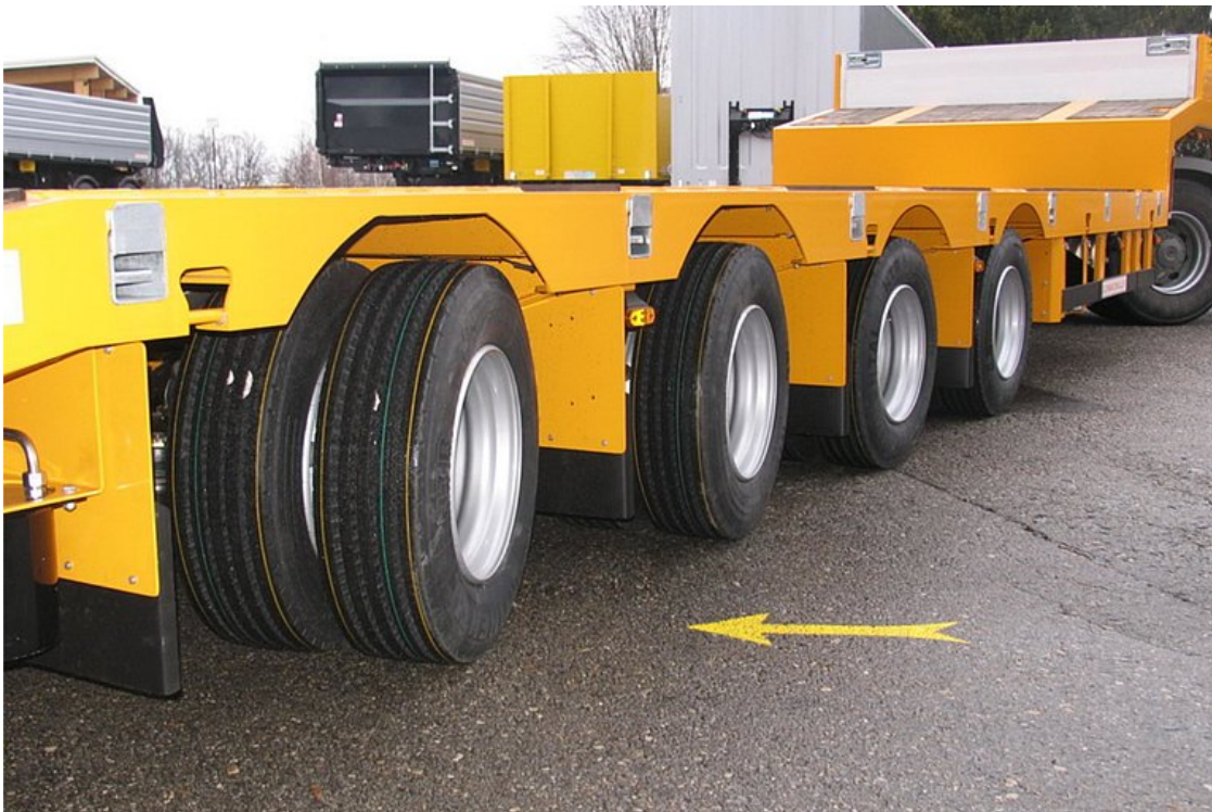
Trzecia i czwarta oś z samośledzącym układem kierowniczym dla lepszego pokonywania zakrętów i mniejszego zużycia opon