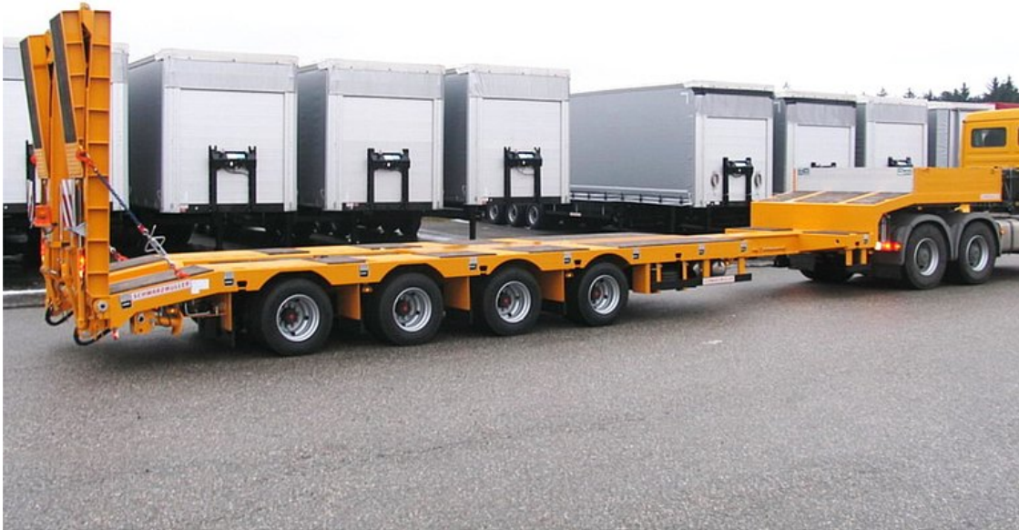
4-osiowa naczepa siodłowa niskopodwoziowa, wersja wzmocniona, rozciągana