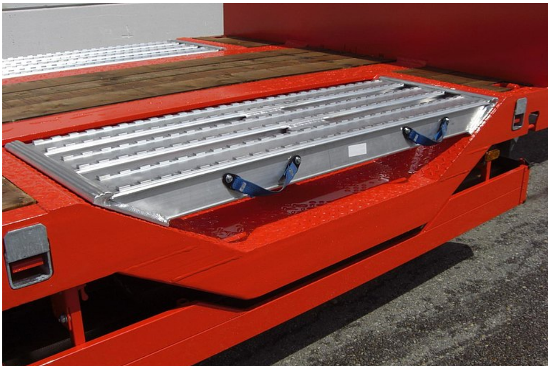
OPCJONALNIE: zagłębienia na na koła - zagłębienia do transportu pojazdów specjalnych