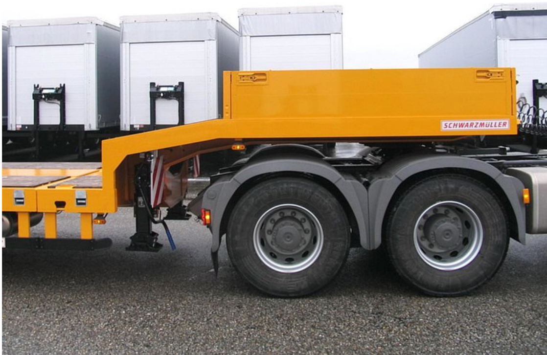
Z przodu podwyższona platforma załamana z wtykanymi burtami