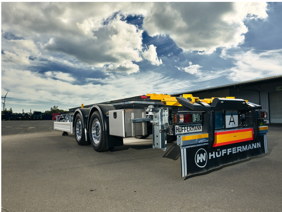
OPCJA WYPOSAŻENIA: Detal wyposażenia specjalnego do załadunku BDF