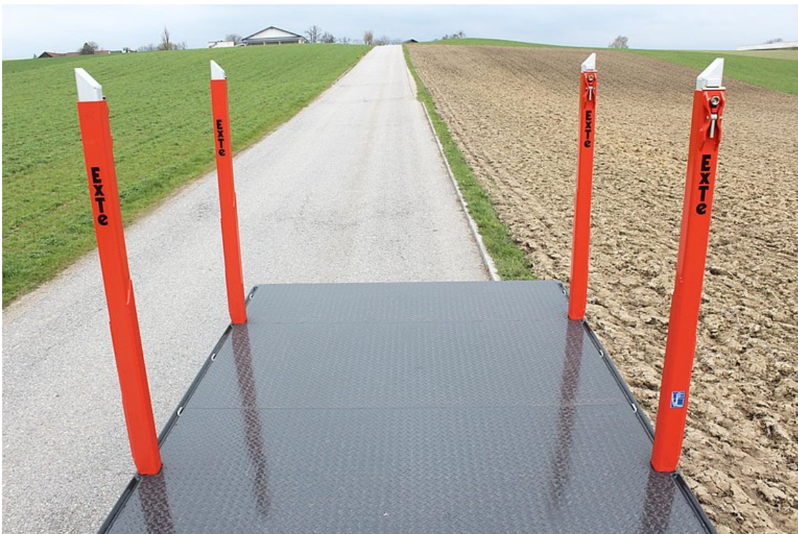
Kieszenie na kłonicie ExTe z belką wzmacniającą wraz z 2-częściowymi kłonicami ExTe 144-S z mocowaniem śrubowym (nośność 7 t/parę)