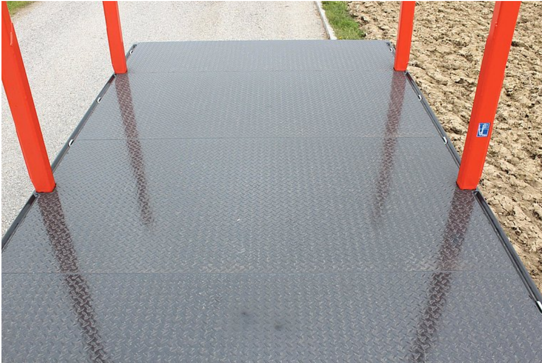
Podłoga z blachy stalowej o owalnych żeberkach 5/7 mm. spawana szczerbie