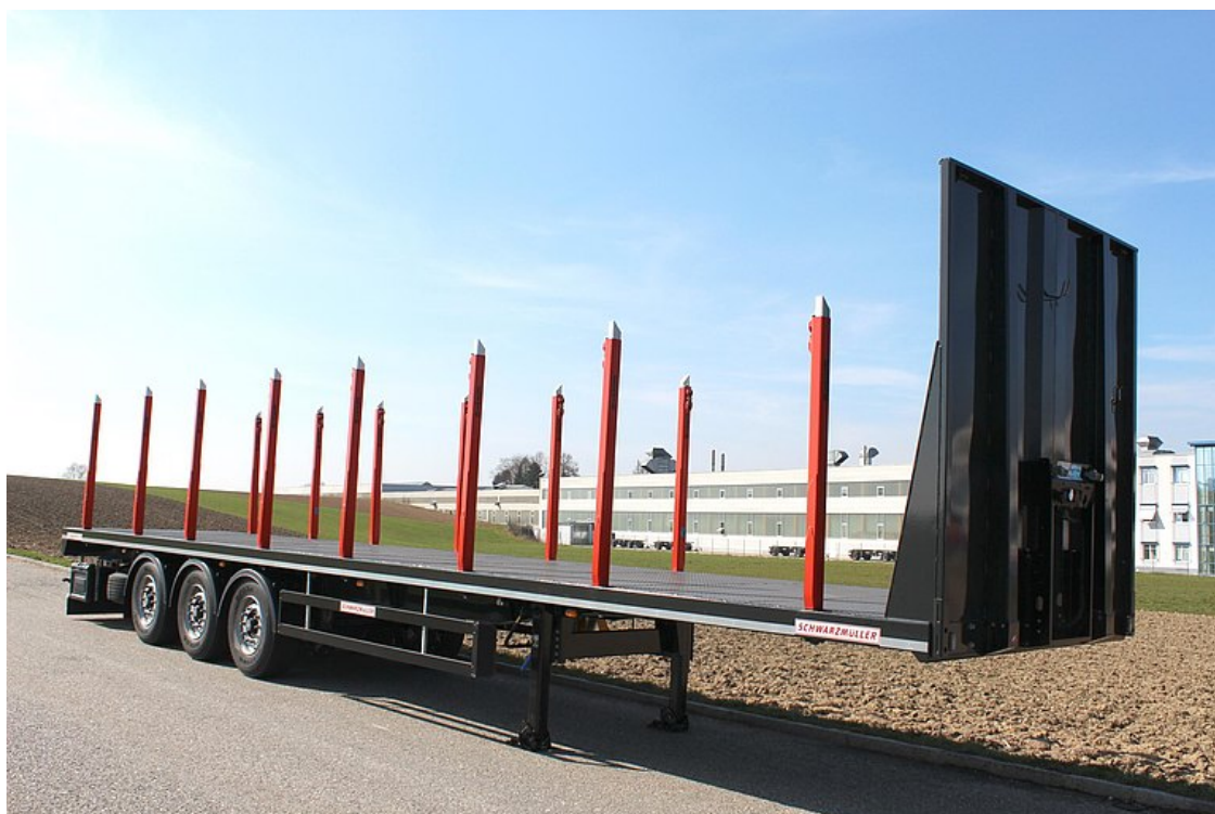
3-osiowa naczepa siodłowa kłonicowa z platformą