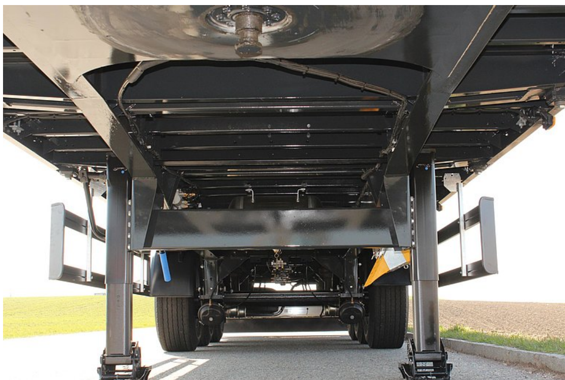
Rama typu lekkiego ze stali specjalnej NAXTRA o wysokiej wytrzymałości i dzięki temu większa ładowność o 500 kg