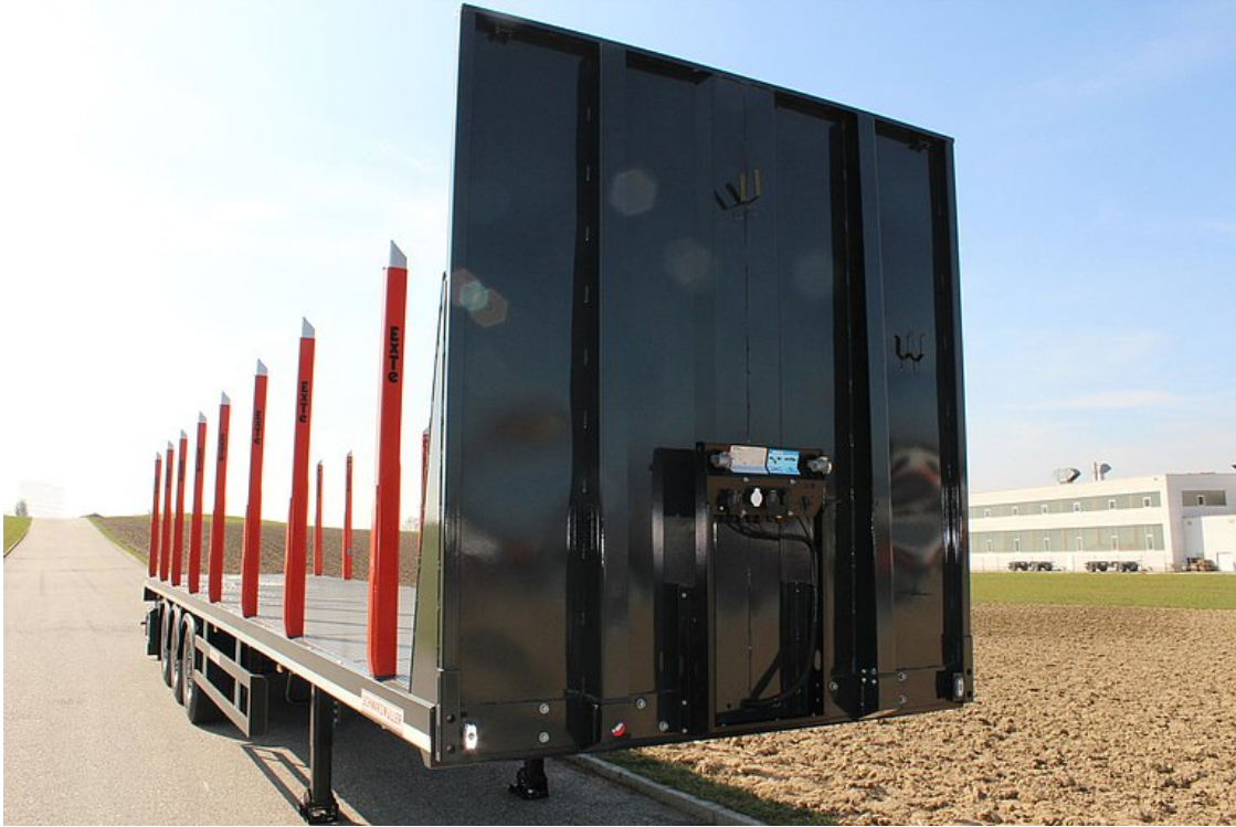
Ściana przednia z bardzo mocnych profili stalowych z podporami środkowymi