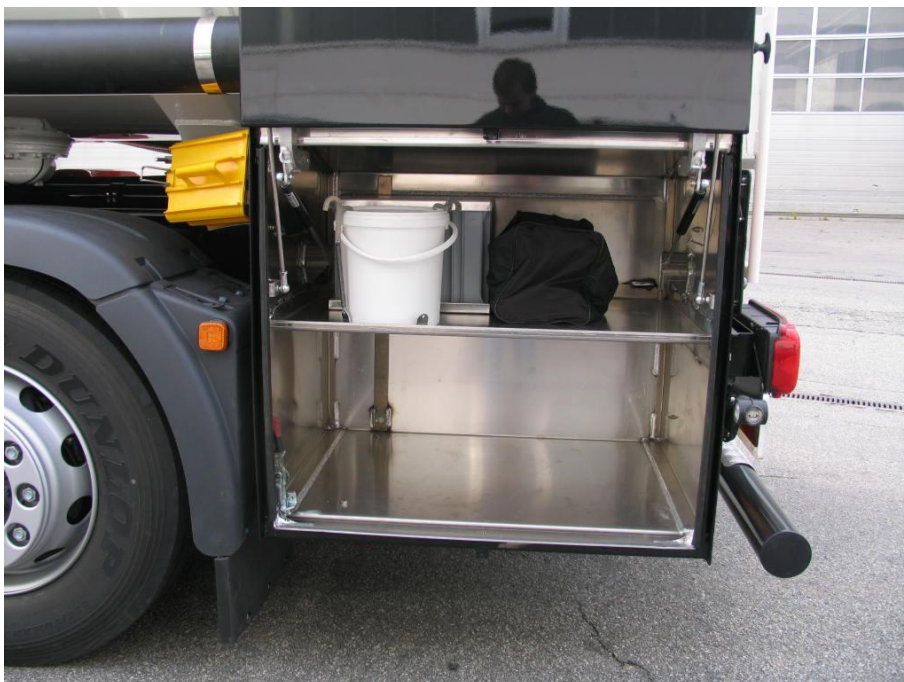
Skrzynka na akcesoria z otwieranymi na bok drzwiami oferuje dużo miejsca do przechowywania