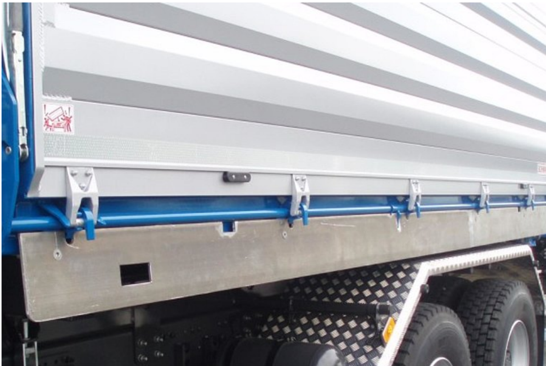
OPCJONALNIE: kłapa aluminiowa na bocznym wałku zamka centralnego