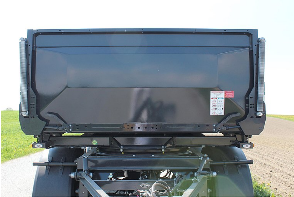
Stała ściana przednia z blachy stalowej