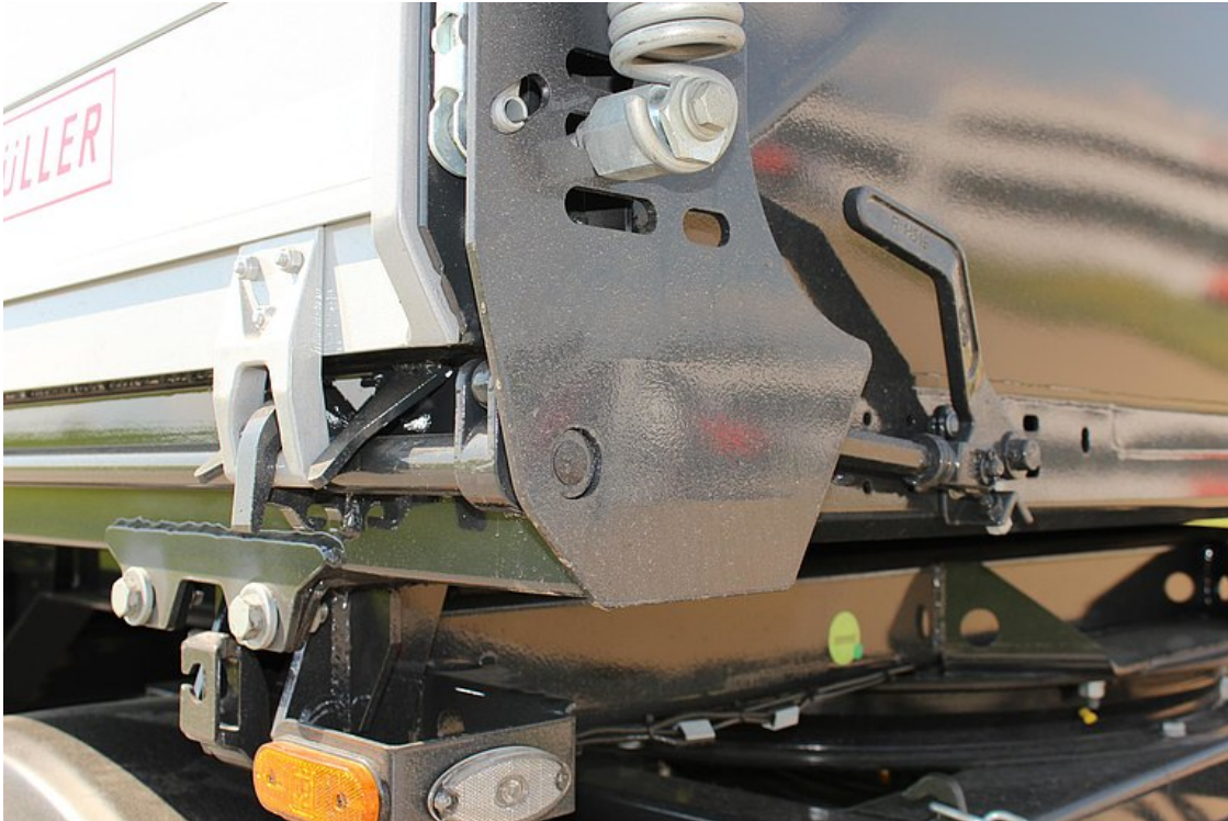
Ręczny zamek centralny do otwierania burt dźwigni i wałkiem zamka centralnego