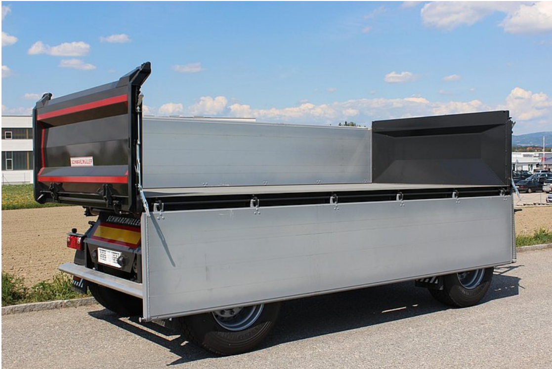
2-osiowa przyczepa wywrotka trójstronna ze składaną ścianą boczną