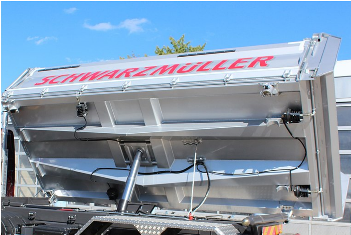
Konstrukcja mostu wywrotki z podłużnicami stożkowymi o profilu trapezowym o bardzo wytrzymałej, lekkiej konstrukcji z małymi polami powierzchni podłogi zapewniającymi wysoką odporność na wyboczenie i wysokie sprężynowanie uderzeń