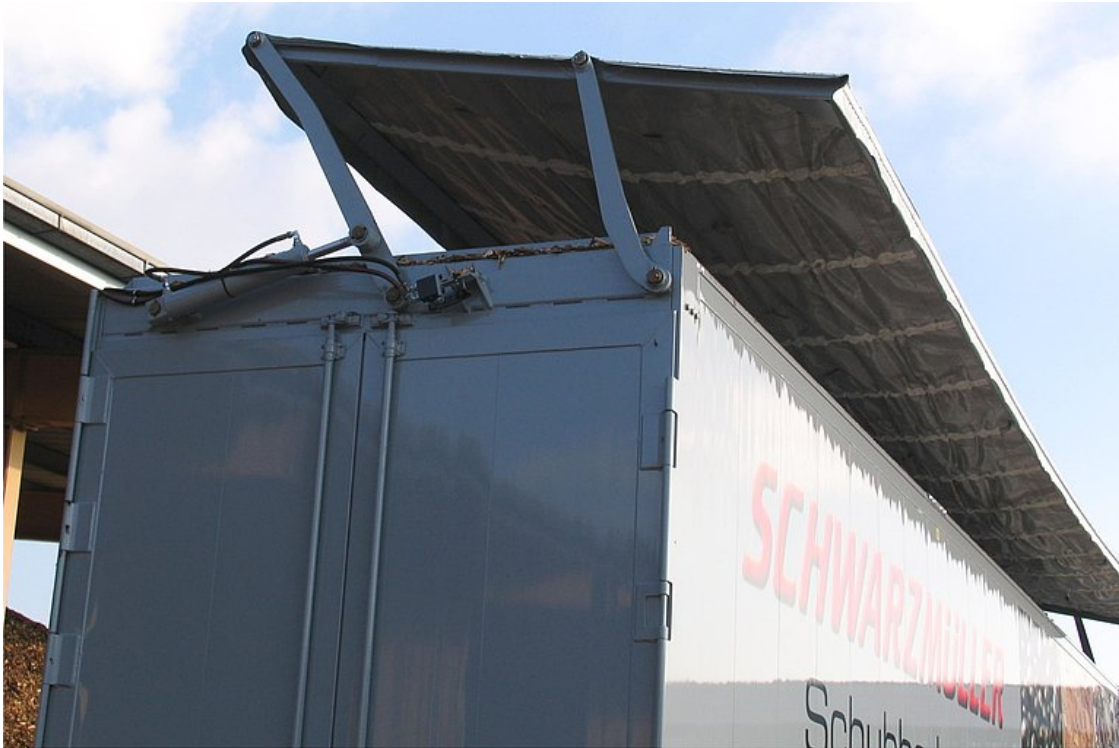
OPCJONALNIE: hydrauliczny dach nożycowy z ramą dachową dookoła i plandeką z tworzywa sztucznego