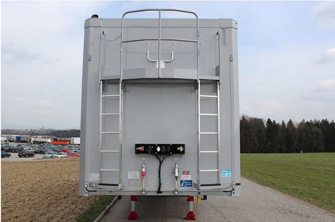
Stałą ściana przednia z aluminiowych profili zamkniętych z górną ramą stabilizującą