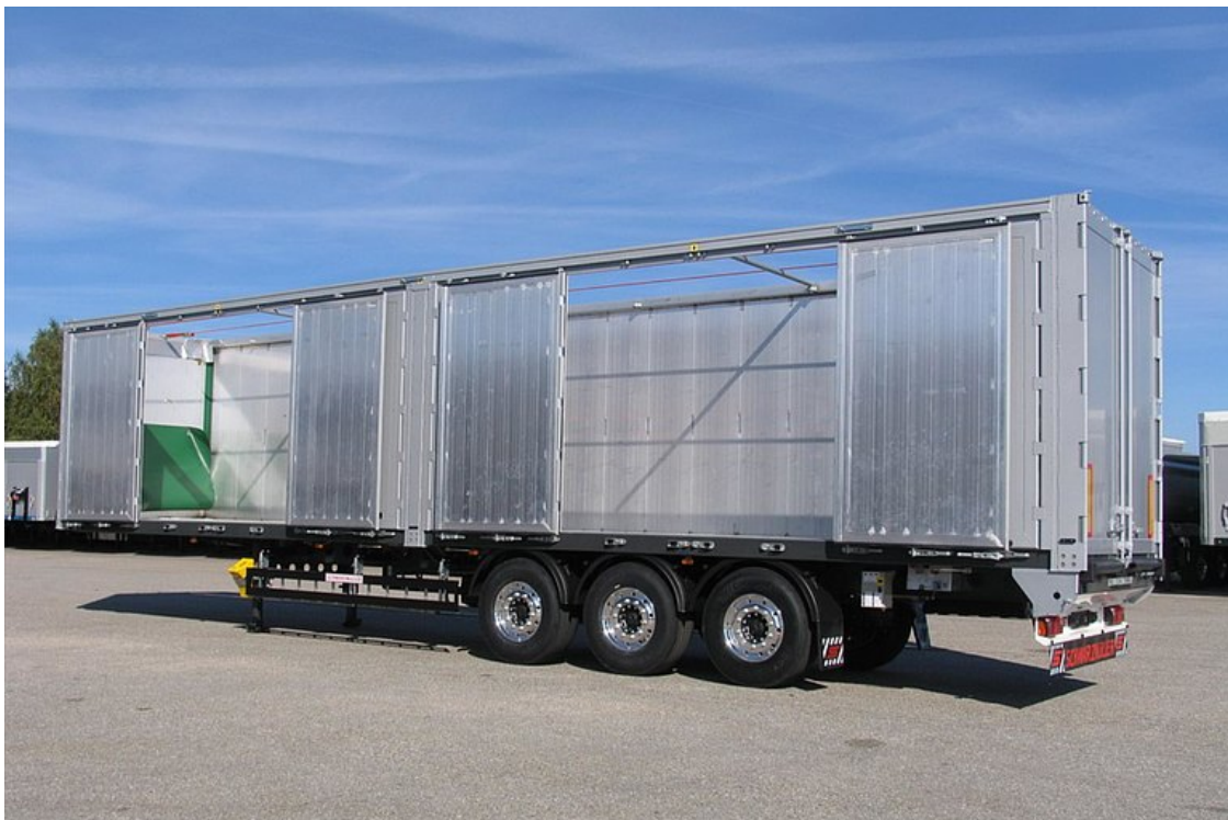
Z lewej strony z 2 szt. drzwi 4-skrzydłowych, do boczego załadunku i rozładunku