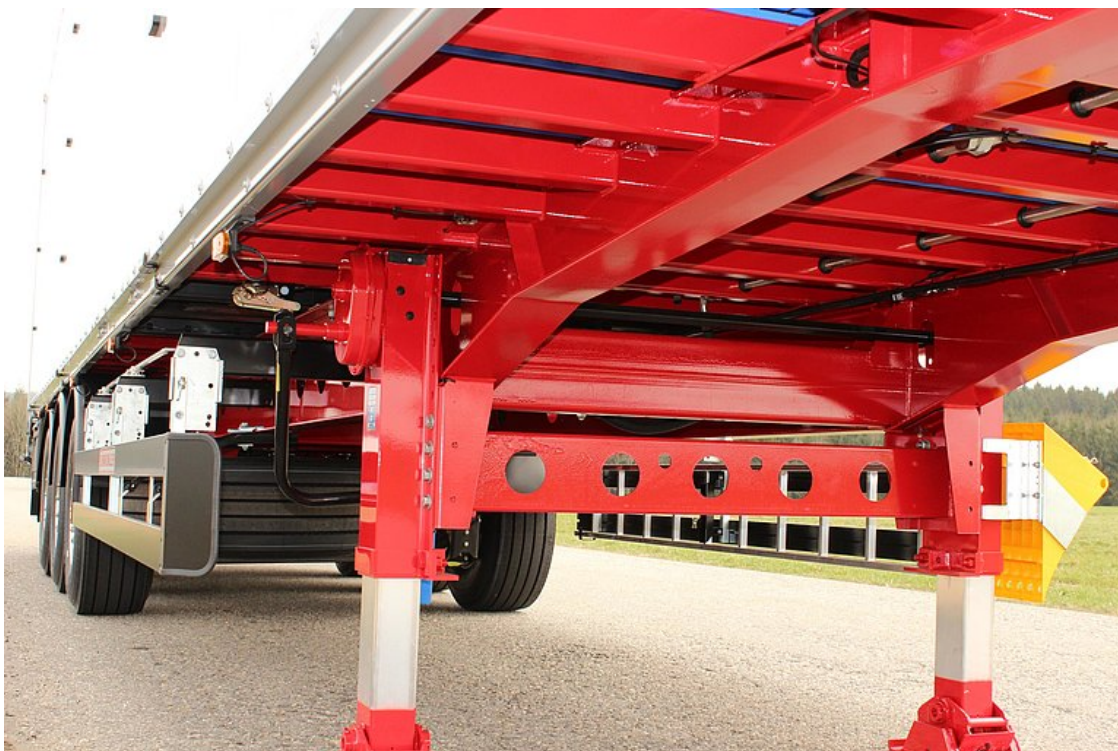
Odporna na skręcanie, ciężka stalowa konstrukcja ramy