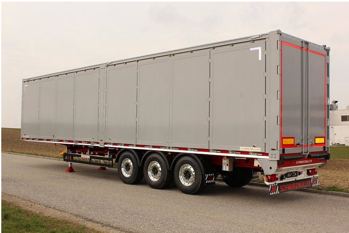
3-osiowa naczepa siodłowa z ruchomą podłogą i bocznymi drzwiami