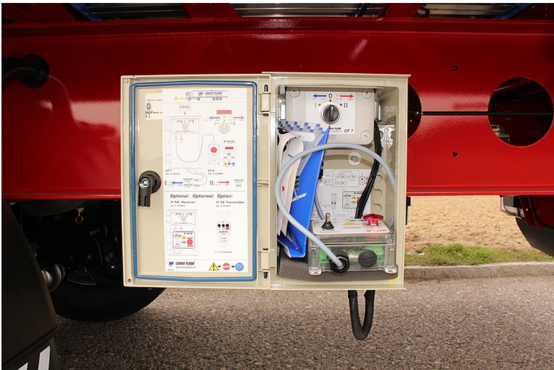
Panel sterowania w wodoszczelnej skrzynce oraz dodatkowo pilot zdalnego sterowania z kablem o długości 10 m