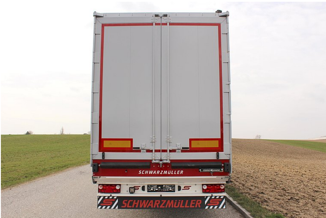
Tylna ściana = drzwi dwuskrzydłowe z leżącą na zewnątrz 1 zawrotnicą na każde skrzydło drzwi i dodatkowym zamkiem bezpieczeństwa, uruchamiane pneumatycznie