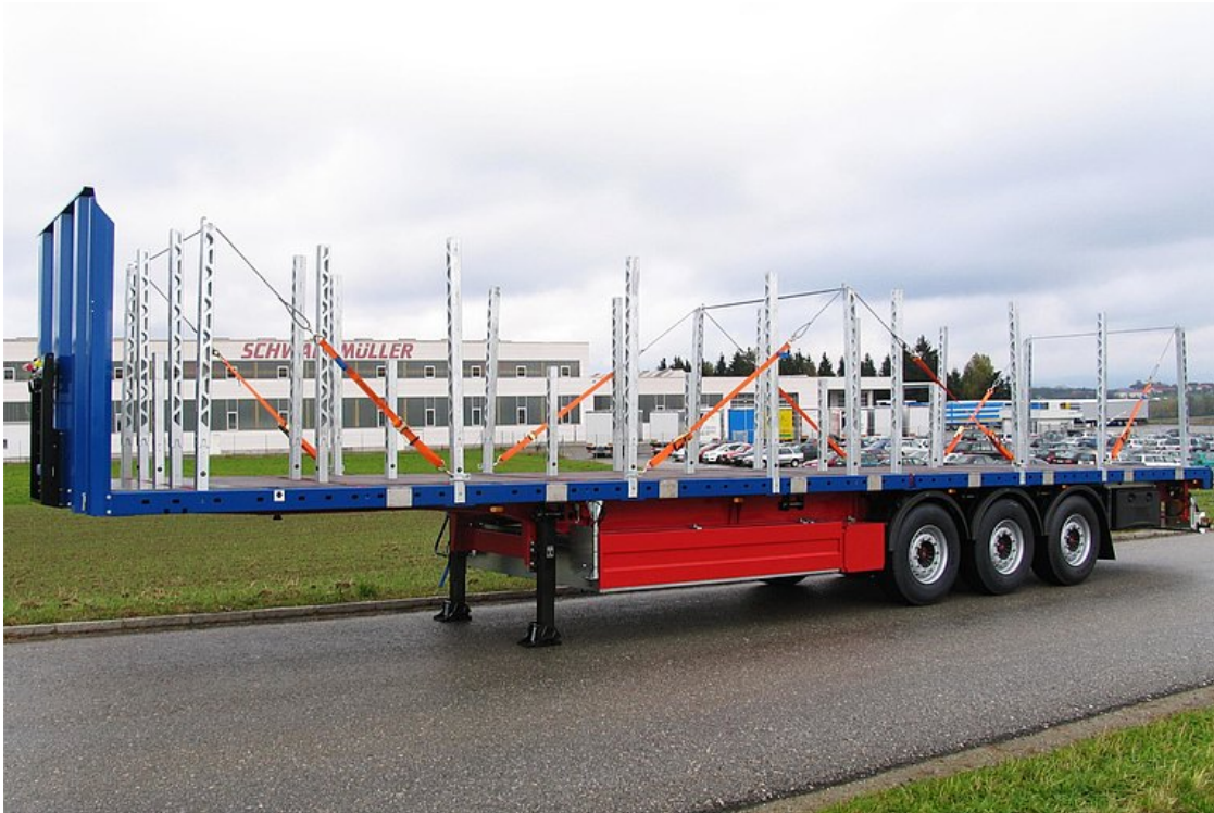
3-osiowa naczepa siodłowa płaska do transportu stalowych mat zbrojeniowych