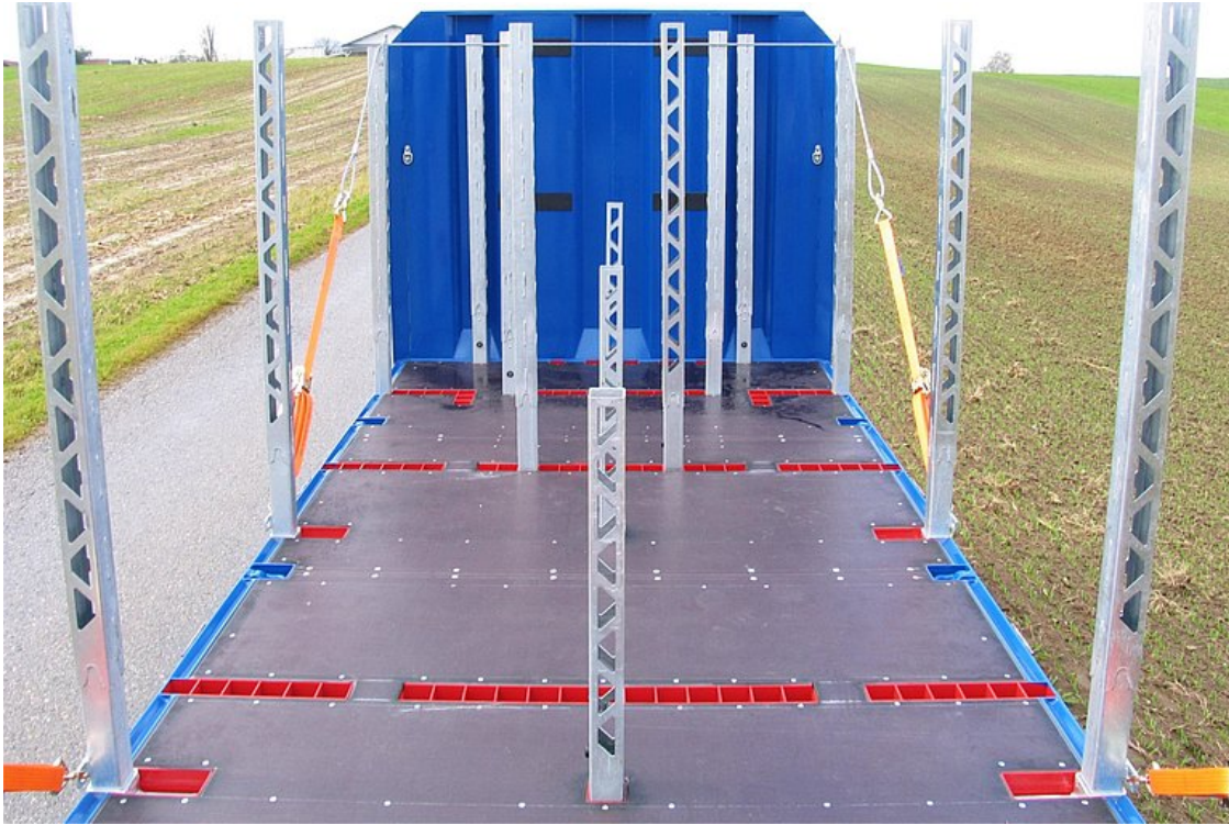
Pozycje obudów wtykanych do zabezpieczenia ładunku w postaci stosu stalowych mat zbrojonych o długości 6 000 mm każda