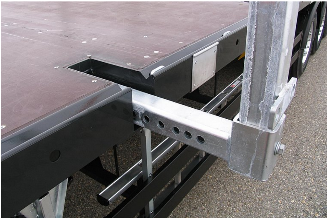
Wyciągane kłonicy ograniczających typu lekkiego z rur kształtowych, 13-stopniowa regulacja szerokości załadunku od 2 000 do 3 100 mm