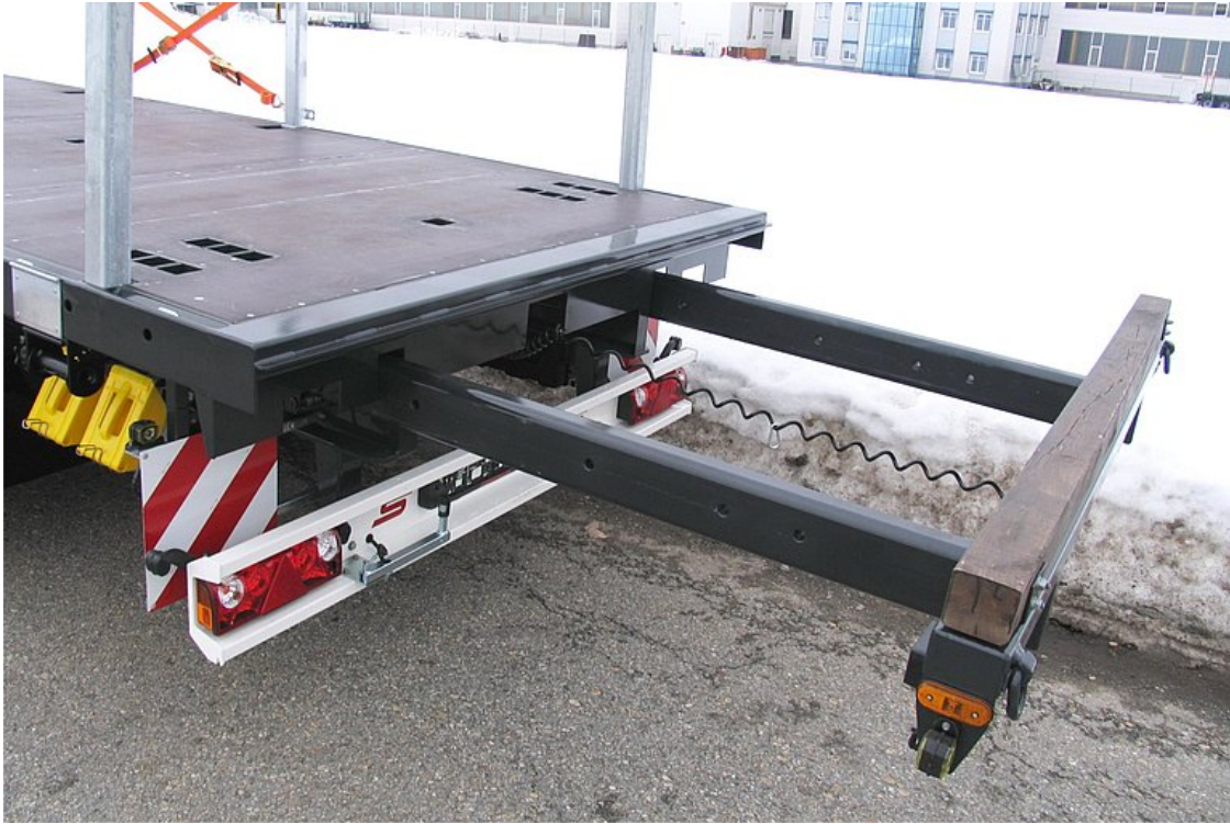
OPCJONALNIE: z tyłu rama wysuwana do 1 500 mm (możliwość obciążenia do 2 t)