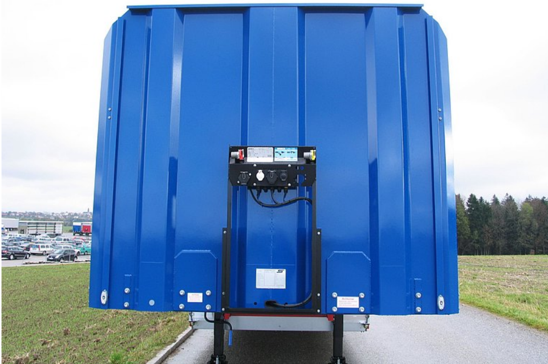
Ściana przednia z profilowanej blachy stalowej