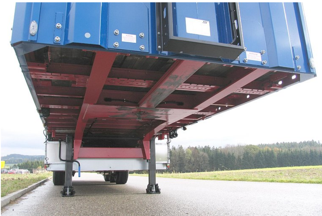
Odporna na skręcanie spawana konstrukcja ramy drabinowej