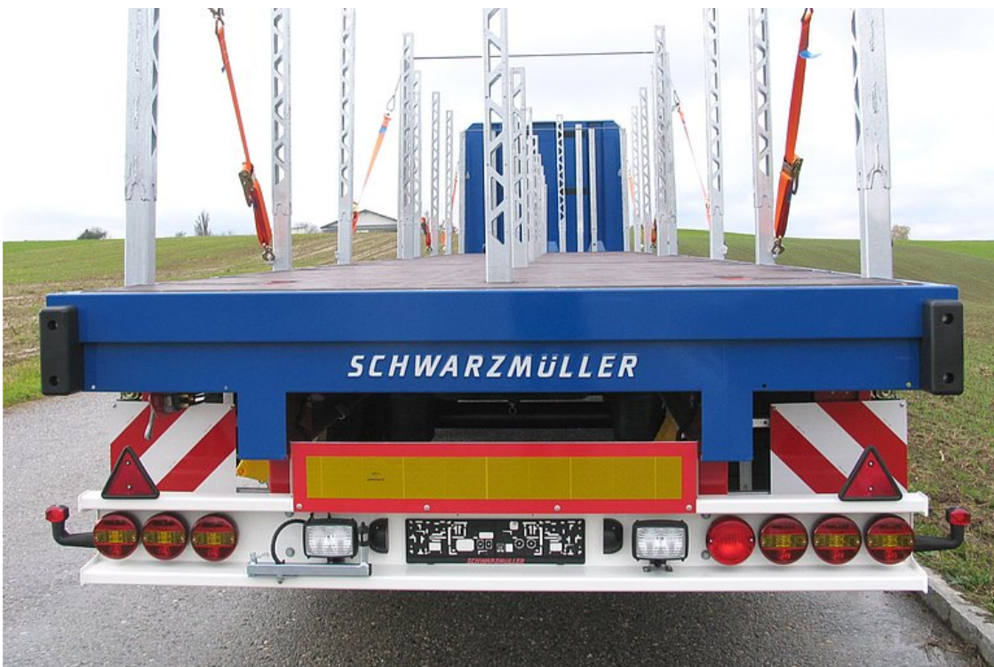
Osłona przeciwnajzdowa ze zintegrowanymi światłami tylnymi i zderzakiem gumowym