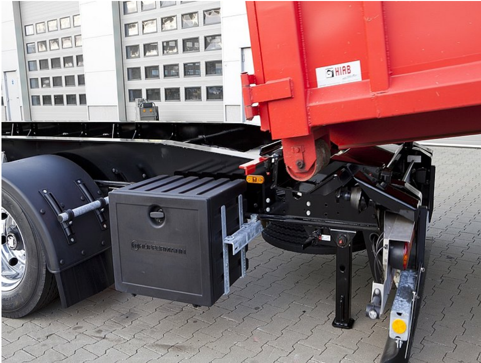
Tylne podparcie umożliwiające bezpieczne przekładanie