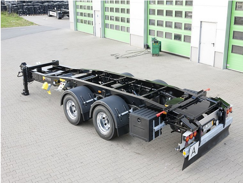
Wyposażenie specjalne z 3 okrągłymi lampami LED i lakierowanymi saniami