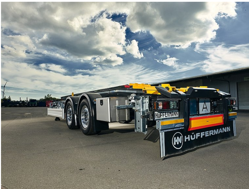
OPCJA WYPOSAŻENIA: Detal wyposażenia specjalnego do załadunku BDF