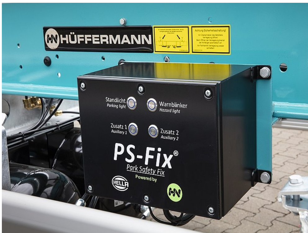
OPCJA WYPOSAŻENIA: System oświetlenia postojowego z własnym zasilaniem w celu zapewnienia większego bezpieczeństwa. PS-fix dysponuje czterema funkcjami: światło postojowe, funkcja migającego światła ostrzegawczego, oświetlenie dodatkowe i błyskowe