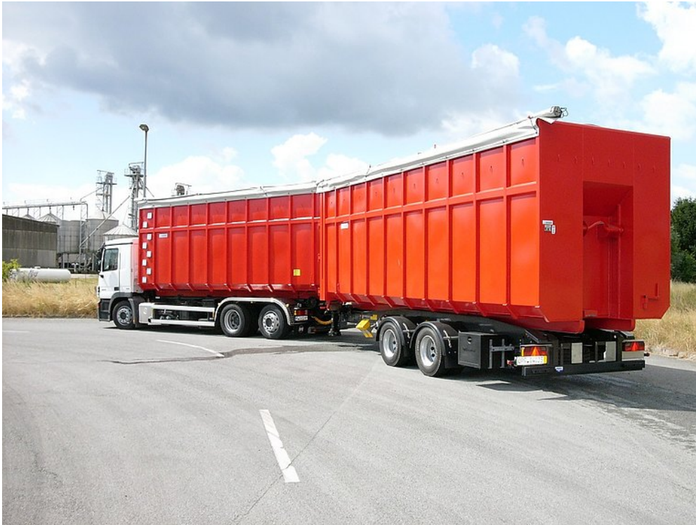
Cały zestaw z optymalnym wykorzystaniem pojemności