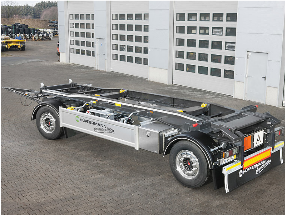
OPCJA WYPOSAŻENIA: Podwozie saniowe HSA 2 elegance edition