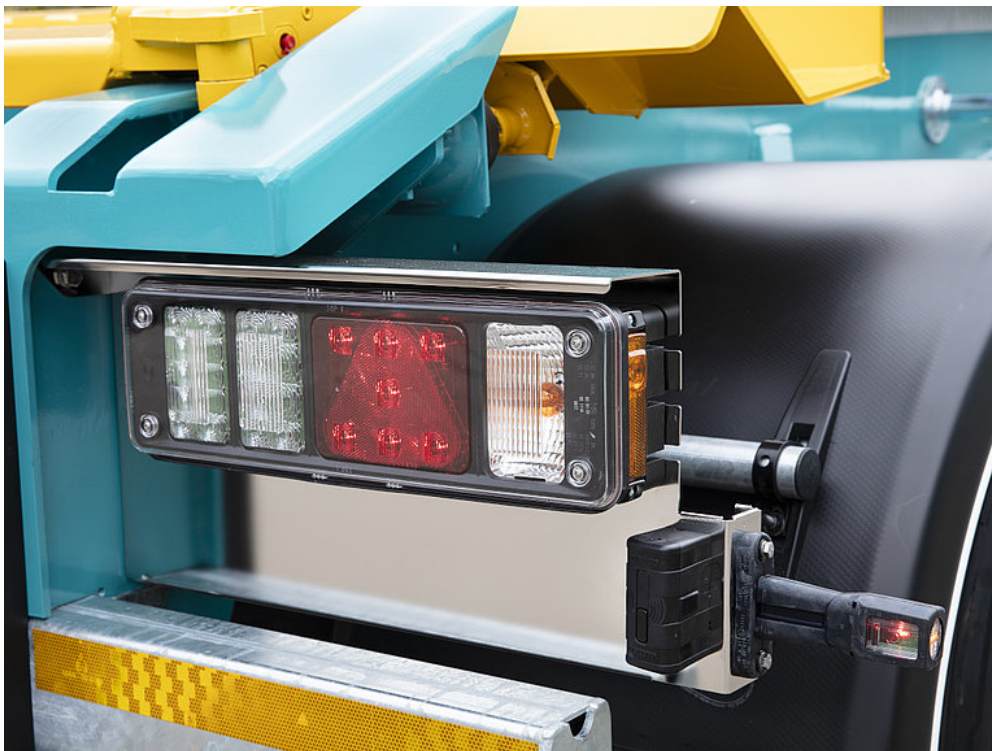
Modułowe oświetlenie Hella z lampami funkcyjnymi częściowo w technice LED