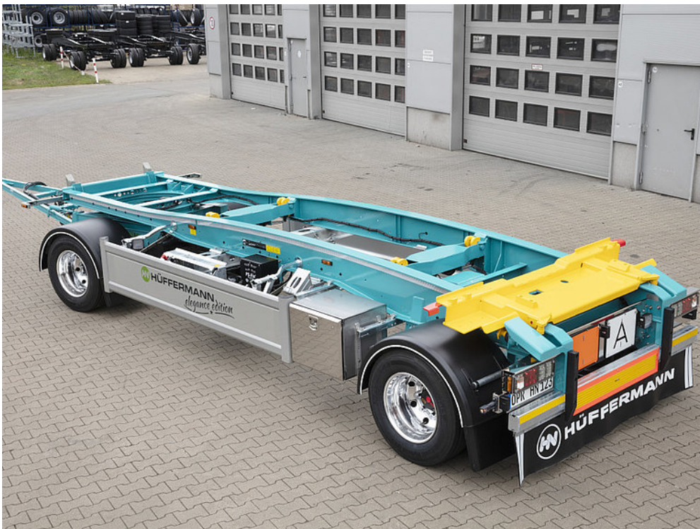
OPCJA WYPOSAŻENIA: Podwozie saniowe HSA 3 elegance edition