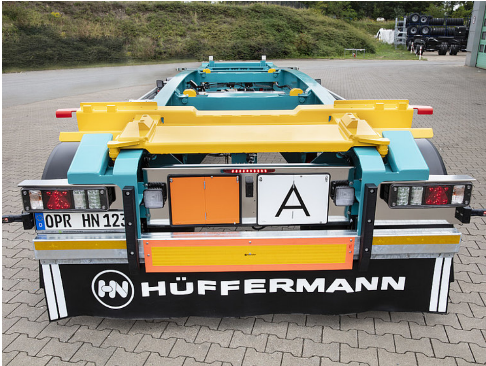
Widok od tyłu z tablicą ECE, tablicą ostrzegającą o przewozie odpadów i tablicą ADR