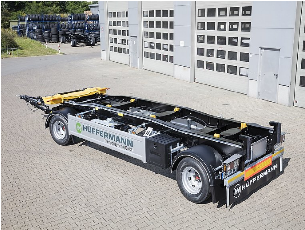
Wariant do załadunku przodem