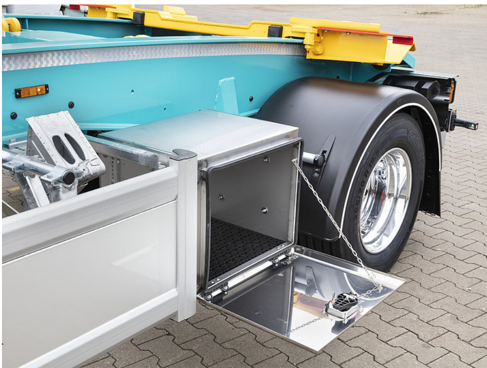
OPCJA WYPOSAŻENIA: Skrzynia ze stali nierdzewnej