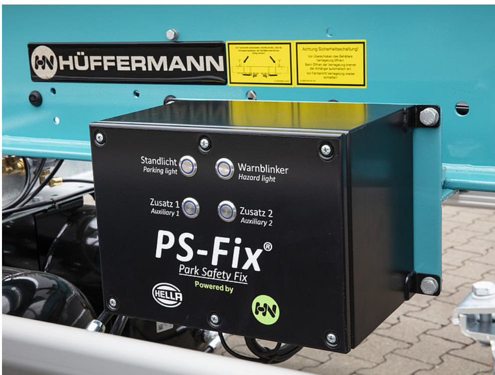
OPCJA WYPOSAŻENIA: System oświetlenia z własnym zasilaniem w celu zapewnienia większego bezpieczeństwa. PS-fix dysponuje czterema funkcjami: światło postojowe, funkcja migającego światła ostrzegawczego, oświetlenie dodatkowe i błyskowe.