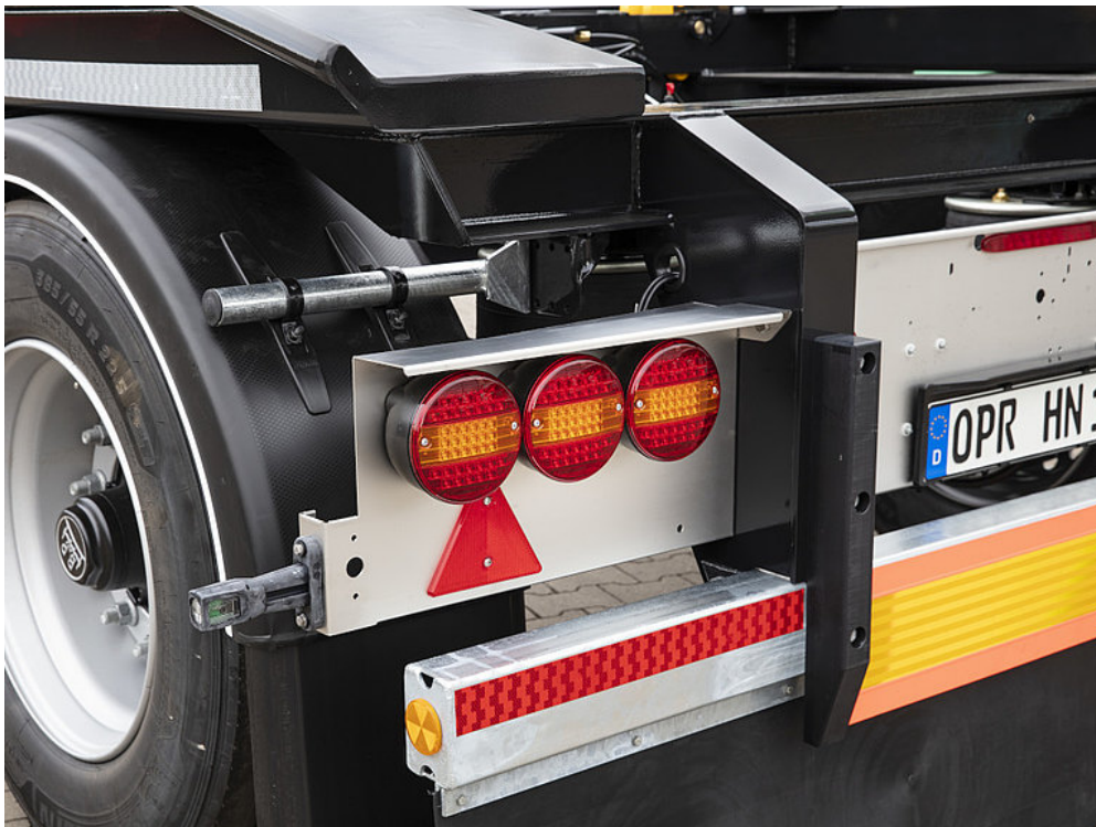
OPCJA WYPOSAŻENIA: 3 okrągłe światła tylne LED