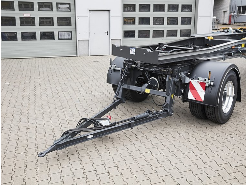
Opuszczony dyszel widłowy w przypadku załadunku przodem