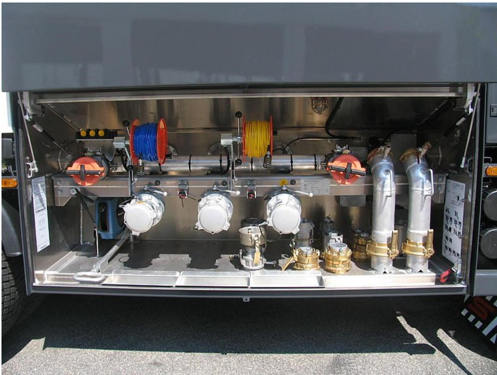
Szafka na armaturę z równolegle poprowadzonymi drzwiami szafki