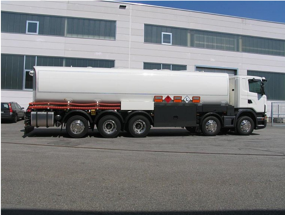
Nowoczesne wzornictwo i najlepsza funkcjonalność pojazdu