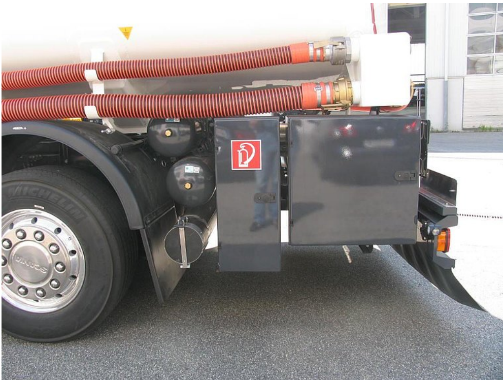
Aluminiowa skrzynka na gaśnicę 12 kg i skrzynka na akcesoria