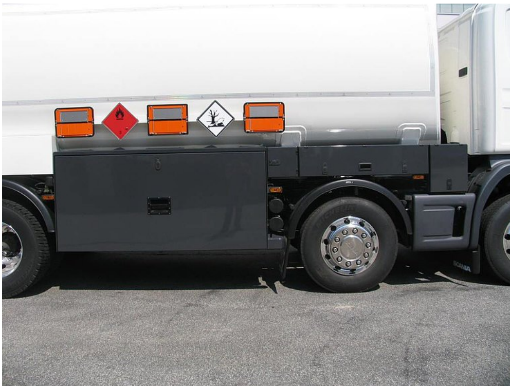
Optymalne rozmieszczenie oznakowań