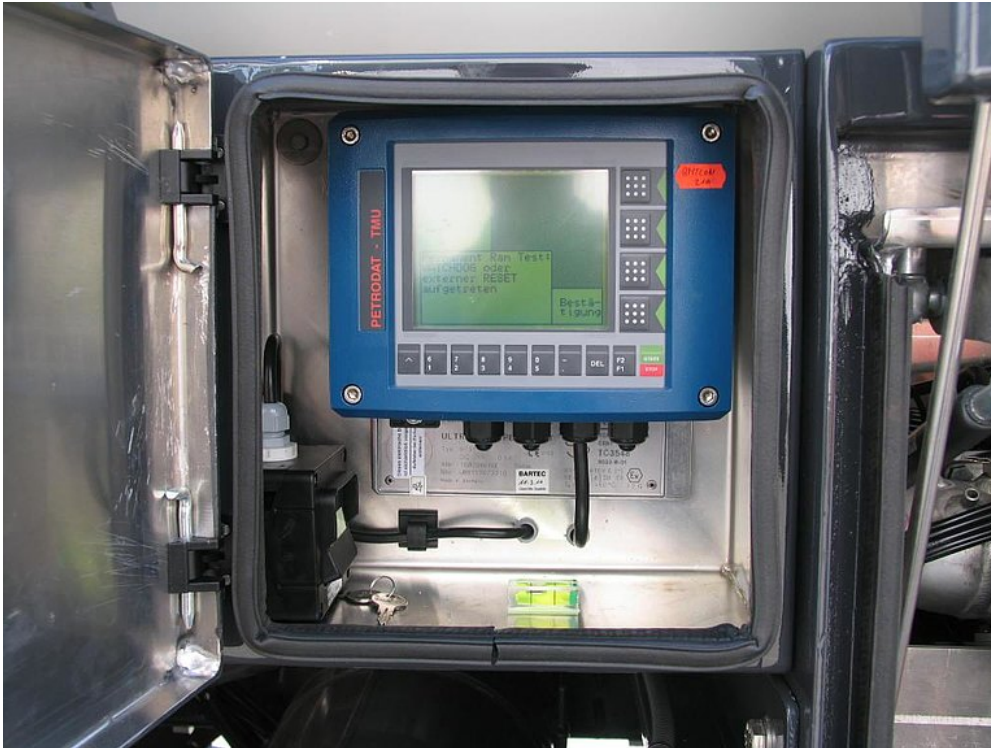
Z lewej i prawej strony oddzielna aluminiowa skrzynka do obsługi bagnetu małą poziomicą