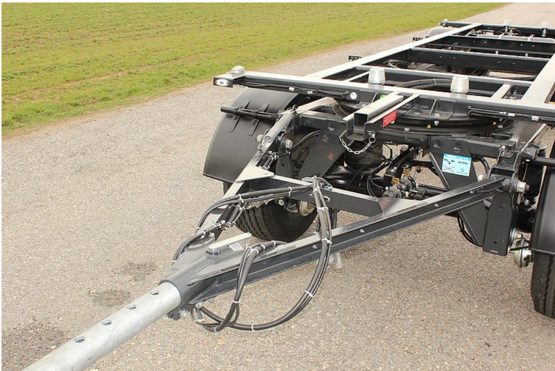
OPTIONAL: Ausziehbare Zuggabel, max. 600 mm verstellbar, mit Getofix-Deichselstütze