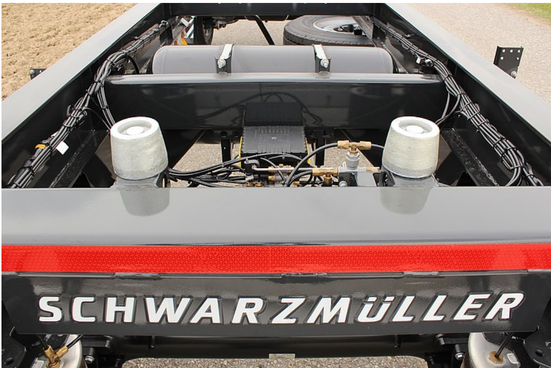
4 Stk. Einweisrollen