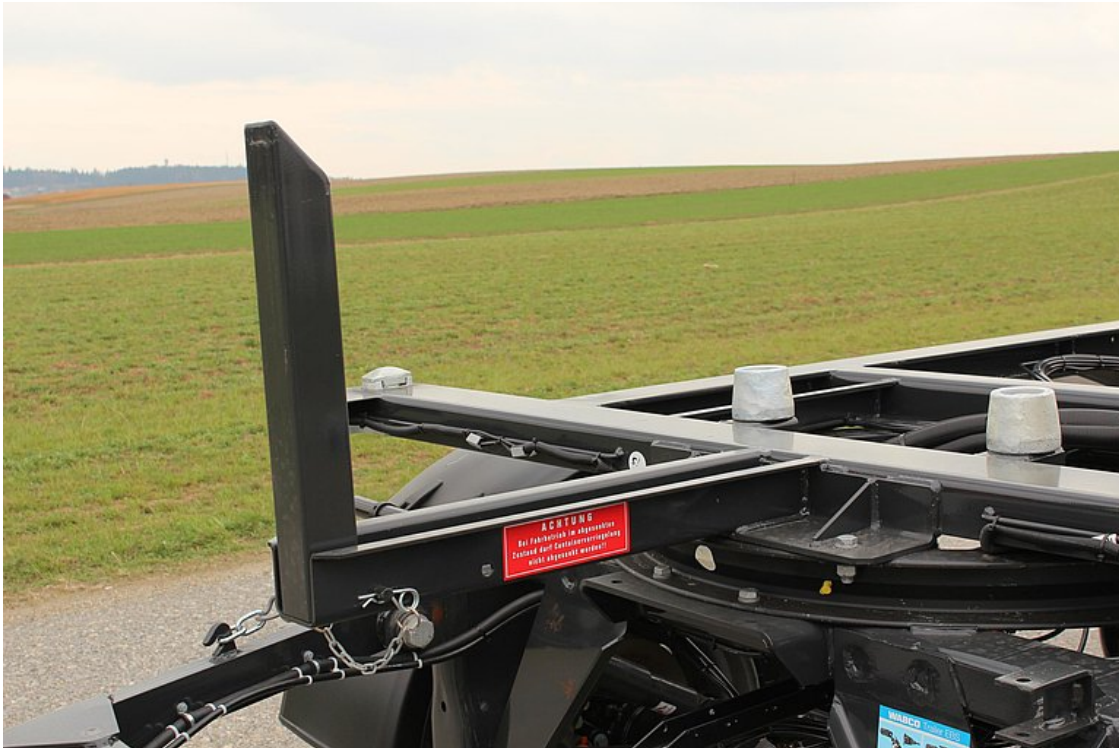
Anschlagstützte vorne umleg- und umsteckbar