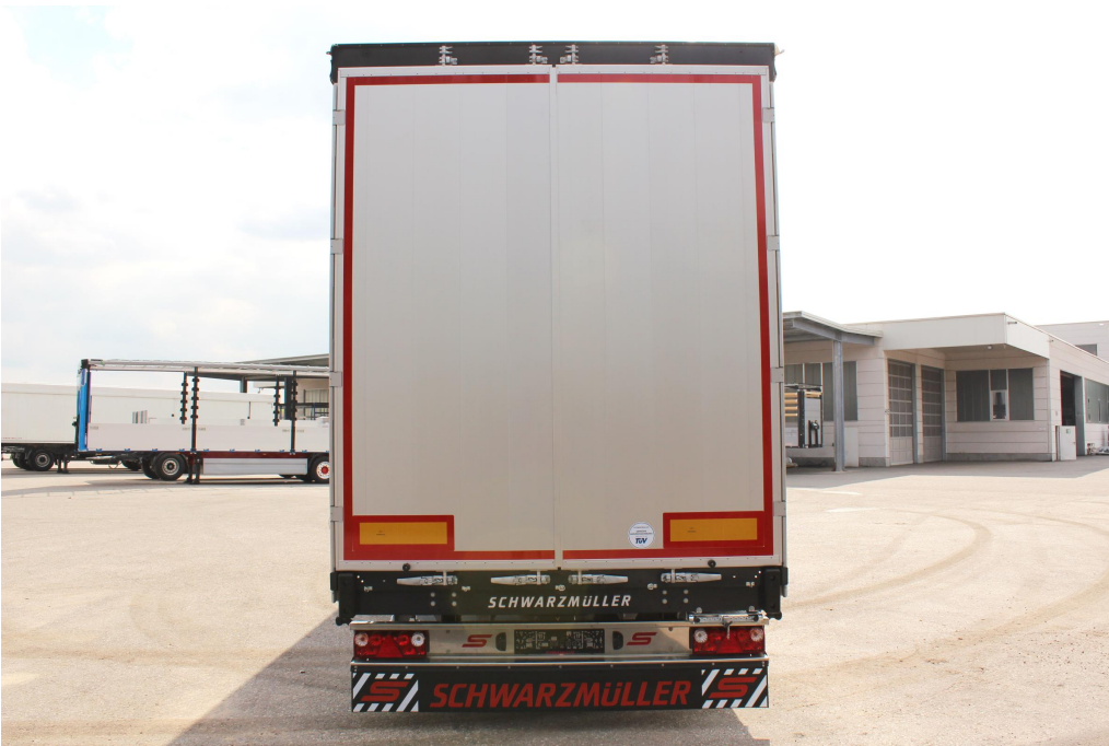
Hátul csavarkötéssel rögzített portál alumínium oszlopokkal, kétszárnyú teliajtóval alumínium profilokból