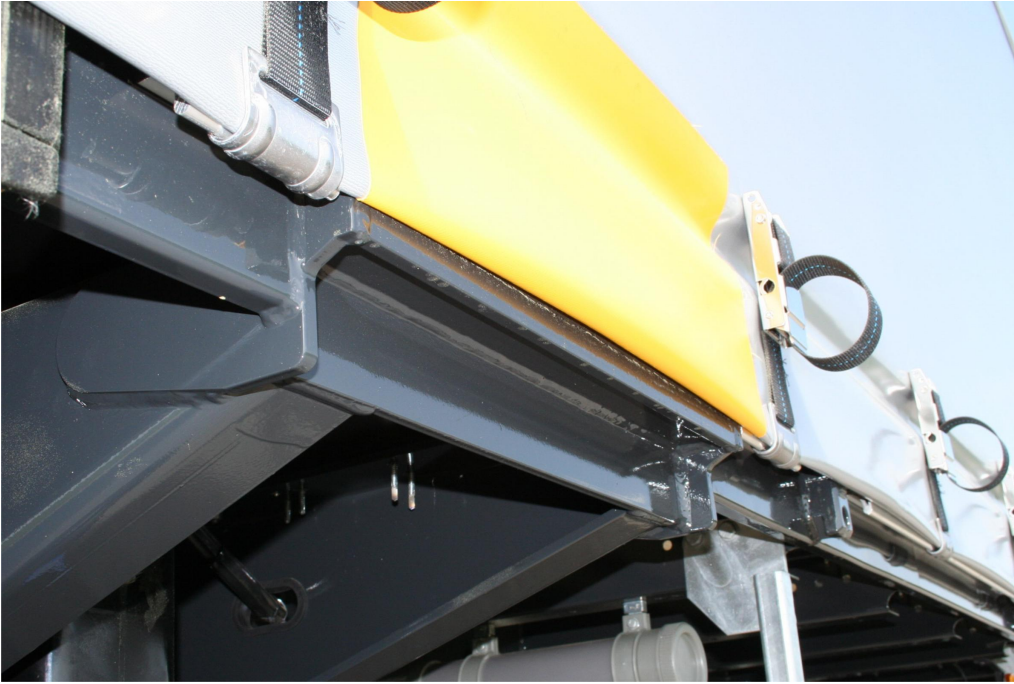
Erősített alvázfelépítés 4 fogadózseb, daruzható vasúti rakodáshoz