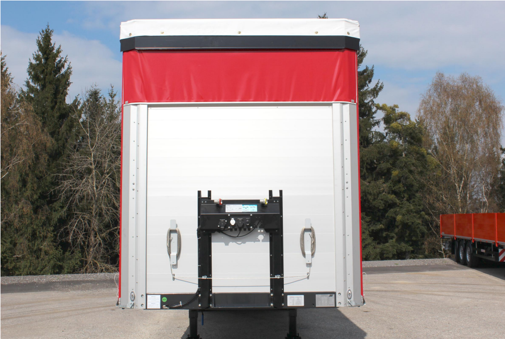
Erősített, üreges alumínium profil mellfal, aljzattartóval