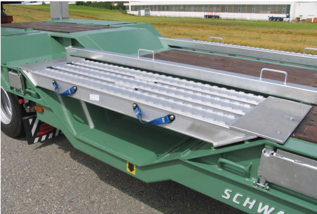
Kerékvályú a keretszegélyben, a padló kialakításhoz igazodva, átjárható alumínium fedéllel