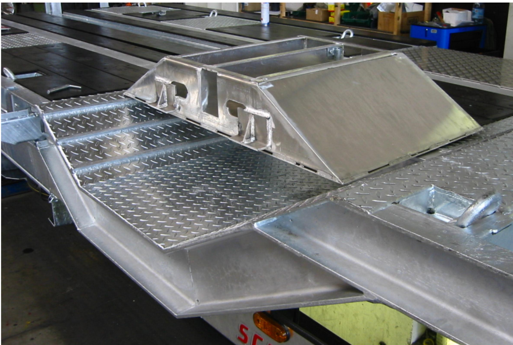
Különböző kialakítású kerékvályúk, a speciális munkagépek szállítására