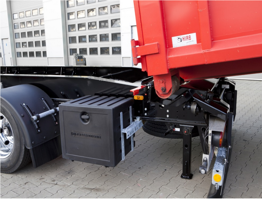
Hátsó támasztóláb a biztonságos konténeráthelyezéshez