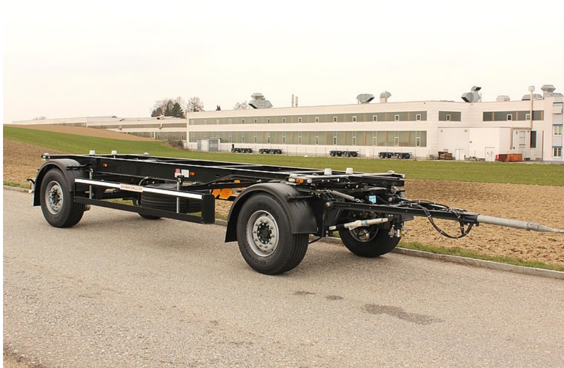
2-tengelyes, cserefelépítmény szállító pótkocsi