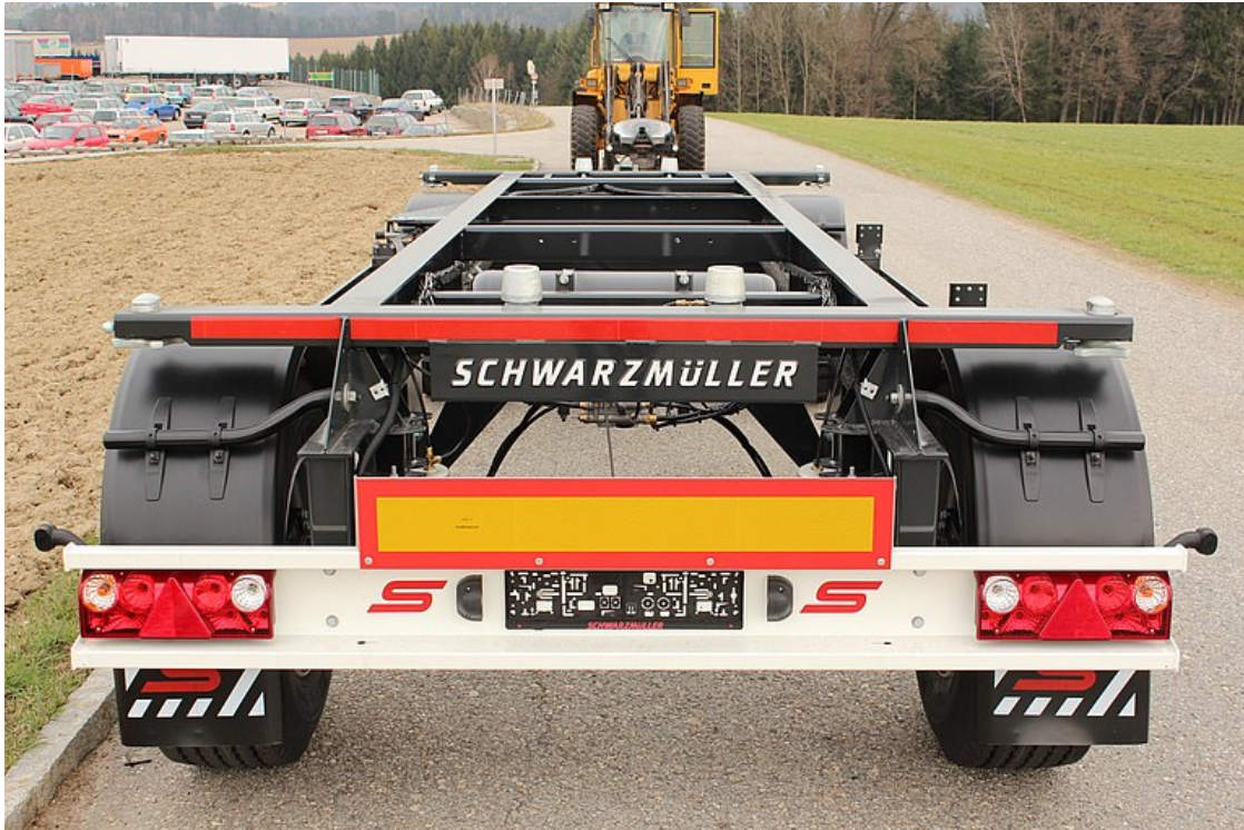
Hátsó aláfutásgátló, beépített lámpákkal