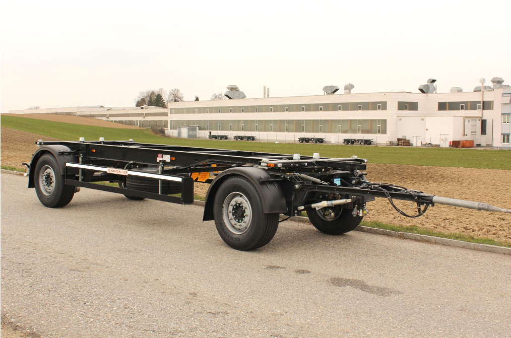
2-tengelyes, cserefelépítmény szállító pótkocsi