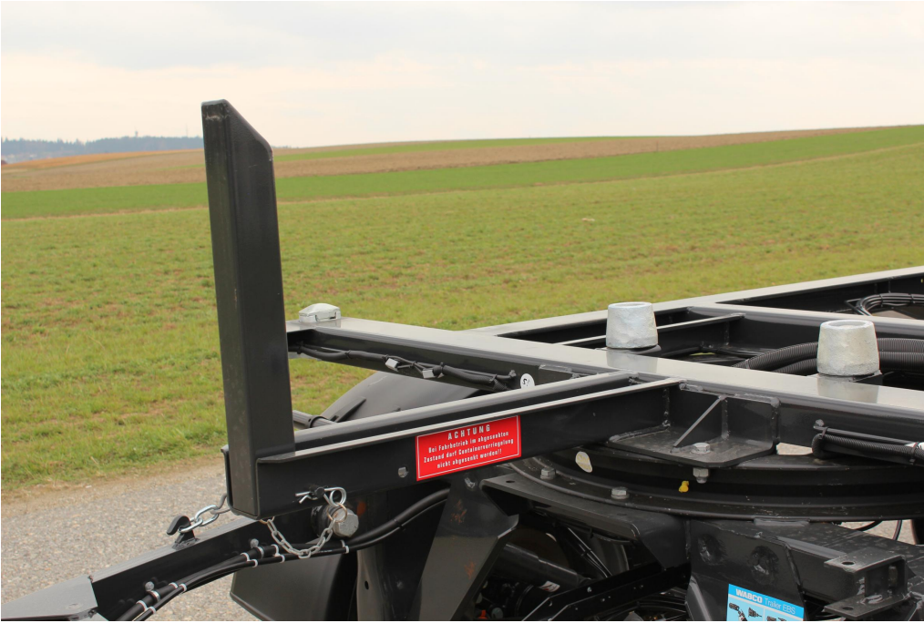
Áthelyezhető ütközők elől