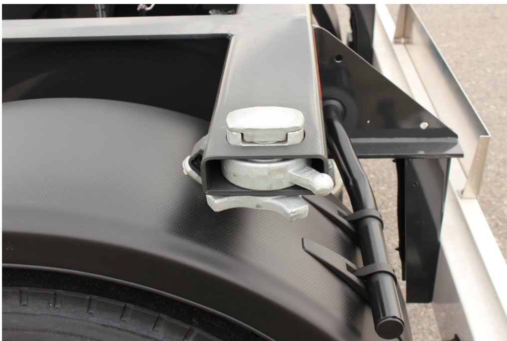
Konténer-kereszttartók és zárok EN 284 szerinti kivitelben