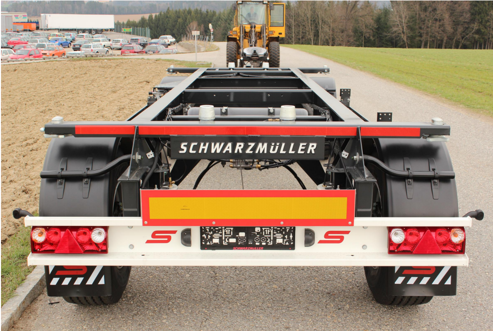
Hátsó aláfutásgátló, beépített lámpákkal