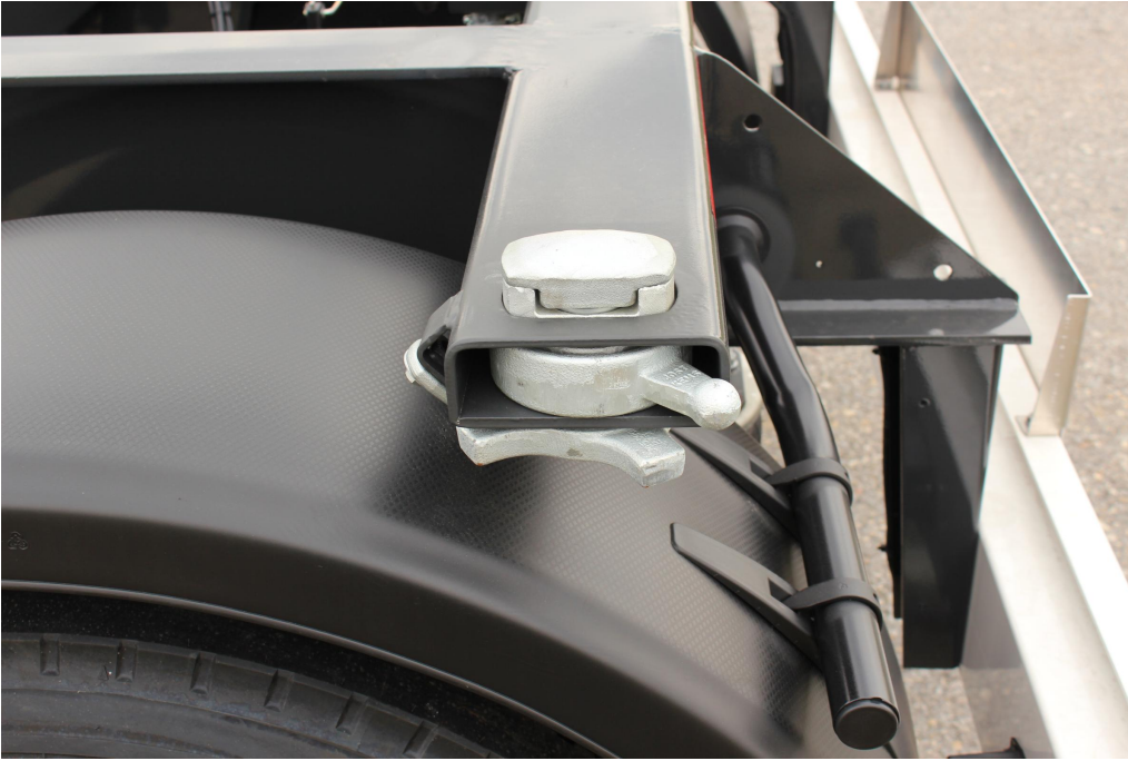
Konténer-kereszttartók és zárok EN 284 szerinti kivitelben (20 láb hosszú rögzítőméret)