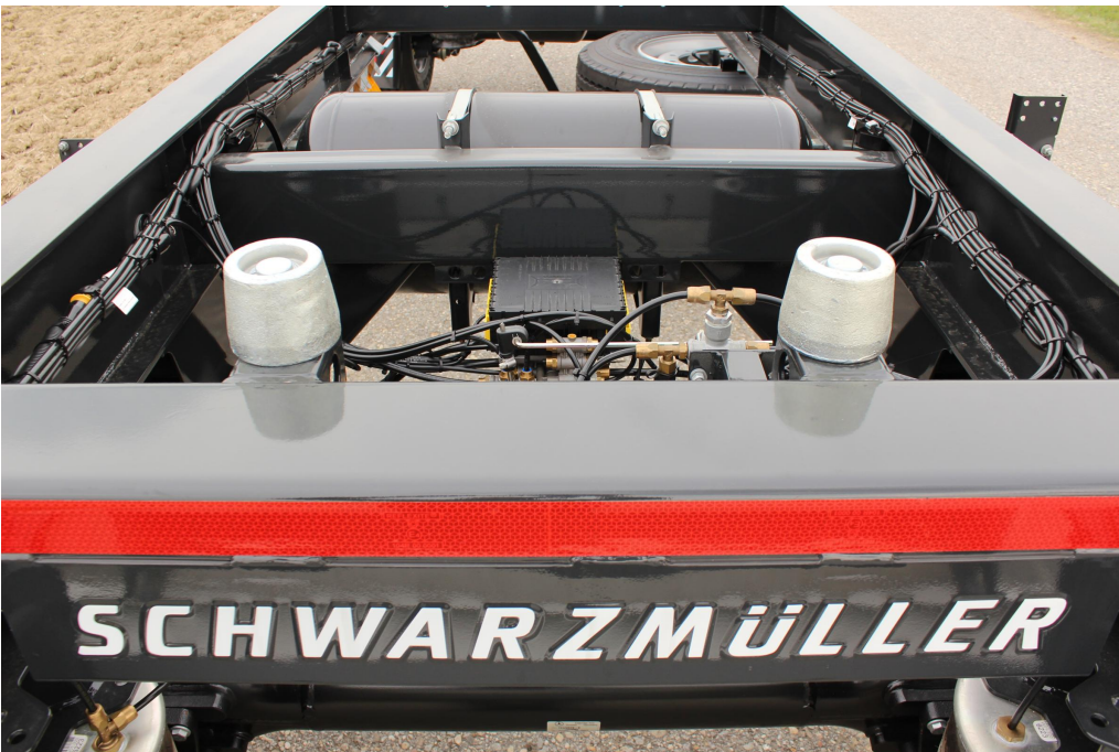
4 db vezetőgörgő