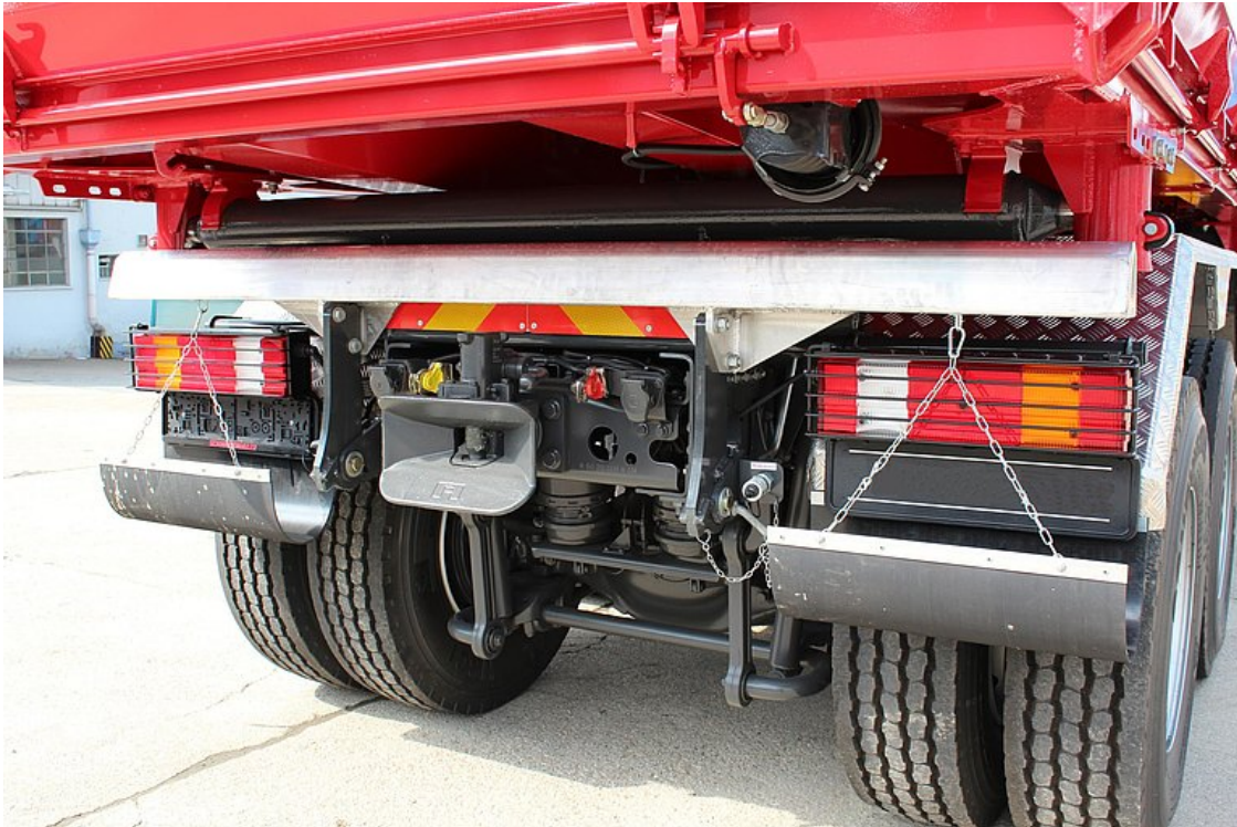
OPCIONÁLIS: felhajtható, alumínium hátsó alufutásgátló, Finisher használathoz