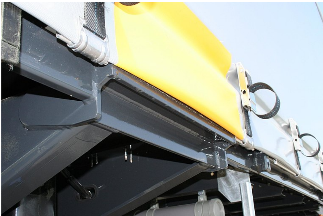
Erősített alvázfelépítés 4 fogadózseb, daruzható vasúti rakodáshoz