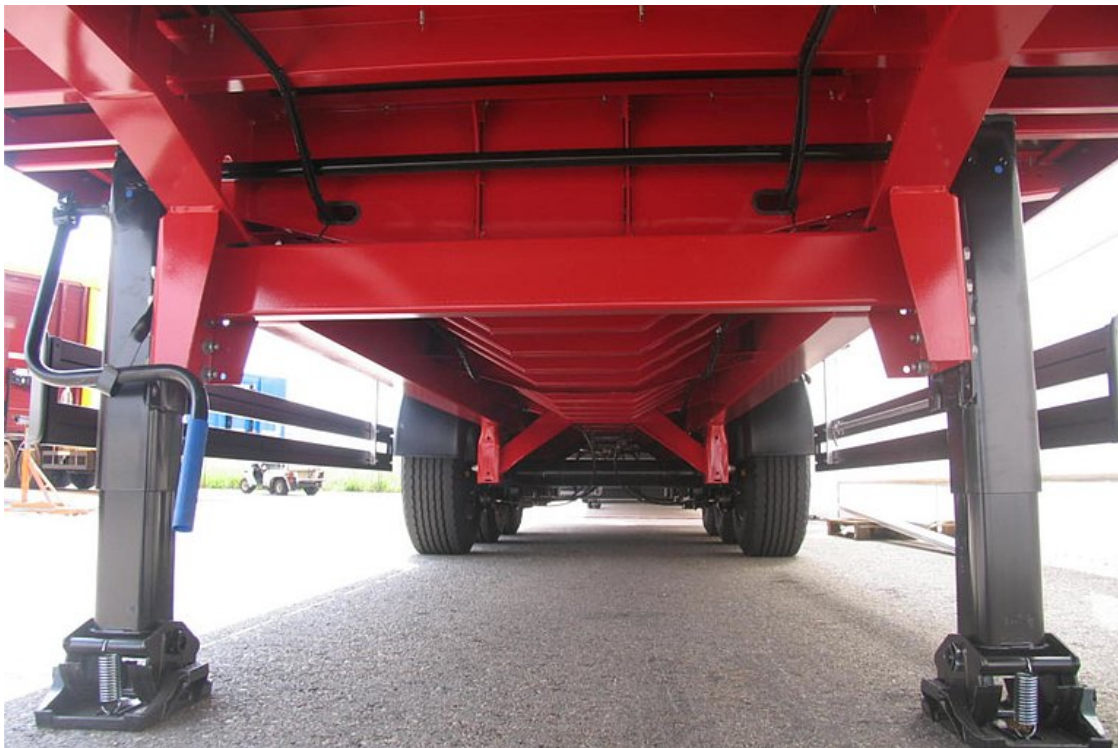
Erősített alvázkonstrukció, a súlypontban elhelyezett, legalább 2.000 mm hosszban szállított 27t tömegű kábeldobhoz