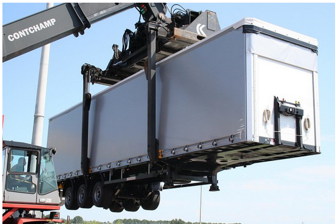
Rakodási példa vasúti szállításnál