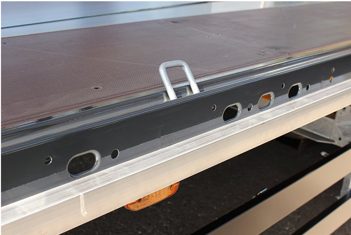
Furatos keretszegély (a mellfaltól mérten ca. 3.000 mm-től ) ca. 100 mm lyuktávolsággal, 40/25 mm-es oválfuratokkal a DIN EN 12640 szabvány szerint és 21 pár süllyesztett 2,5 t lekötőgyűrű a keretszegélyben / 5 pár 4 t lekötőgyűrűvel a vályú mentén