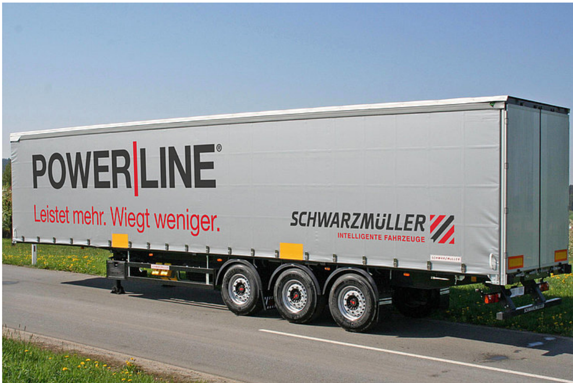
3-tengelyes, függönyponyvás, síkplátós félpótkocsi - tekercsszállító - HuckePack