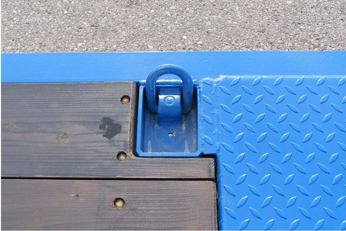
2 pár felhajtható, süllyesztett lekötőgyűrű a platóban