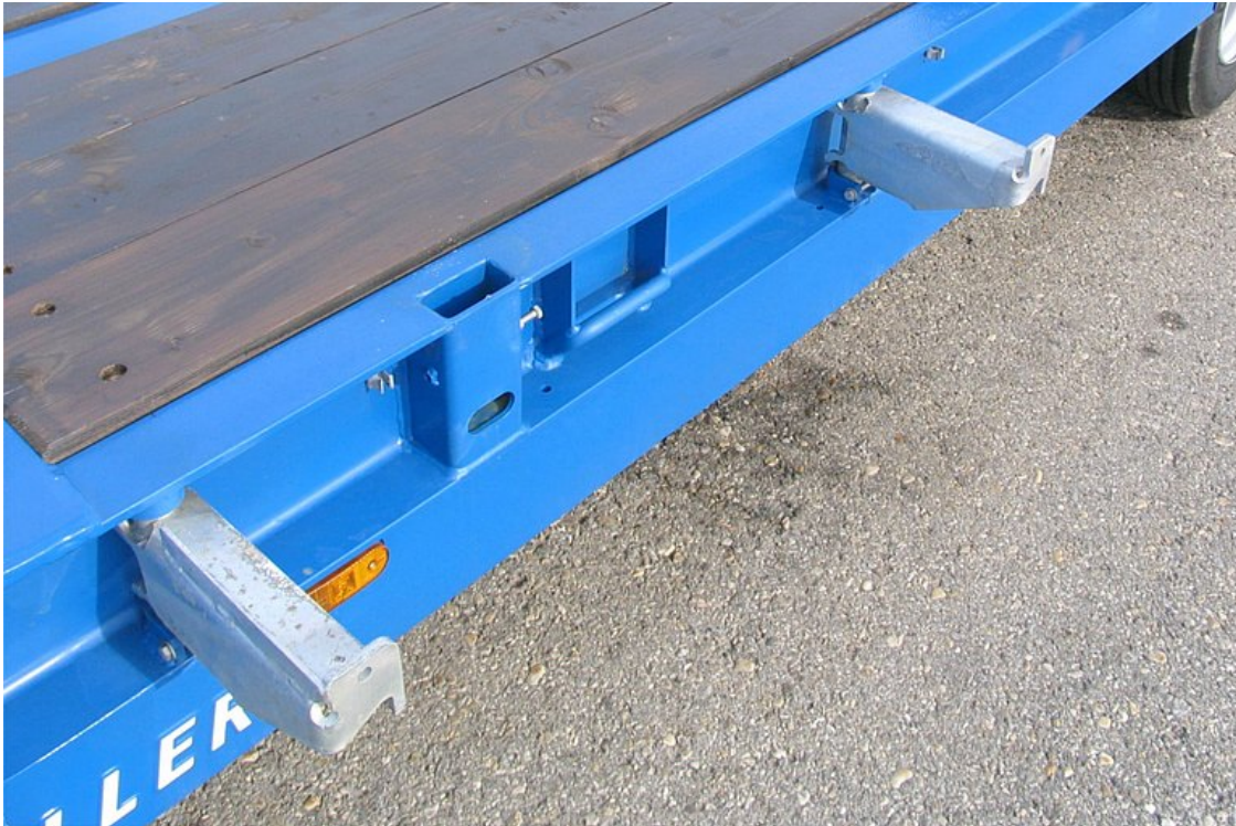
OPCIONÁLIS: kihajtható, kiforgatható szélesítések pallókkal, túlméretes áruk szállítására