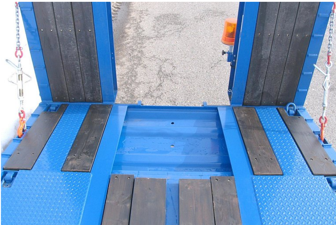
OPCIONÁLIS: markolókanál-vályú - mélyítés hátul a hossztartók között