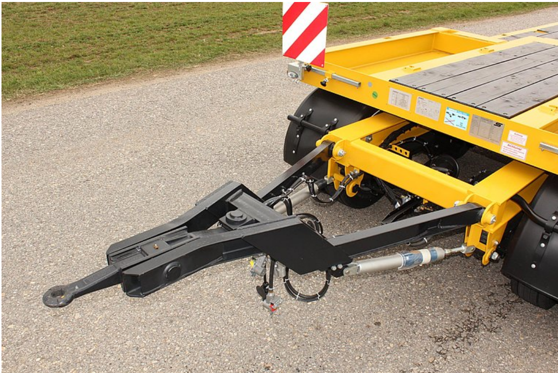
Hajlított vonóháromszög, állítható 40 + 50 mm vonószemmel