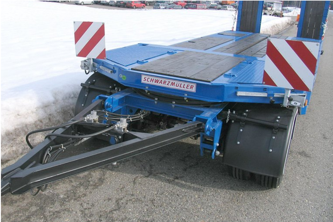
Forgószámoly és vonóháromszög - OPCIONÁLIS: kihúzható figyelmeztető táblával