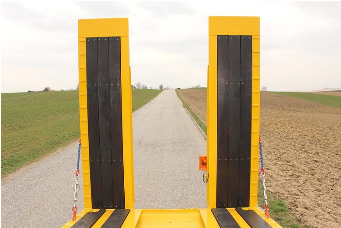
2 lehajtható, 1-részes felhajtórámpa keményfa betéttel