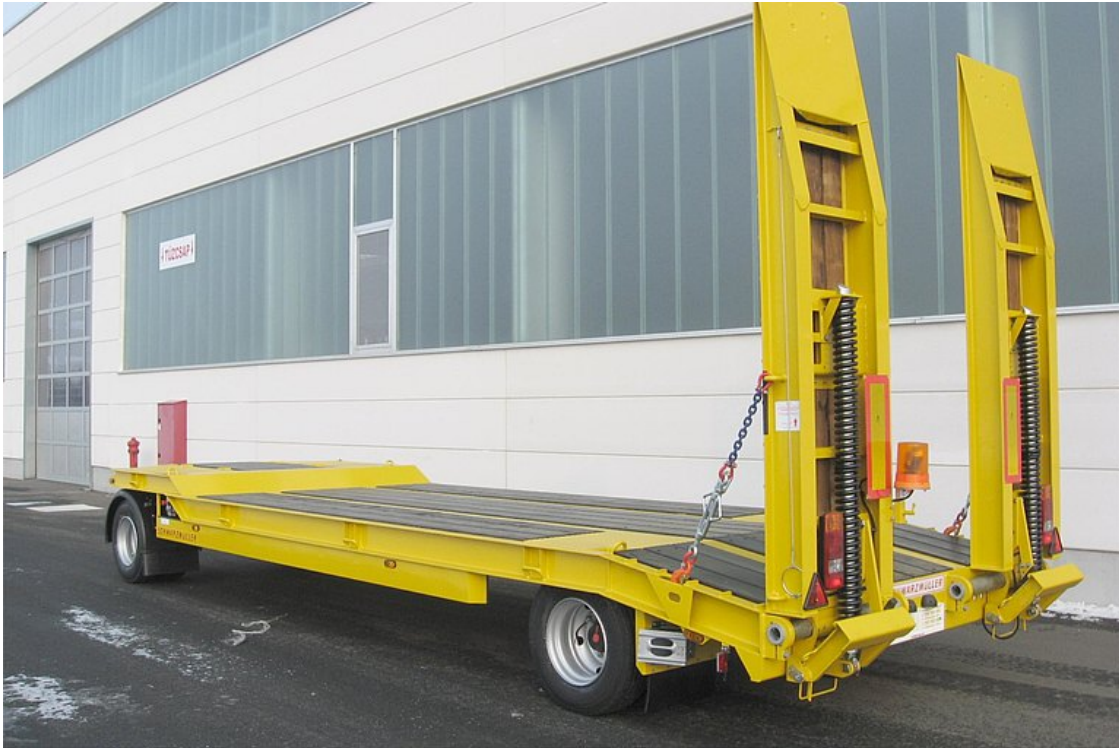
2-tengelyes, hajlított rakfelületű, nehézgépszállító pótkocsi