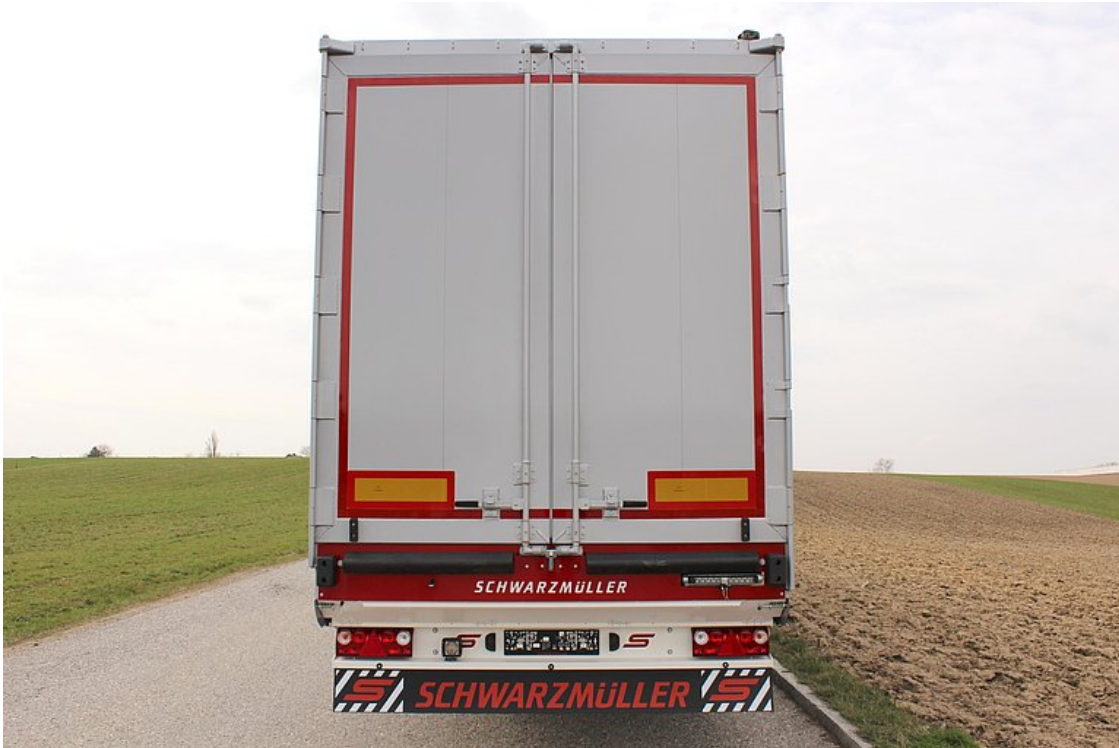
Hátfal = kétszárnyú teliajtó, ajtószárnyanként 1 rúdzárral, pneumatikusan vezérelt biztonsági reteszelés