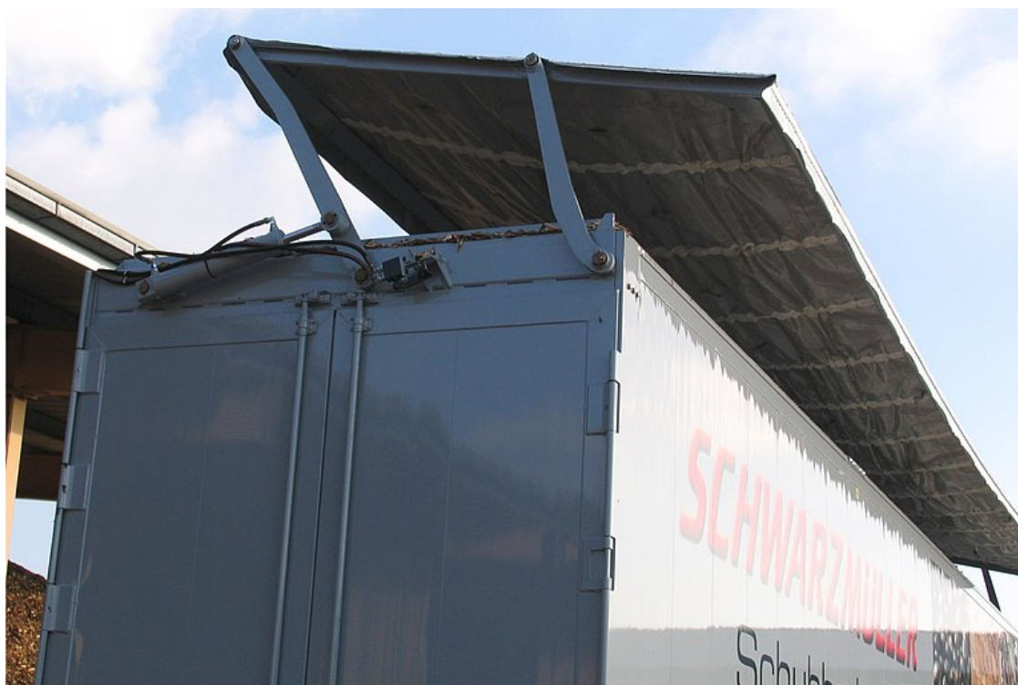
OPCIONÁLIS: hidraulikus tetőszerkezet körbefutó kerettel és műanyag ponyvával