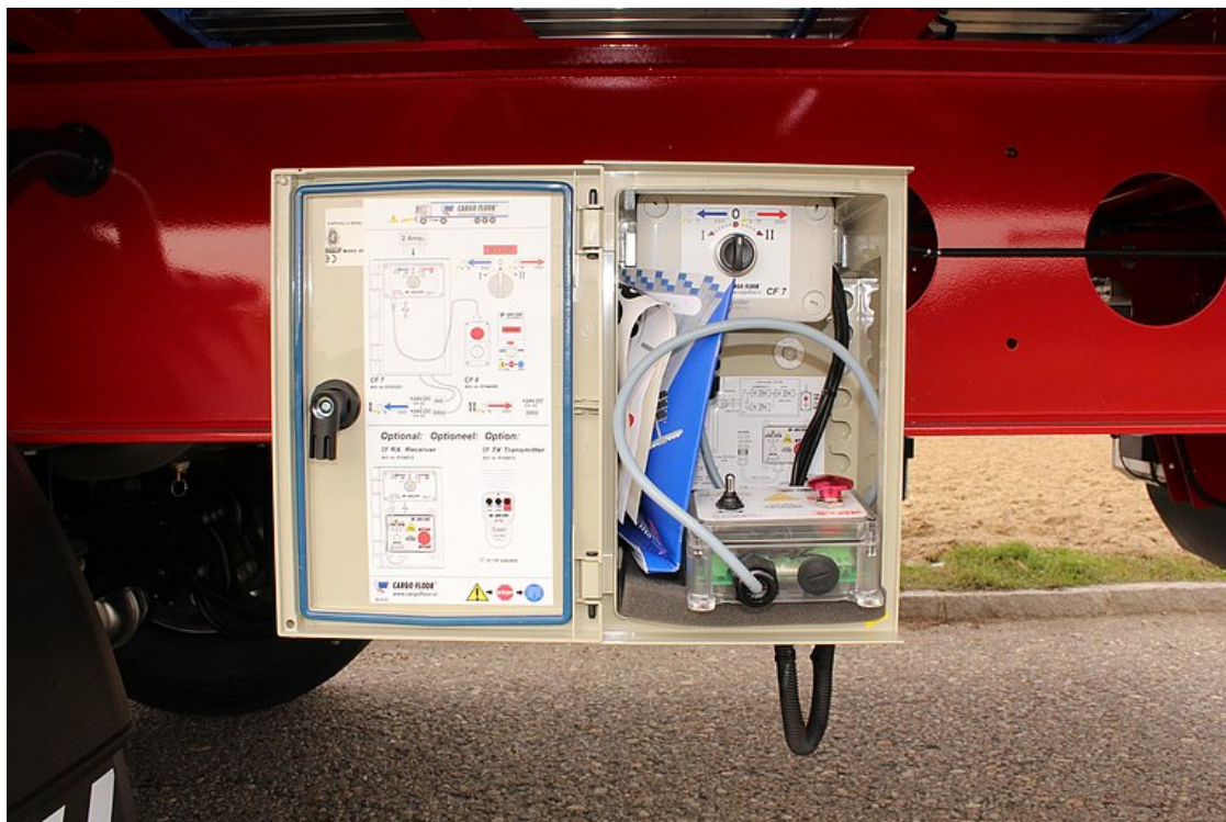
A padló irányítását szolgáló kezelőegység és 10 m hosszú kábel egy vízszigetelt ládában kerül elhelyezésre