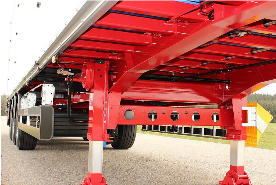
Csavarodásálló, acél alvázkonstrukció