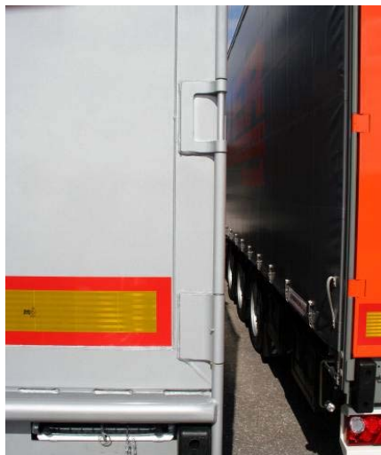
Schweißnähte der Scharniere auf Risse prüfen