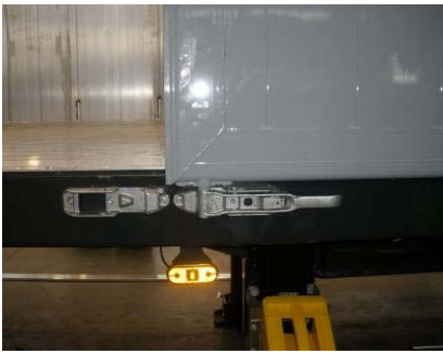
Schrauben der Drehstangenverschlüsse oben und unten auf Festsitz prüfen