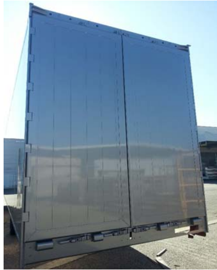
Schrauben auf Festsitz, Schweißnähte auf Risse prüfen