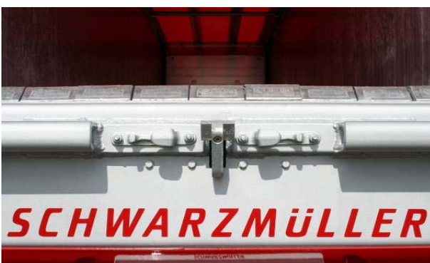
Schrauben der Verschlusszapfen an der Hecktür oben und unten auf Festsitz prüfen