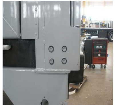
Schraubbefestigung der Säulen vorne, mitte, mitte unten und hinten auf Festsitz prüfen