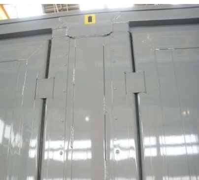
Nieten der Mittelrunge auf Festsitz prüfen, Scharniere auf Spiel prüfen