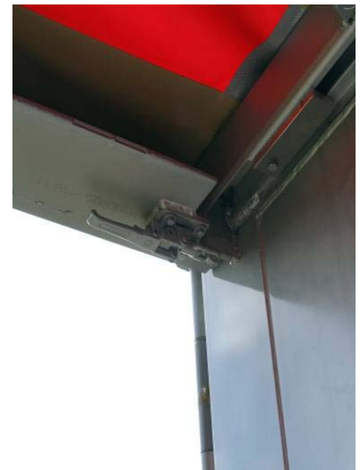
Verriegelung am Heckportal-balken: Schrauben auf Festsitz, Schweißnähte auf Risse prüfen