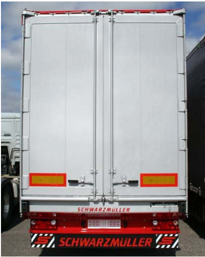
Schrauben auf Festsitz, Schweißnähte auf Risse prüfen