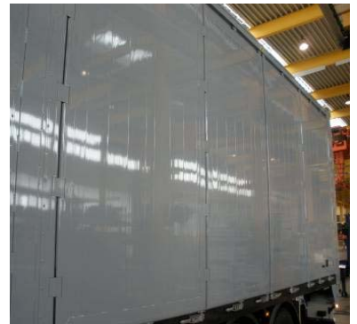
Scharniere auf Spiel und Schweißnähte auf Risse prüfen