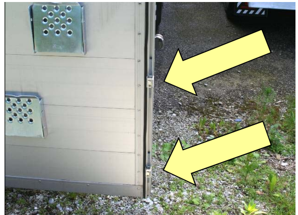
Gegenhalter an beiden Fahrzeugseiten auf Festsitz prüfen