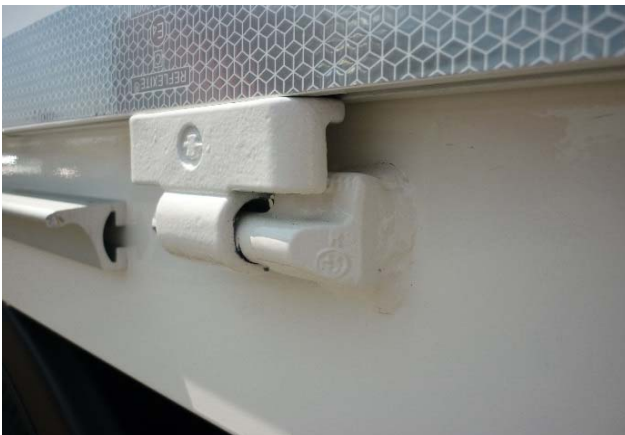
Scharnierkegel: Schweißnähte auf Risse prüfen