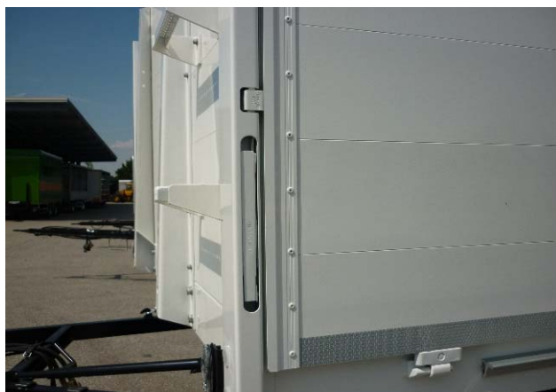
Verschraubung Ecksäule vorne auf Festsitz prüfen