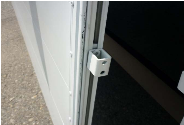
Gegenhalter auf Festsitz und Beschädigung prüfen