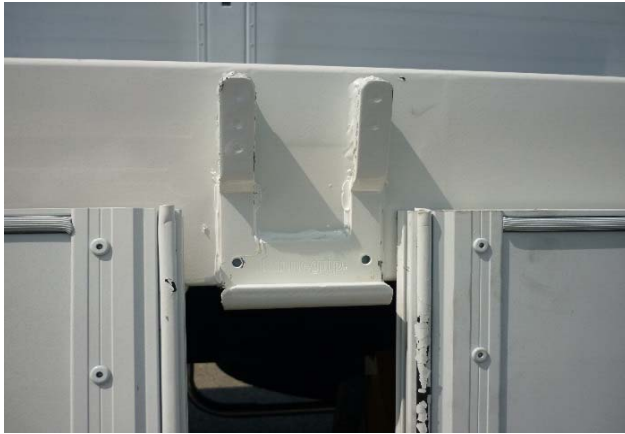
Rungenlager: Schweißnähte auf Risse prüfen