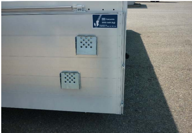
Rückwand: Vernietung auf Festsitz prüfen