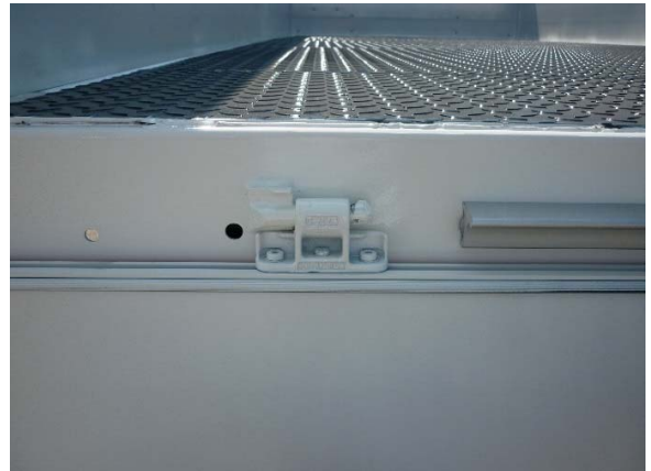
Scharnierkegel: Schweißnähte auf Risse prüfen