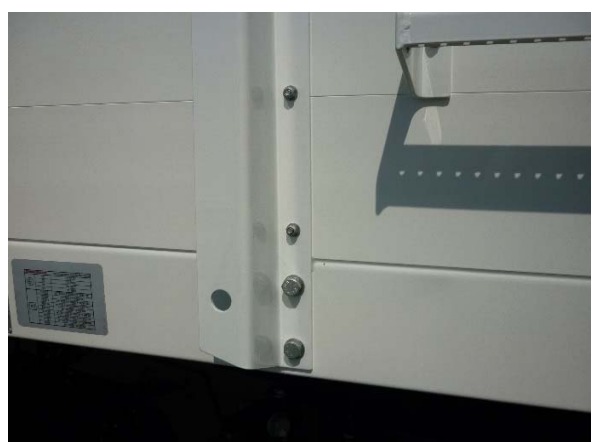
Verschraubung Vorderwandstütze auf Festsitz prüfen