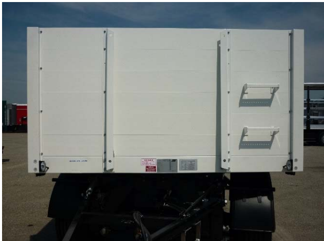
Alle Nieten und Schrauben auf Festsitz prüfen