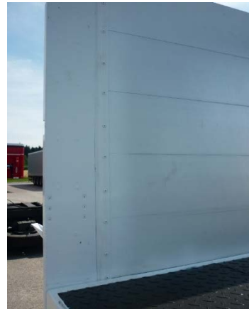
Bordwände: Vernietung auf Festsitz prüfen