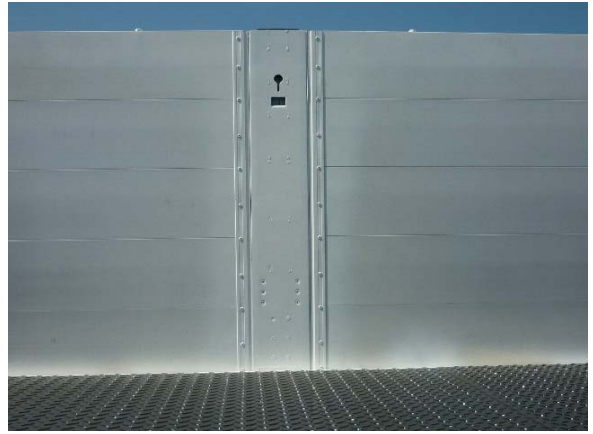
Bordwände: Vernietung auf Festsitz prüfen