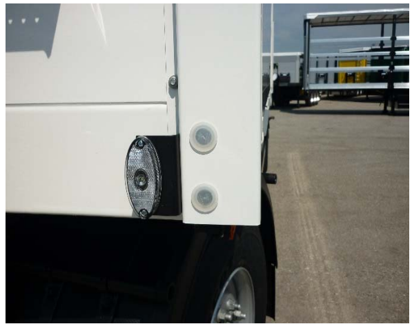
Gerätehalter: Alle Nieten und Schrauben auf Festsitz prüfen