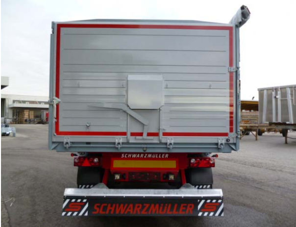
Rückwand: Schweißnähte auf Risse prüfen