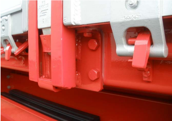
Rungenlager: Schweißnähte auf Risse prüfen, bewegliche Teile auf Verschleiß, Verschraubungen auf Festsitz