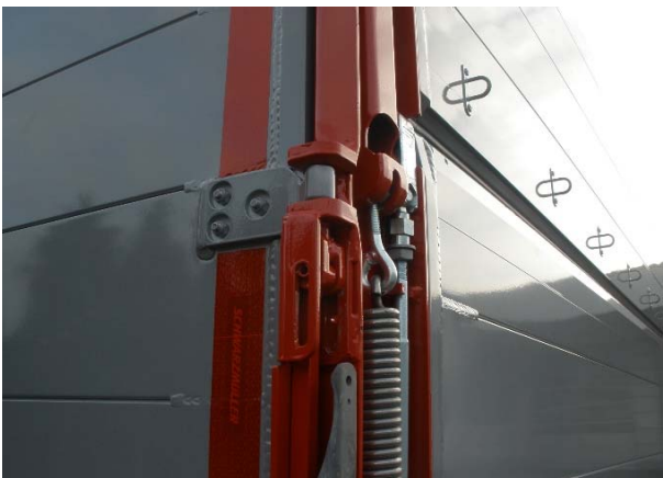
Rückwand zusätzlich schwenkbar: Sämtliche bewegliche Anbauteile wie Scharniere, Verschlüsse, Bolzen, Zapfen etc. auf Verschleiß und Funktion prüfen