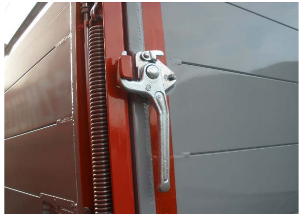
Verschluss auf Verschleiß und Funktion