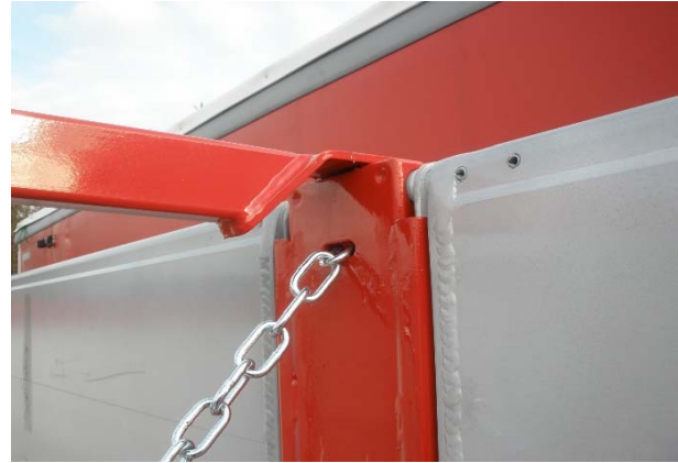
allgemeine Sichtprüfung der Mittlungenverbindung, bzw. Kettenverbindung