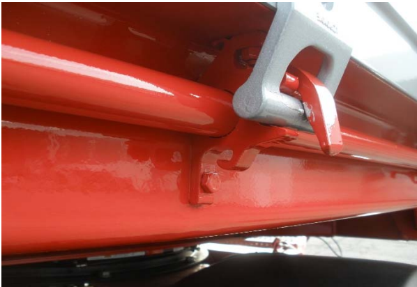
Zentralverriegelung: Sichtprüfung auf Abnutzung, Spiel, Verschraubung etc.