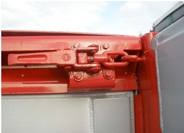
Verriegelung oberer Querbalken der Rückwand auf Festigkeit und Funktion