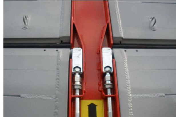
Bordwände: Schweißnähte innen und aussen auf Risse prüfen