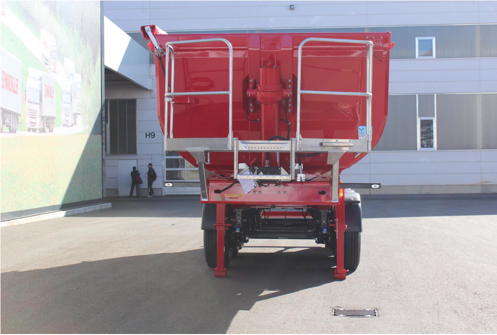
Isolierte Vorderwand mit hartverchromtem, qualitativ hochwertigem Frontkippszylinder