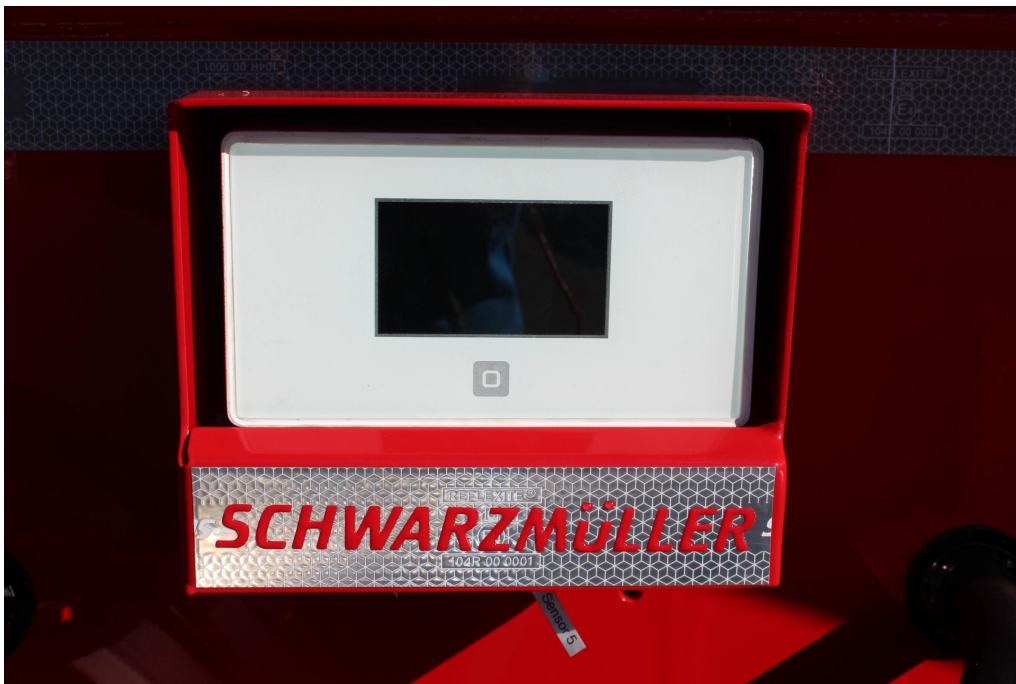
Temperatur-Auswerteeinheit in robustem Kasten