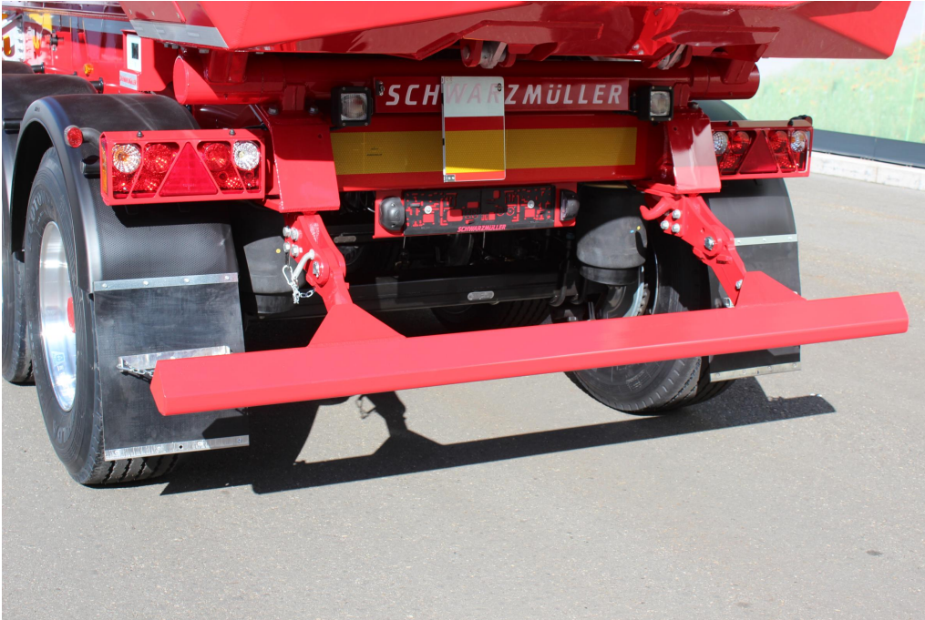
Aluminium-Trapez-Unterfahrerschutz klappbar, optional pneum. hochklappbar