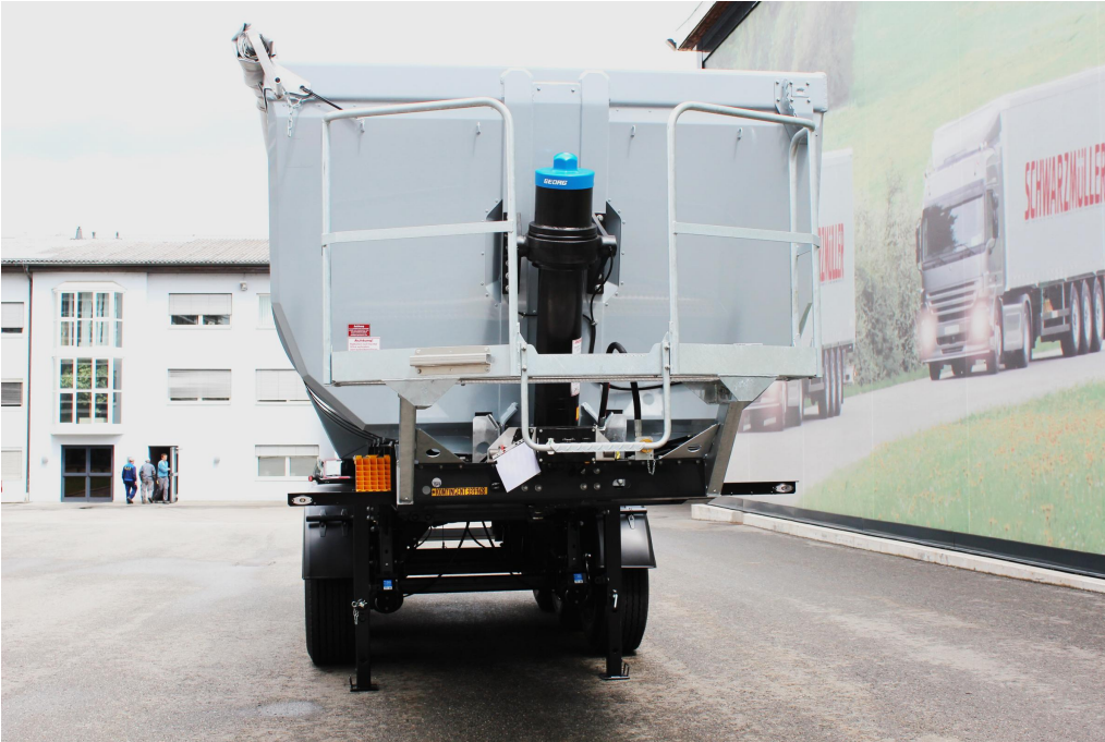
Isolierte Vorderwand mit hartverchromtem, qualitativ hochwertigem Frontkippszylinder