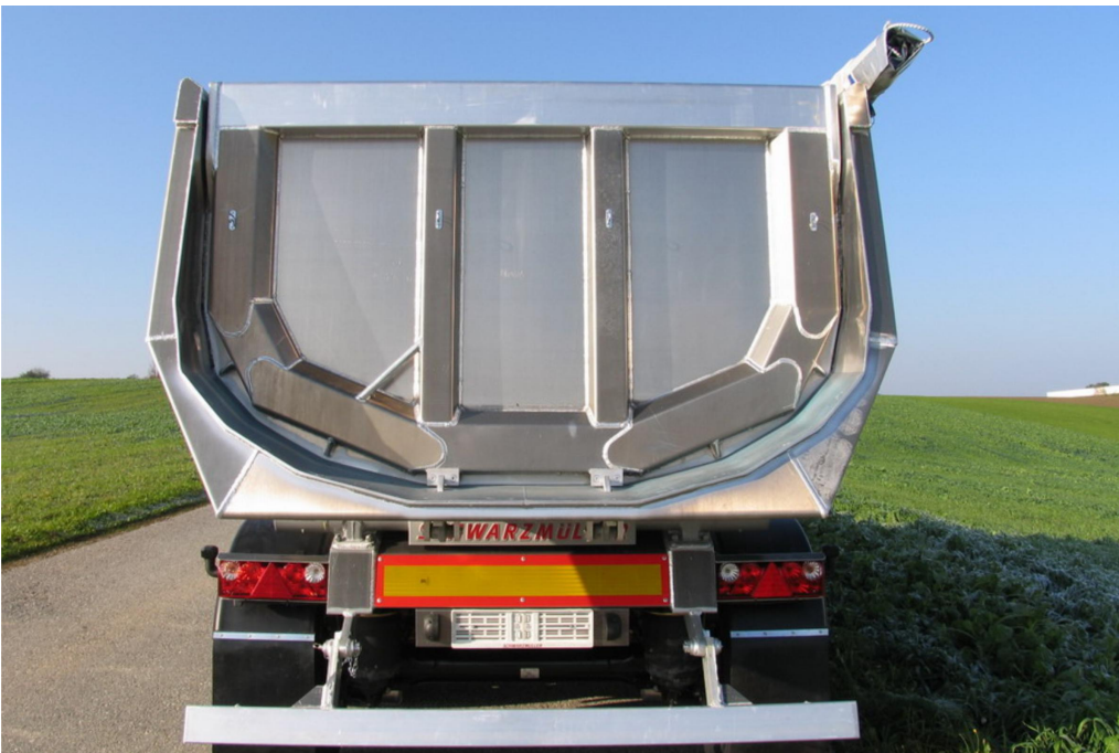
Rückwand = Pendelwand mit versenkter Lagerung und autom.-mech. 2-Haken-Zentralverschluss