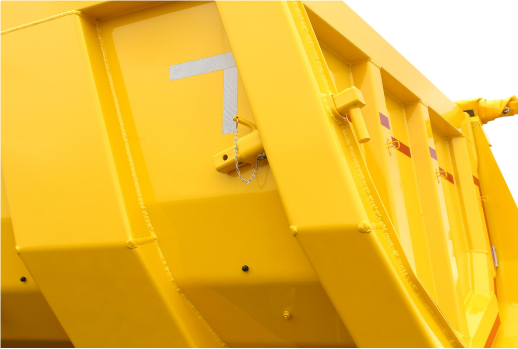
OPTIONAL: Dosiereinrichtung für Pendel-Rückwand mit ausziehbaren Rohranschlag