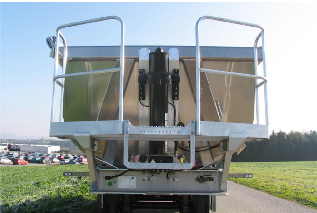
Schräge Vorderwand mit hartverchromtem, qualitativ hochwertigem Frontkipppylinder