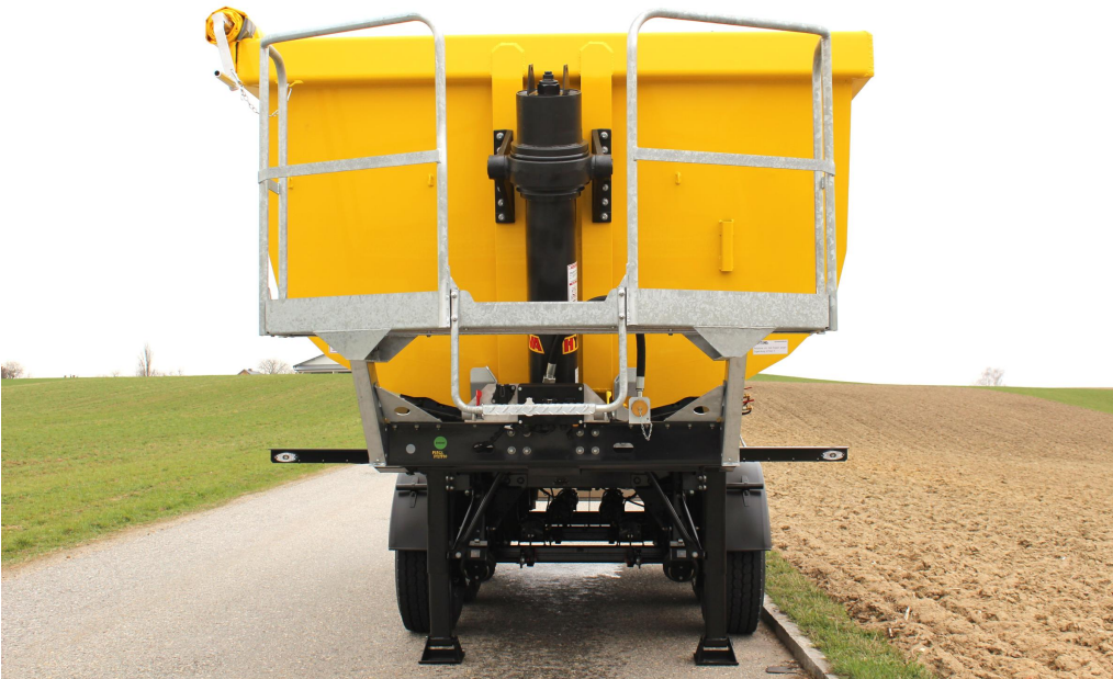
Stehpodest an der Vorderwand zur Bedienung der Rollplane