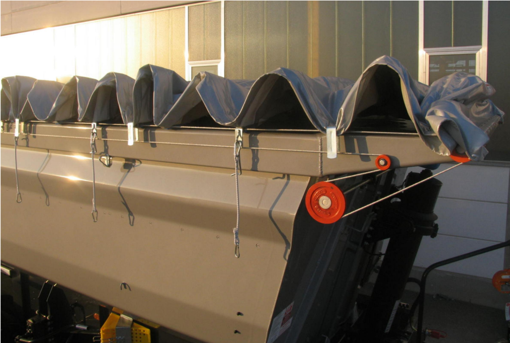
OPTIONAL: Rollverdeck - wahlweise manuell oder über elektrische Fernsteuerung bedienbar