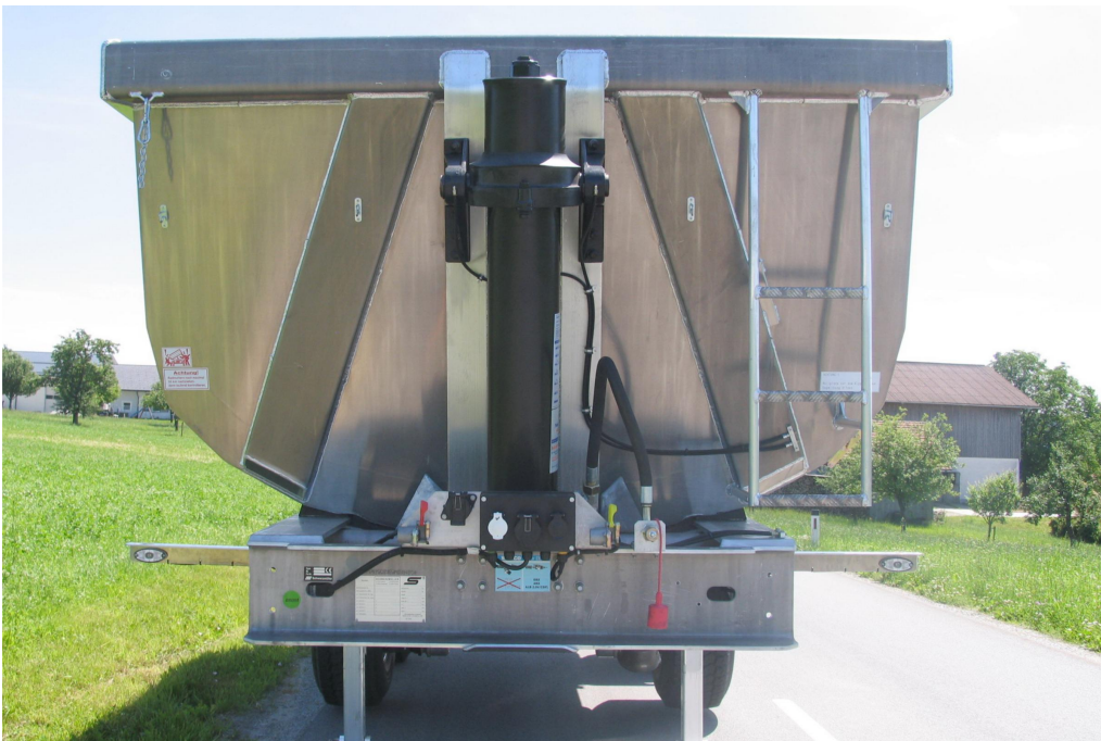
Schräge Vorderwand mit hartverchromtem, qualitativ hochwertigem Frontkipppzylinder