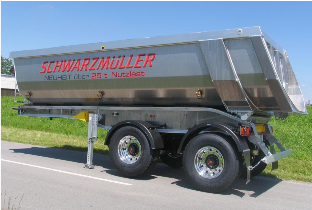
2-Achs-Vollaluminium-Segmentmulden-Kippsattelanhänger - Radstand 1.810 mm