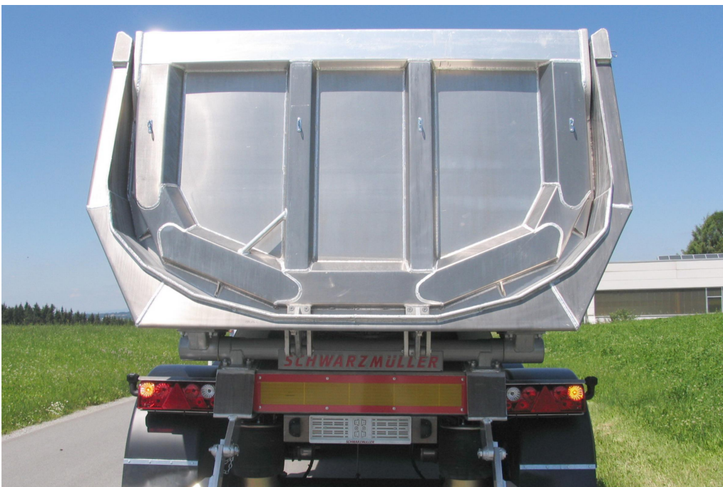
Rückwand = Pendelwand mit versenkter Lagerung und autom.-mech. 2-Haken-Zentralverschluss