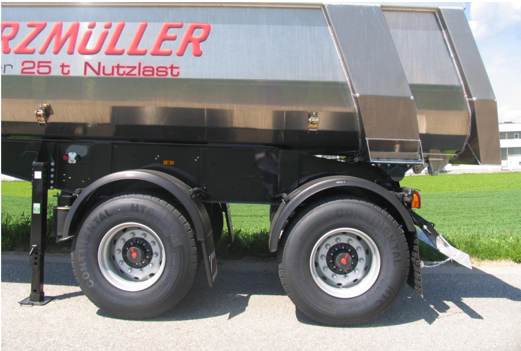
Achsen mit Radstand 1.810 mm