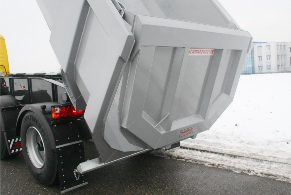
Rückwand = Pendelwand mit versenkter Lagerung und autom.-mech. 2-Haken-Zentralverschluss