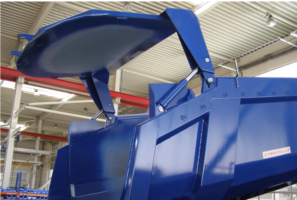
OPTIONAL: Sonder-Pendelrückwand für extrahohe Öffnung mit versenkter Lagerung und automatische Hydraulikbetätigung