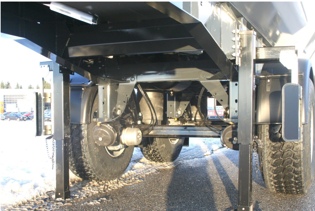
Stabile und verwindungssteife Fahrgestellkonstruktion mit zusätzlichen Torsionsrohren