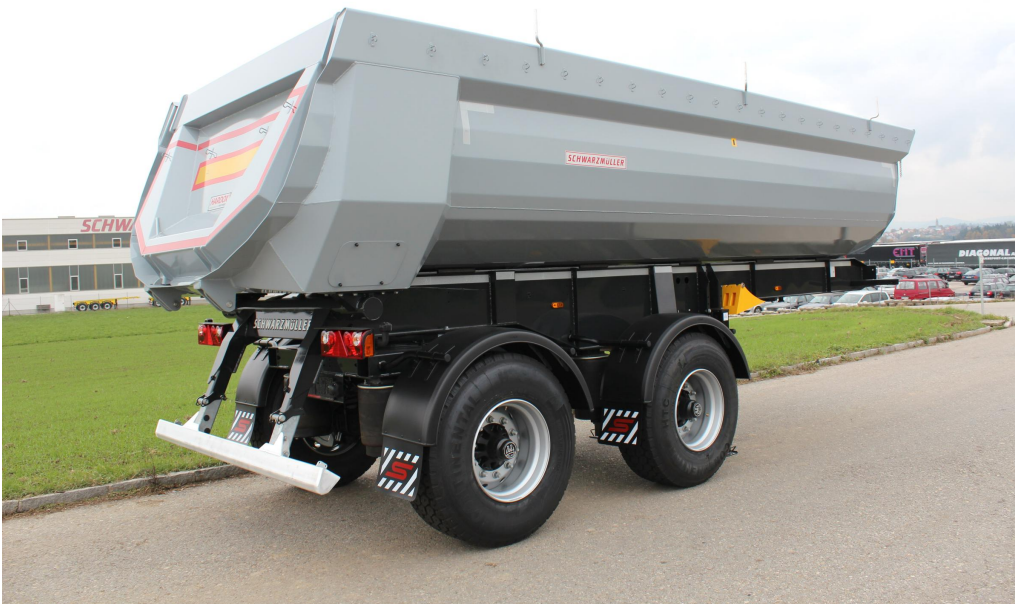
2-Achs-Stahl-Segmentmulden-Kippsattelanhänger - Radstand 1.810 mm