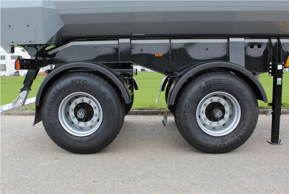
Achsen mit Radstand 1.810 mm