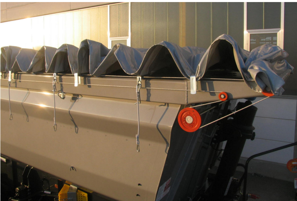
OPTIONAL: Rollverdeck - wahlweise manuell oder über elektrische Fernsteuerung bedienbar