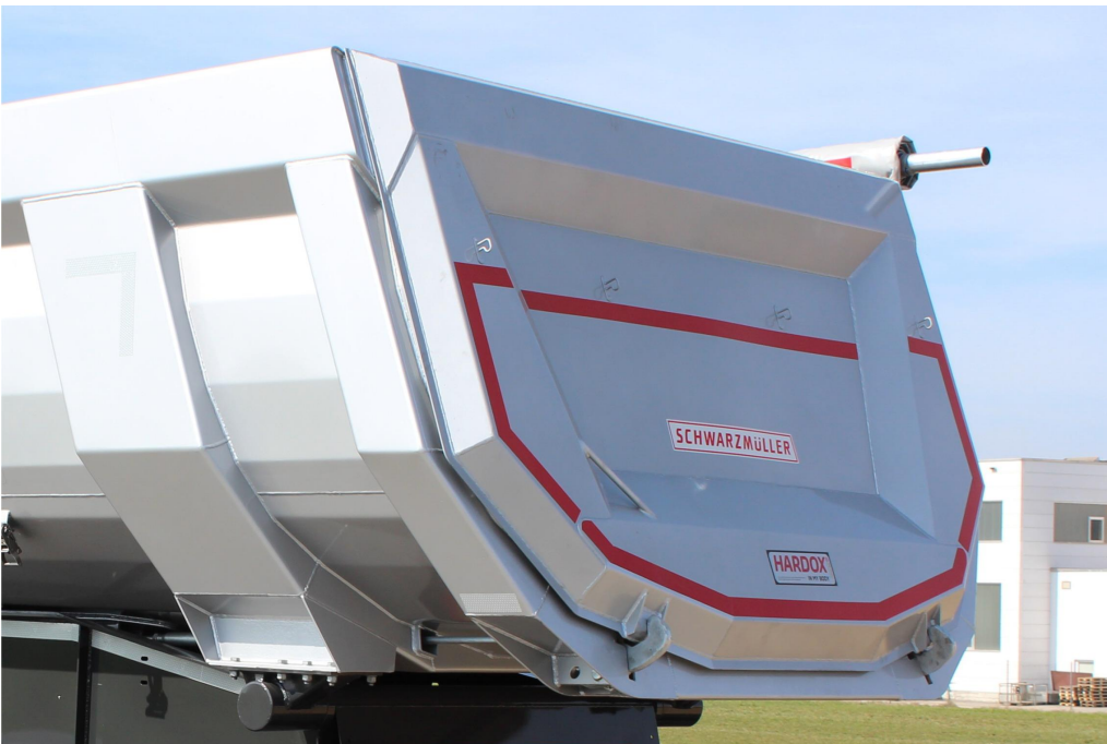
OPTIONAL: Außenliegende Rückwand - dadurch ist ein höheres Ladevolumen gewährleistet