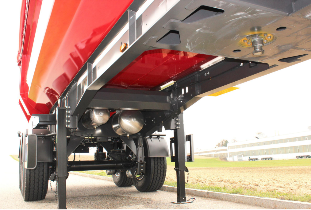
Stabile und verwindungssteife Fahrgestellkonstruktion mit zusätzlichen Torsionsrohren