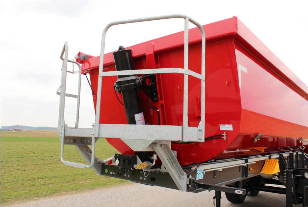
Stehpodest an der Vorderwand zur Bedienung der Rollplane