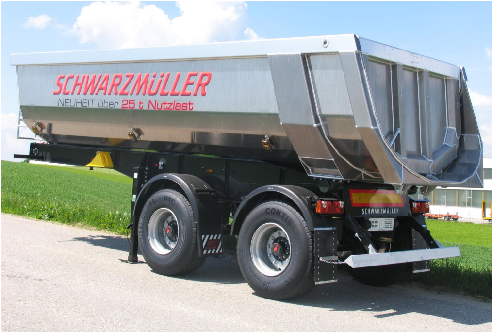
2-Achs-Aluminium-Segmentmulden-Kippsattelanhänger - Radstand 1.810 mm