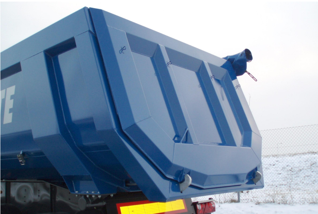
OPTIONAL: Außenliegende Rückwand - dadurch ist ein höheres Ladevolumen gewährleistet