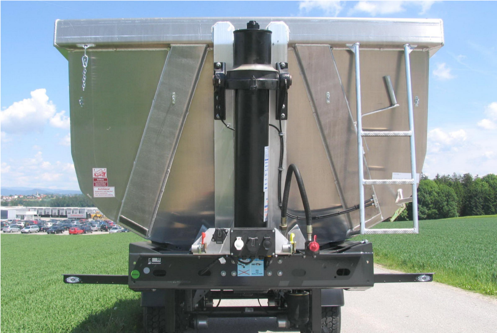
Schräge Vorderwand mit hartverchromtem, qualitativ hochwertigem Frontkippzylinder