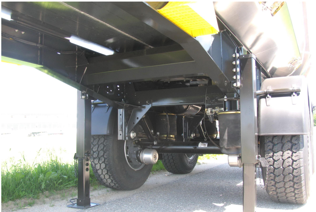
Stabile und verwindungssteife Fahrgestellkonstruktion mit zusätzlichen Torsionsrohren