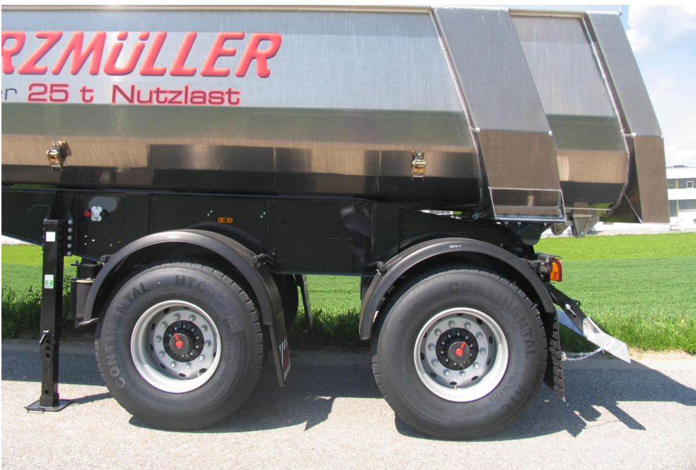
Achsen mit Radstand 1.810 mm