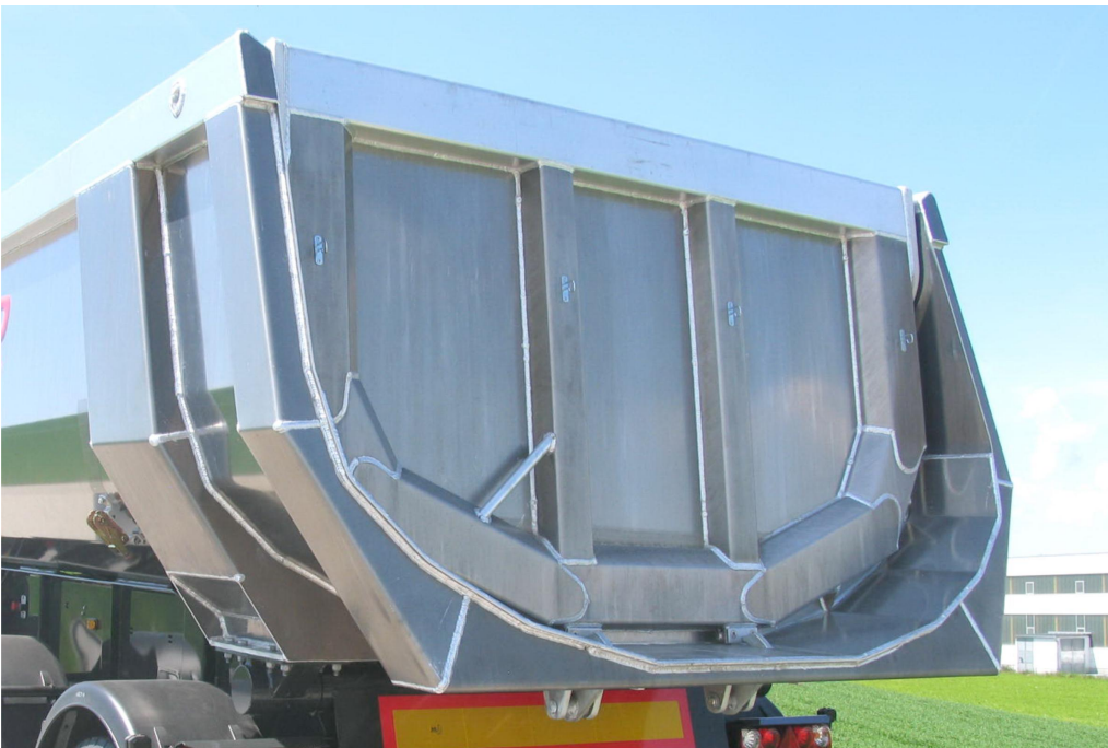
Rückwand = Pendelwand mit versenkter Lagerung und autom.-mech. 2-Haken-Zentralverschluss