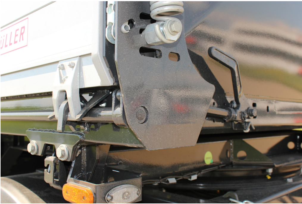
Manuelle Zentralverriegelung zum öffnen der Seitewände mit Hebel und Zentralverriegelungswelle