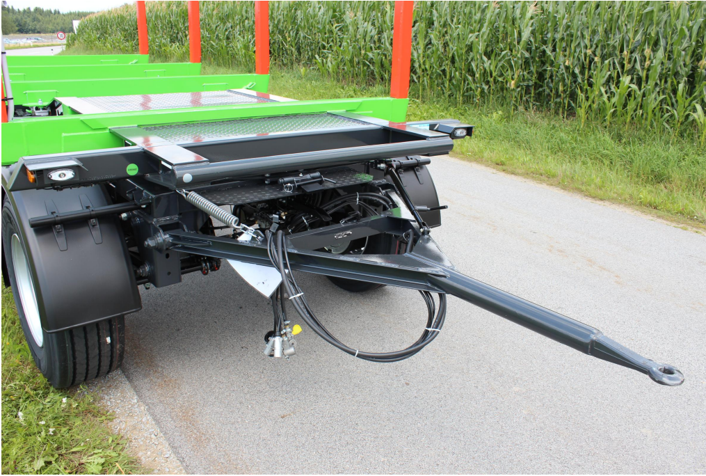
Vorne Drehgestell inkl. montierter Zuggabel