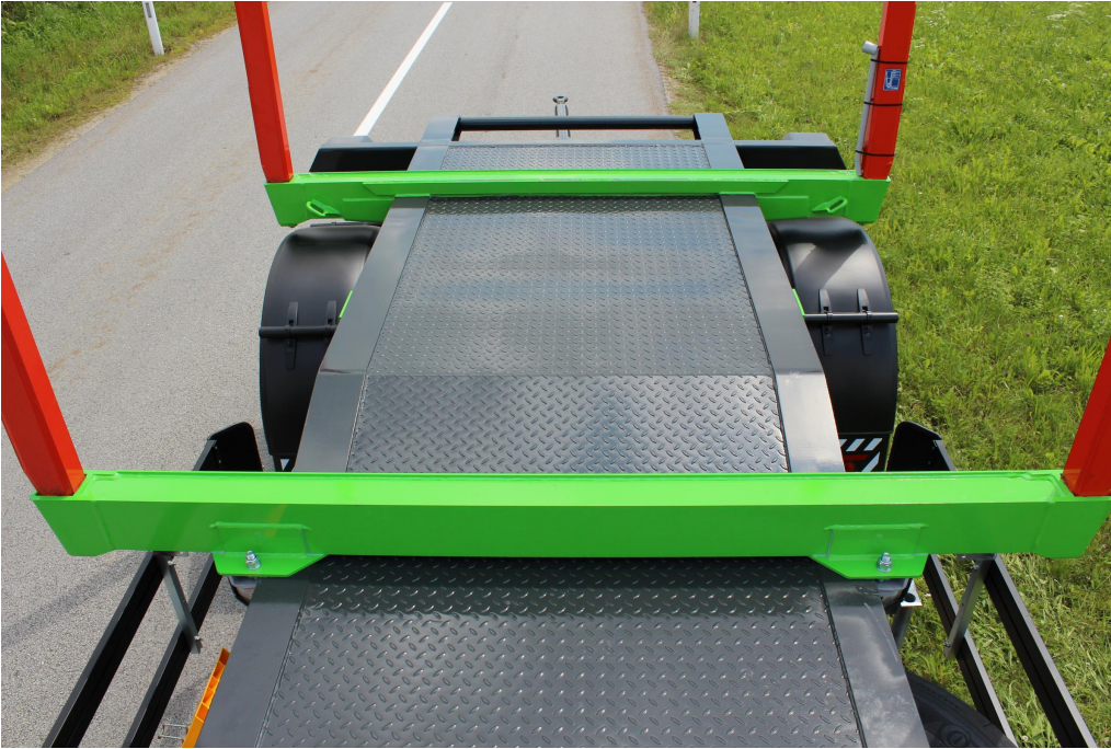
Stahltränenblech-Abdeckung zwischen den Rahmenlängsträgern