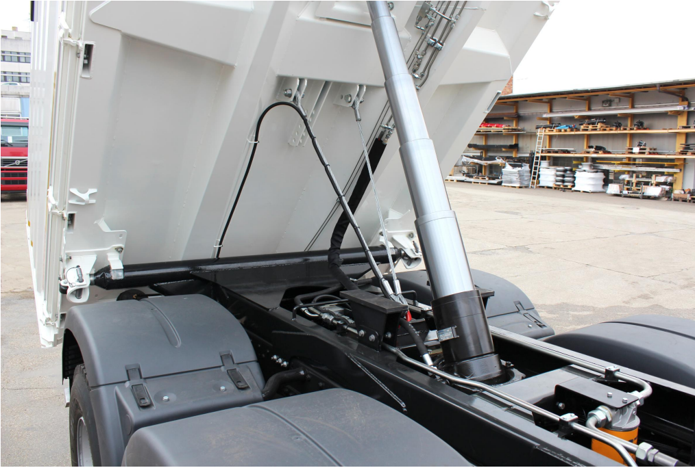
Hartverchromter, qualitativ hochwertiger Kippzylinder