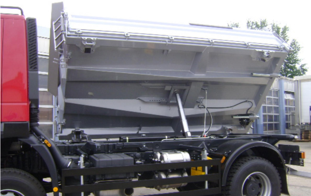
Kipperbrückenkonstruktion mittels konischer Trapezprofil-Längsträger in hochfester Leichtbauweise mit kleinen Bodenfeldern für große Beulfestigkeit und hoher Stoßabfederung