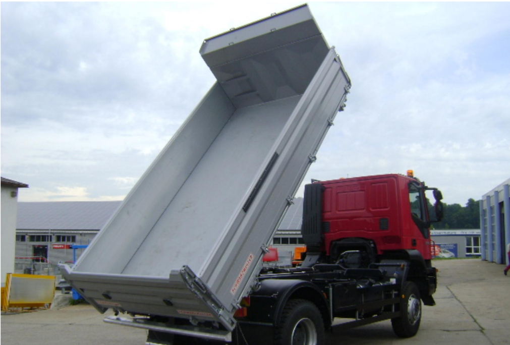
3-Seiten-Kippaufbau auf 2-Achs-LKW - Baustelle