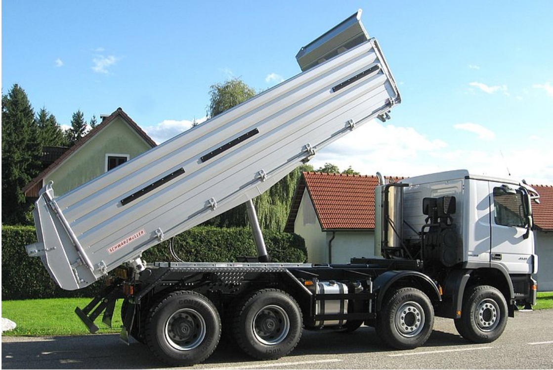
3-Seiten-Kippaufbau auf 4-Achs-LKW - Baustelle