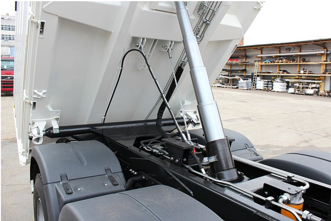
Hartverchromter, qualitativ hochwertiger Kippzylinder