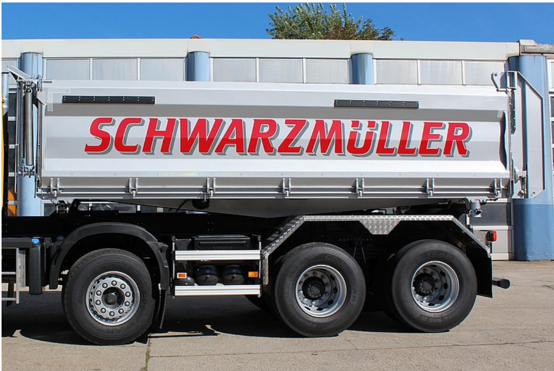
OPTIONAL: Verstärkte Seitenwände in materialabweisender Membranbauweise aus Feinkorn-Sonderstahlblech