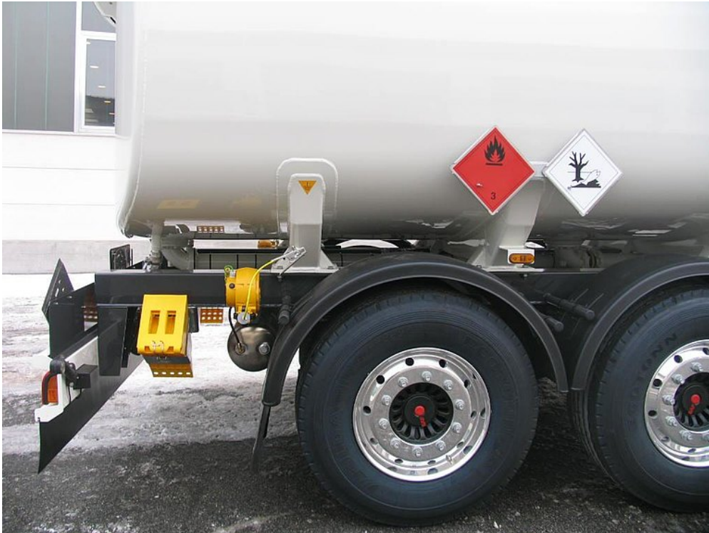
Perfekte Anordnung der Ausrüstung