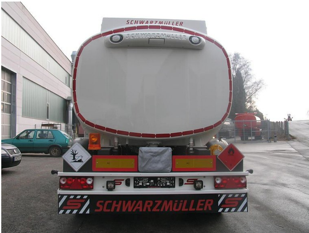
OPTIONAL: Hochgesetzter LED-Leuchträger mit Möglichkeit einer integrierten Rückfahrkamera