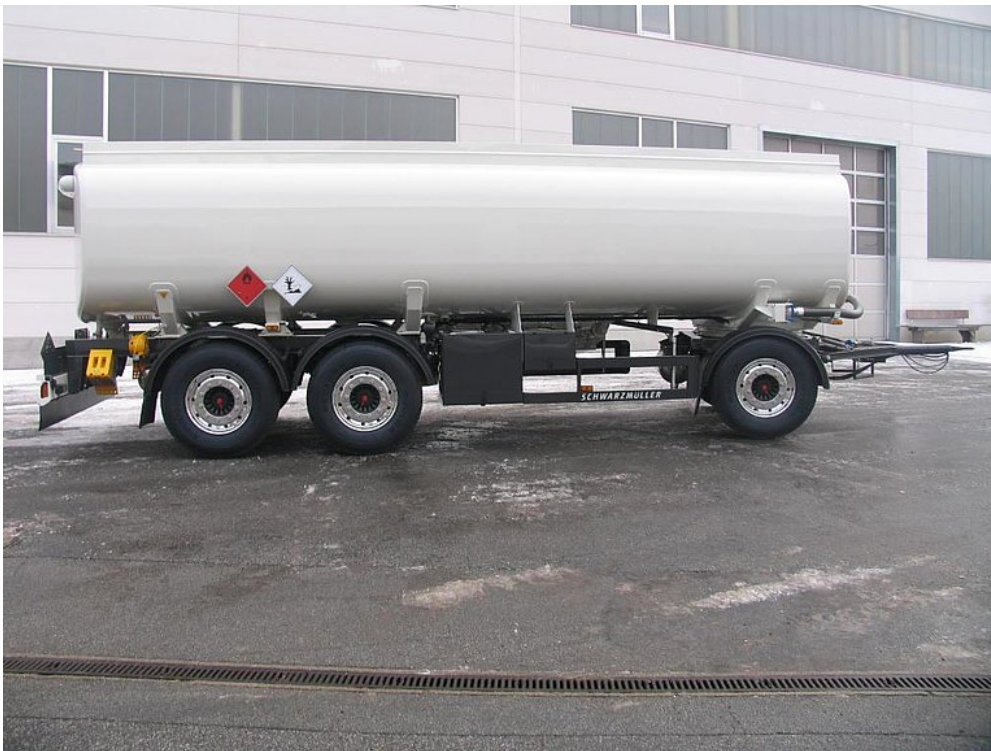
Modernes Design und beste Funktionalität des Fahrzeuges