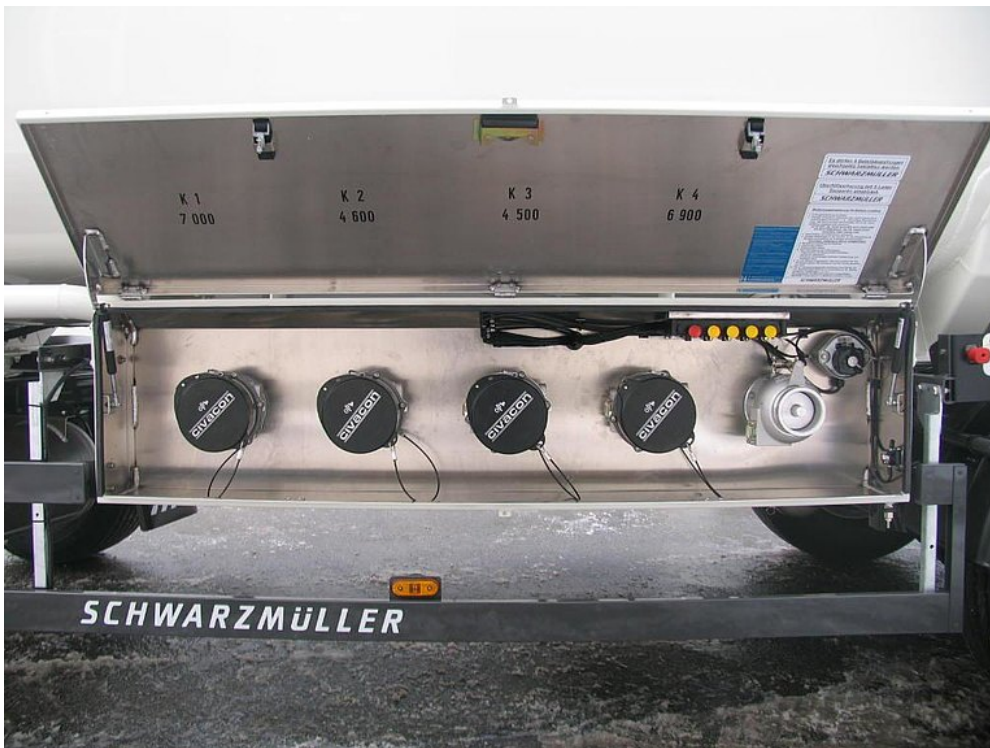
Übersichtliche und aufgeräumte Anordnung der Armaturen für effiziente und fehlerfreie Bedienung