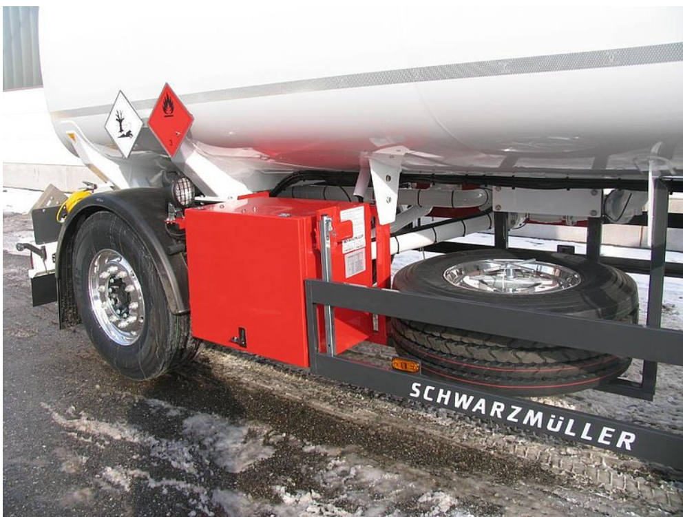
OPTIONAL: Möglichkeit zur Anbringung einer Reserveradhalterung