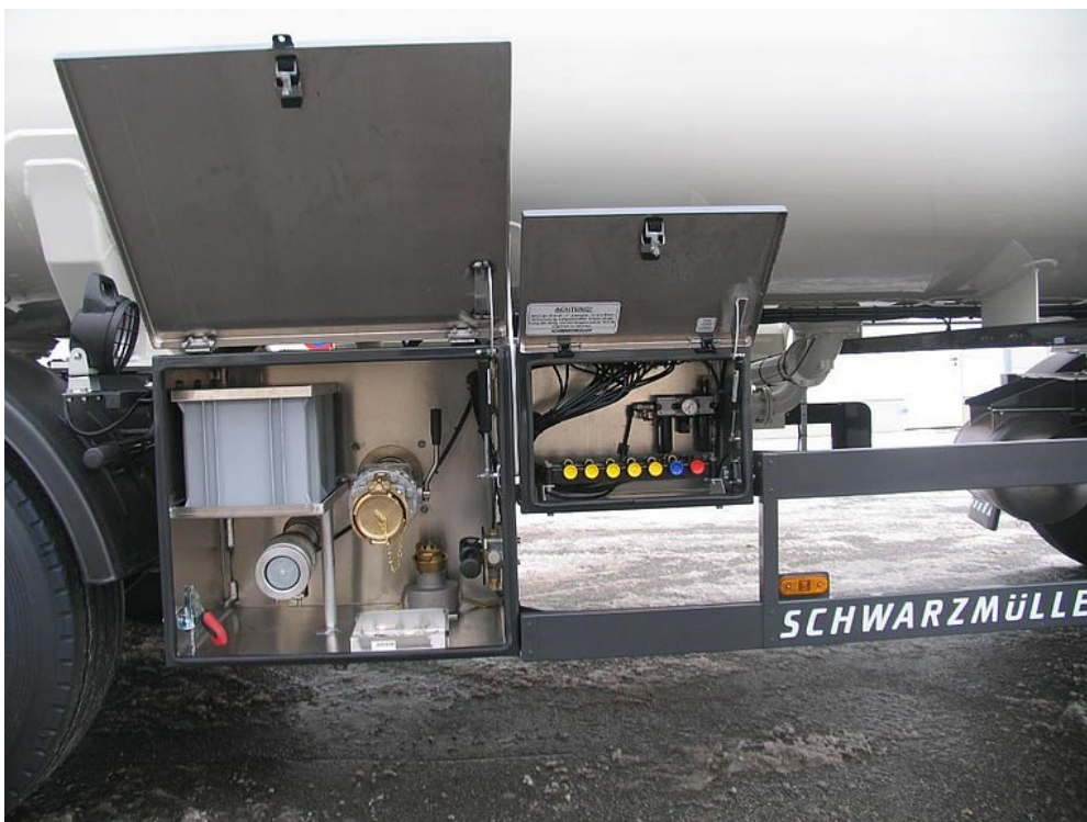
Auslaufkasten mit nach oben öffnender Tür zum Schutz der Armaturen inkl. Kasten für pneum. Ventilsteuerung