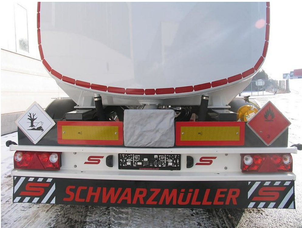
OPTIONAL: Auswahlmöglichkeit zwischen Aluminium- und Edelstahl-Stoßstange