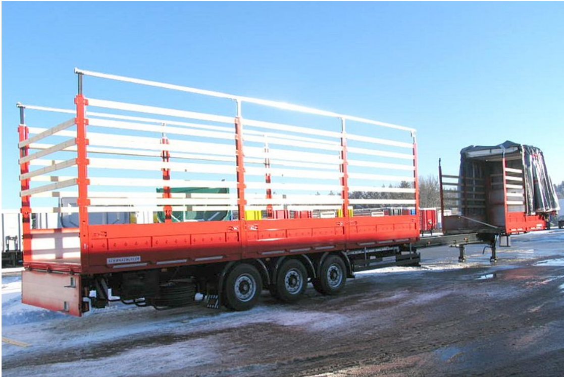
3-Achs-Plateausattelanhänger - ausziehbar