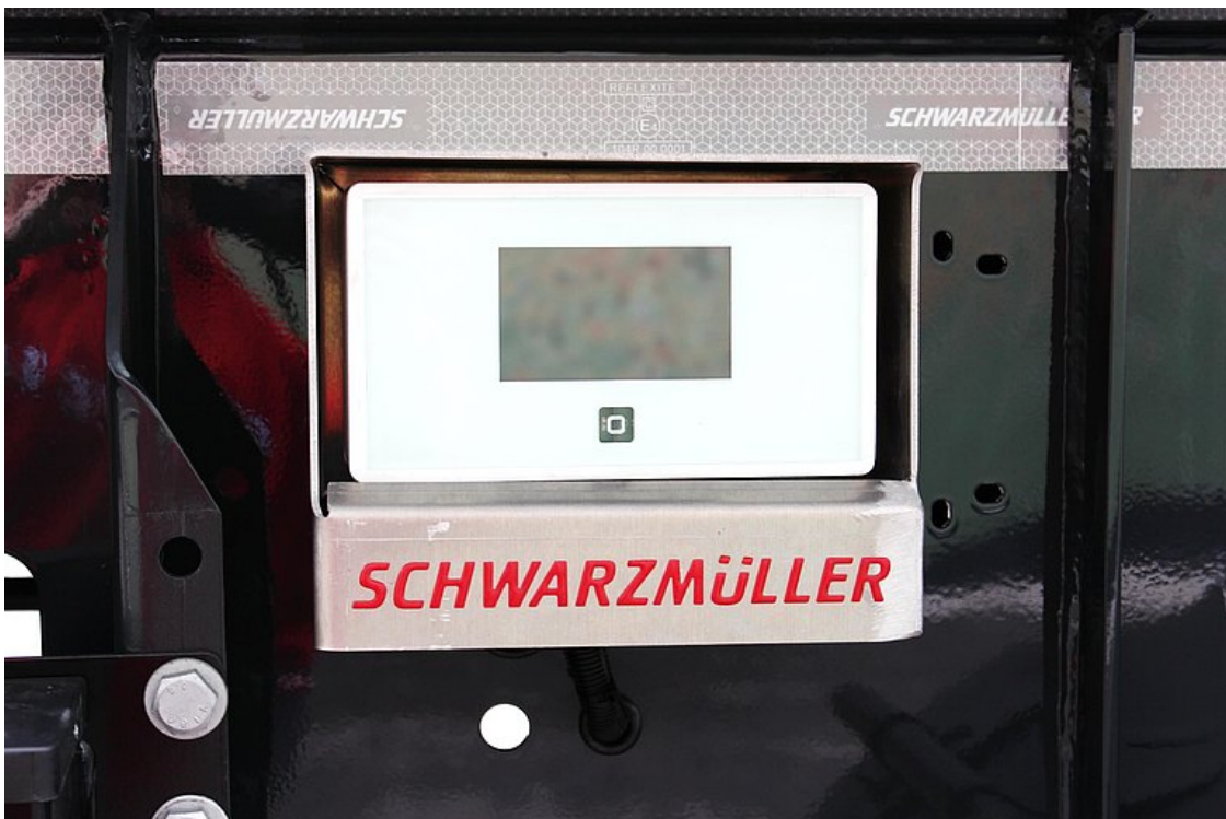
Temperatur-Auswerteeinheit in robustem Kasten