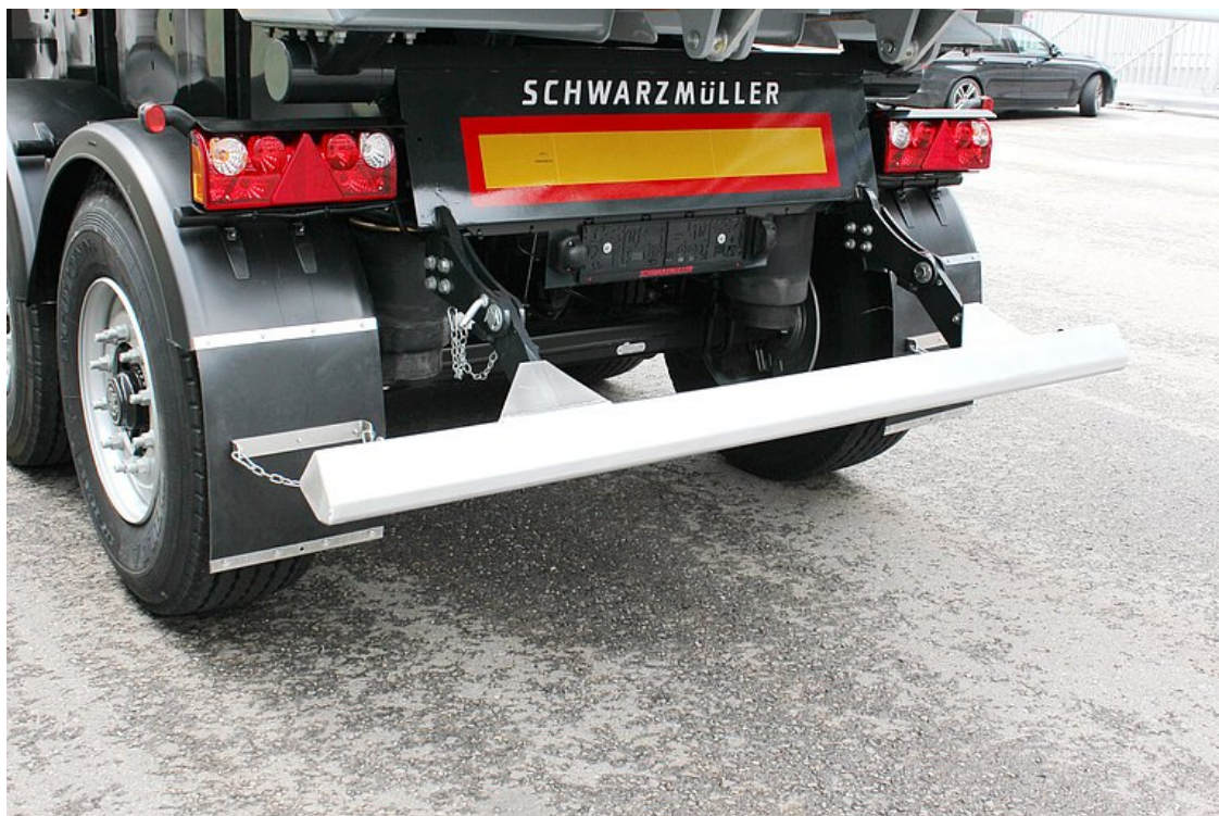
Aluminium-Trapez-Unterfahrschutz klappbar, optional pneum. hochklappbar