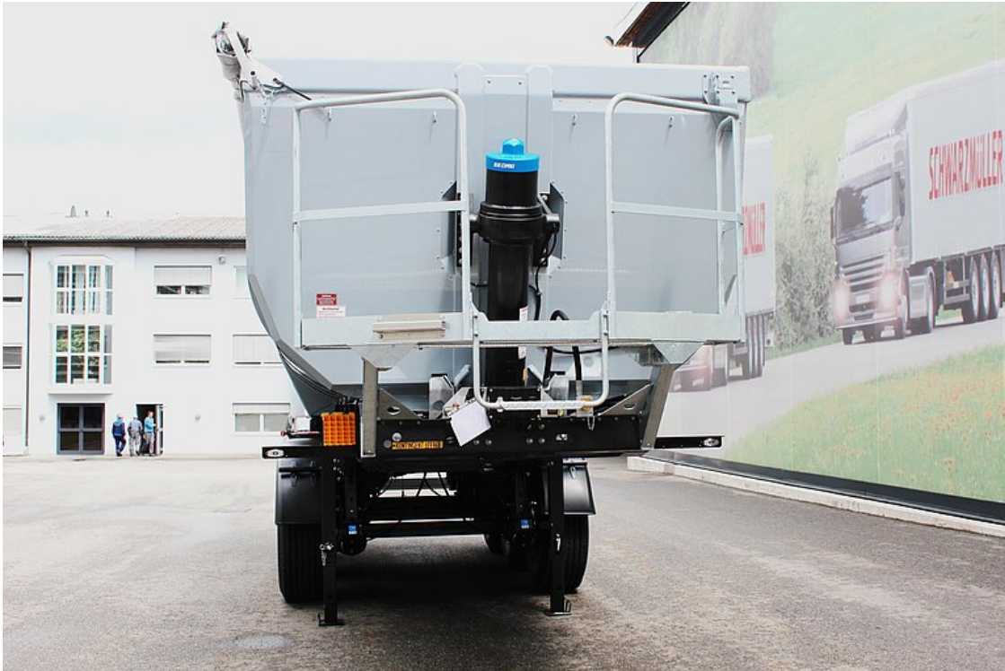
Isolierte Vorderwand mit hartverchromtem, qualitativ hochwertigem Frontkippzylinder