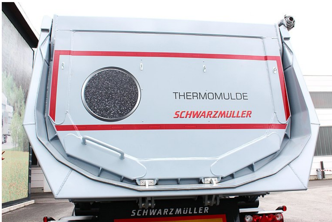
Isolierte Rückwand = Pendelwand mit versenkter Lagerung und autom.-mech. 2-Haken-Zentralverschluss