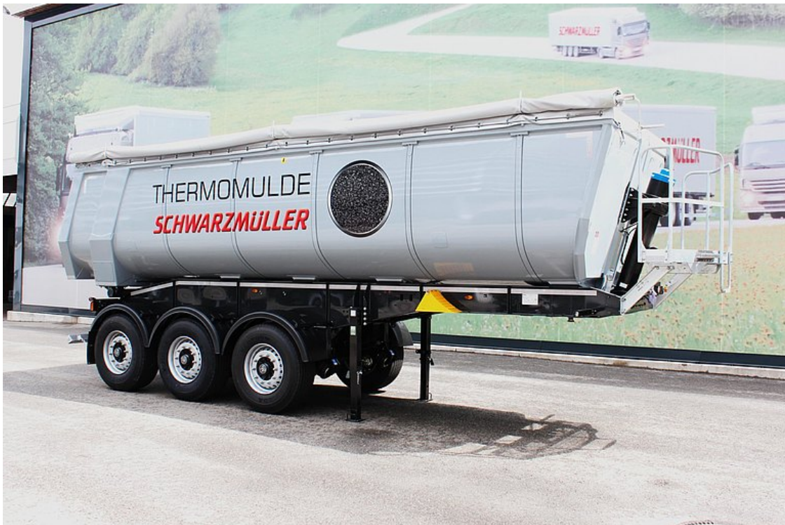
Stabile und verwindungssteife Naxtra- Fahrgestellkonstruktion mit zusätzlichen Torsionsrohren für eine hohe Kippstabilität