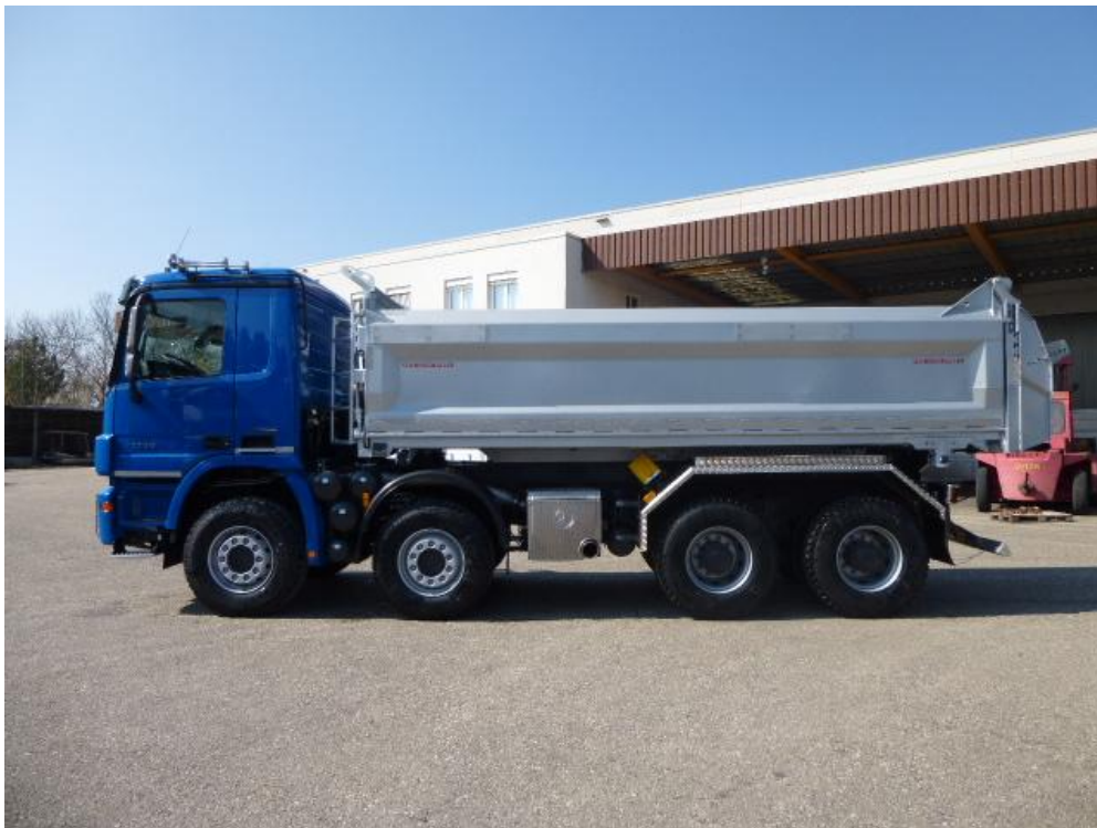
2-Seiten-Kippaufbau auf 4-Achs-LKW