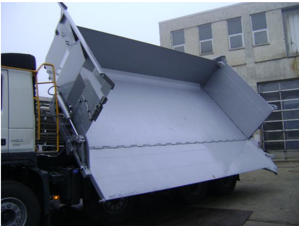
OPTIONAL: Ohne feststehende Ecksäule in FR links, linke Ecksäule ist in Seitenwand/Bordmatic integriert