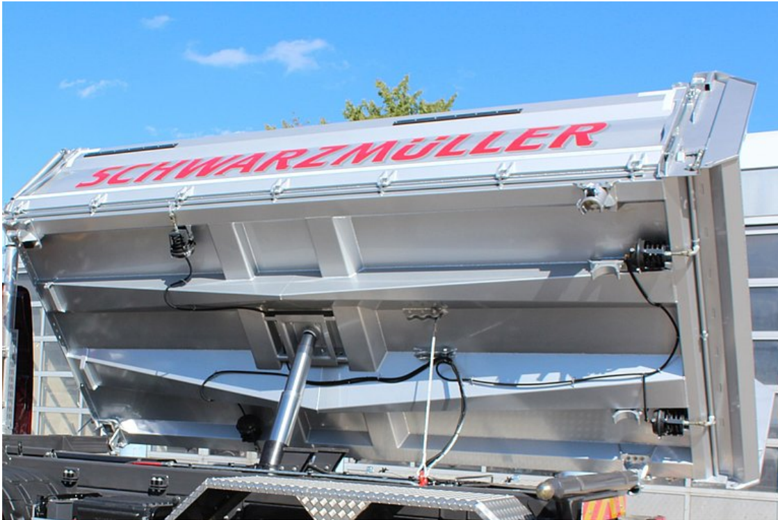
Kipperbrückenkonstruktion mittels konischer Trapezprofil-Längsträger in hochfester Leichtbauweise mit kleinen Bodenfeldern für große Beulfestigkeit und hoher Stoßabfederung