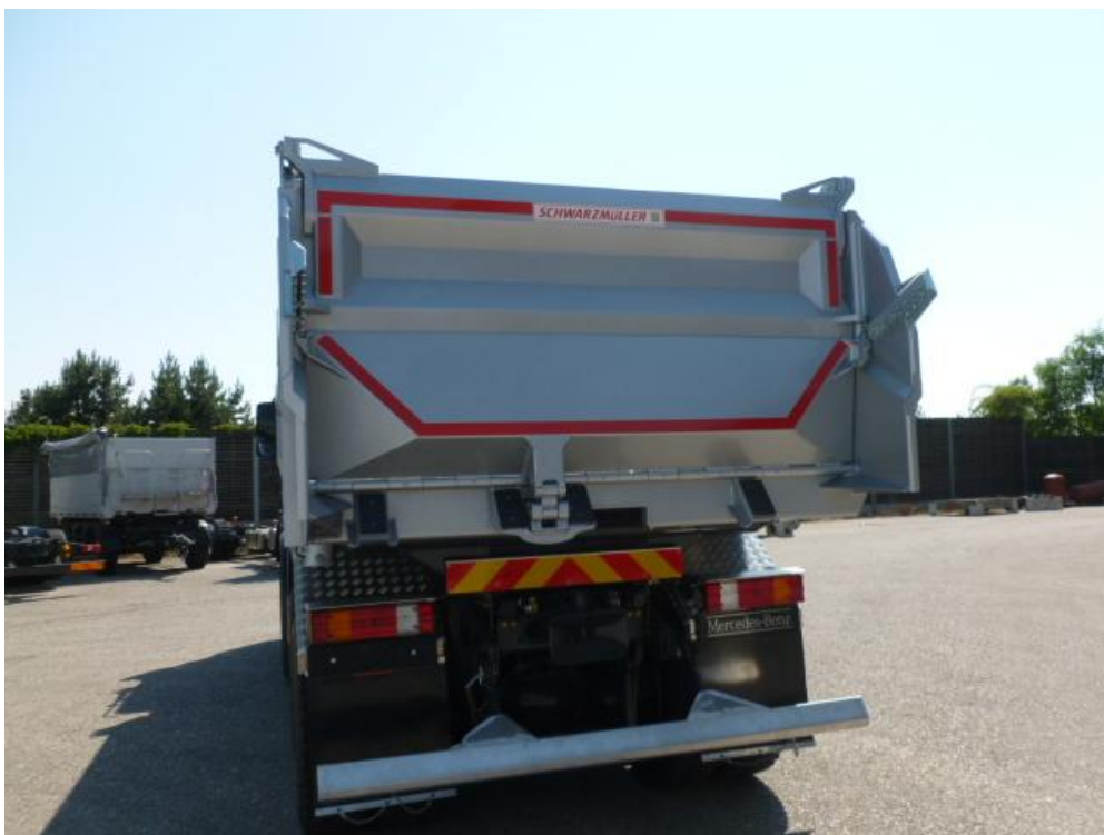
Stahlblech-Rückwand 4 mm, ca. 980 mm hoch, pendelbar mit erhöhter Lagerung und pneum. Verriegelung vom Fahrerhaus zu öffnen sowie zus. bedingt abklappbar