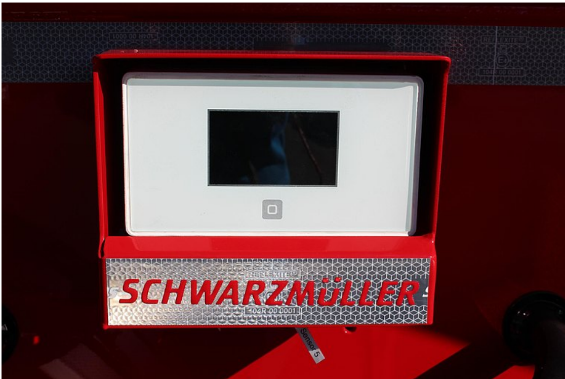
Temperatur-Auswerteeinheit in robustem Kasten