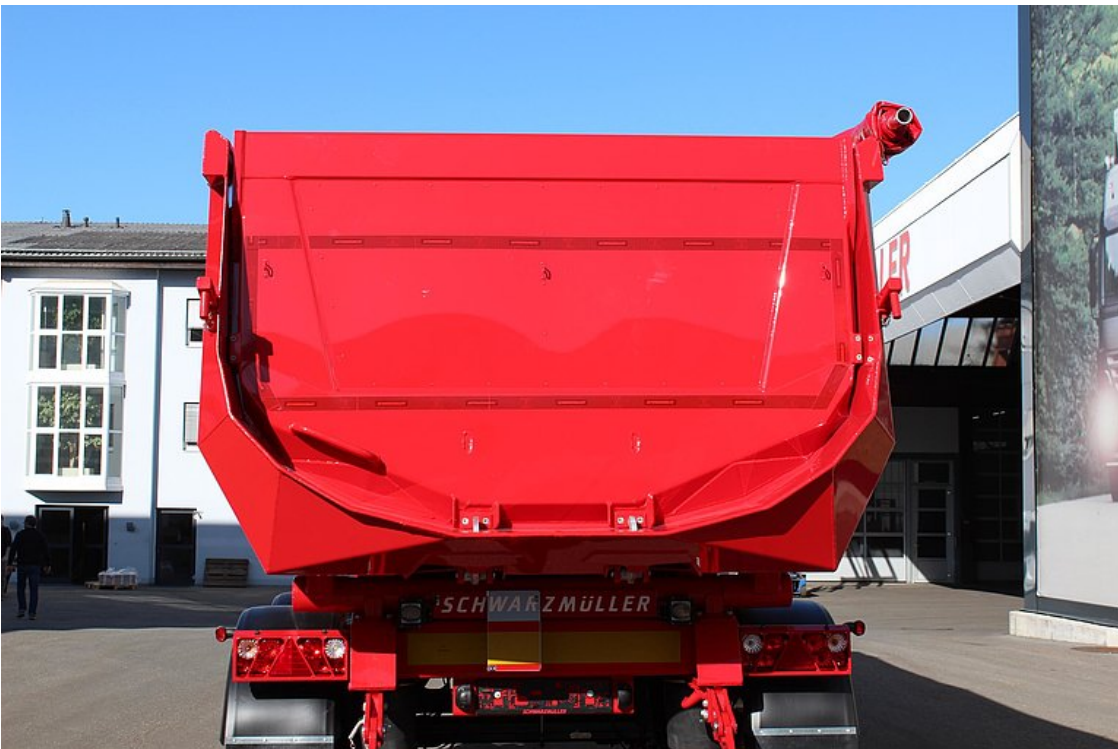
Isolierte Rückwand = Pendelwand mit versenkter Lagerung und autom.-mech- 2-Haken-Zentralverschluss