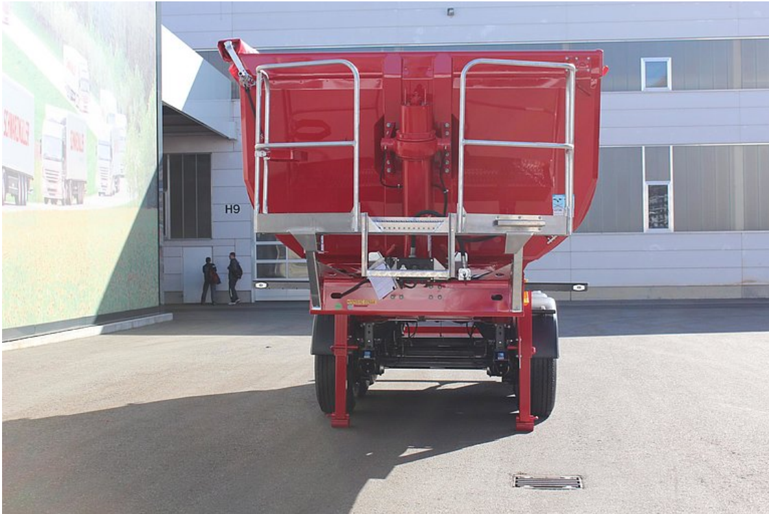
Isolierte Vorderwand mit hartverchromtem, qualitativ hochwertigem Frontkippzylinder