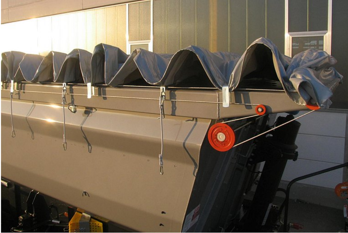
OPTIONAL: Rollverdeck - wahlweise manuell oder über elektrische Fernsteuerung bedienbar