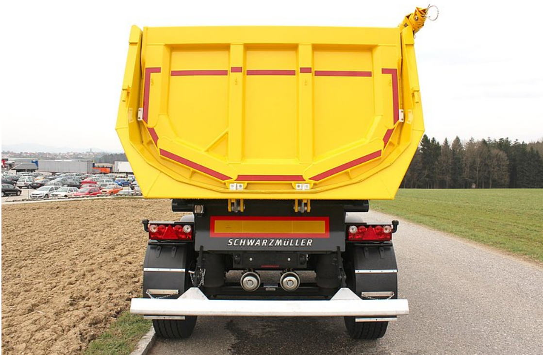
Rückwand = Pendelwand mit versenkter Lagerung und autom.-mech. 2-Haken-Zentralverschluss