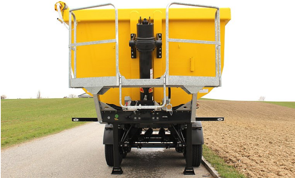
Stehpodest an der Vorderwand zur Bedienung der Rollplane