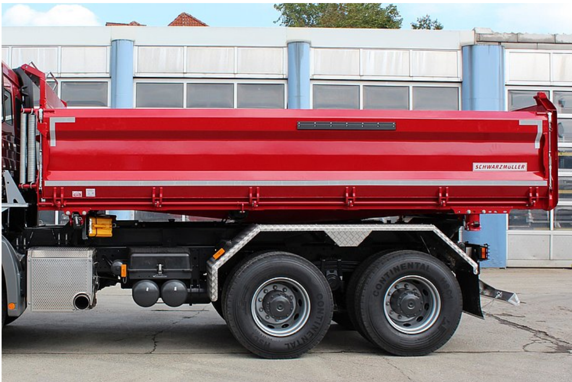
OPTIONAL: Verstärkte Seitenwände in materialabweisender Membranbauweise aus Feinkorn-Sonderstahlblech