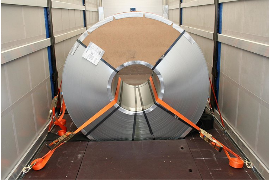
Příklad přepravovaného zboží - svitky