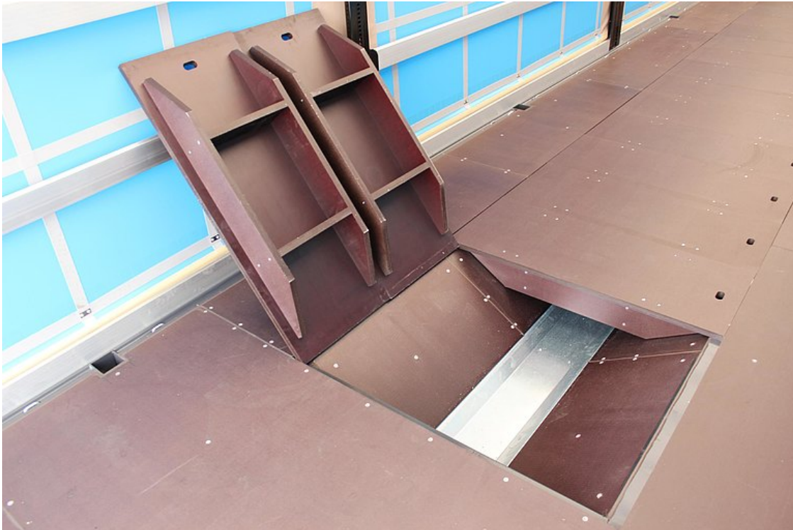
Zakrytí prohloubeného lůžka z tvrzené protiskuzové překližky tl. 27mm, pro přejezd vysokozdvížným vozíkem