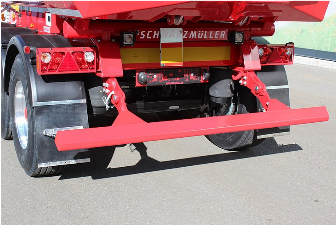
Sklopný zadní nárazník z trapézového hliníkového profilu, volitelně s pneumatickým vyklápěním vzhůru