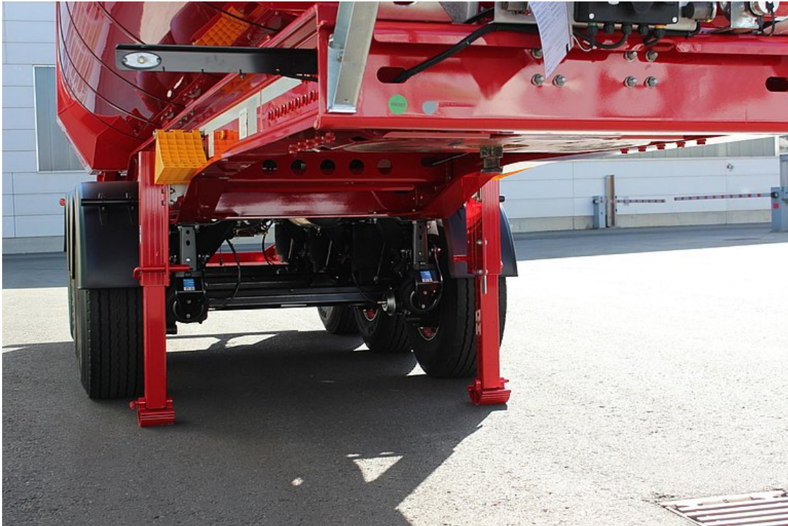
Stabilní a tuhá konstrukce hliníkového rámu s dodatečnými torzními výztuhami pro vysokou stabilitu sklápění