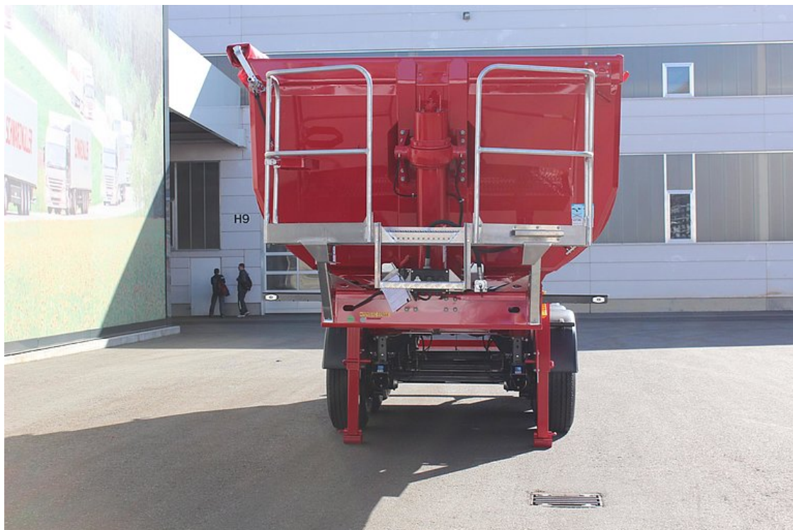
Izolovaná čelní stěna s vysoce kvalitním, tvrdě chromovaným sklápěcím válcem