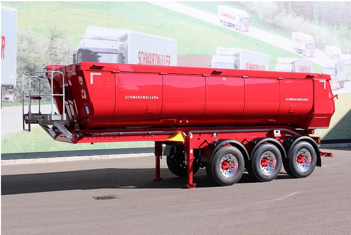
Třínápravový hliníkový sklápěcí návěs s tepelně izolovanou hliníkovou korbou v segmentovém provedení