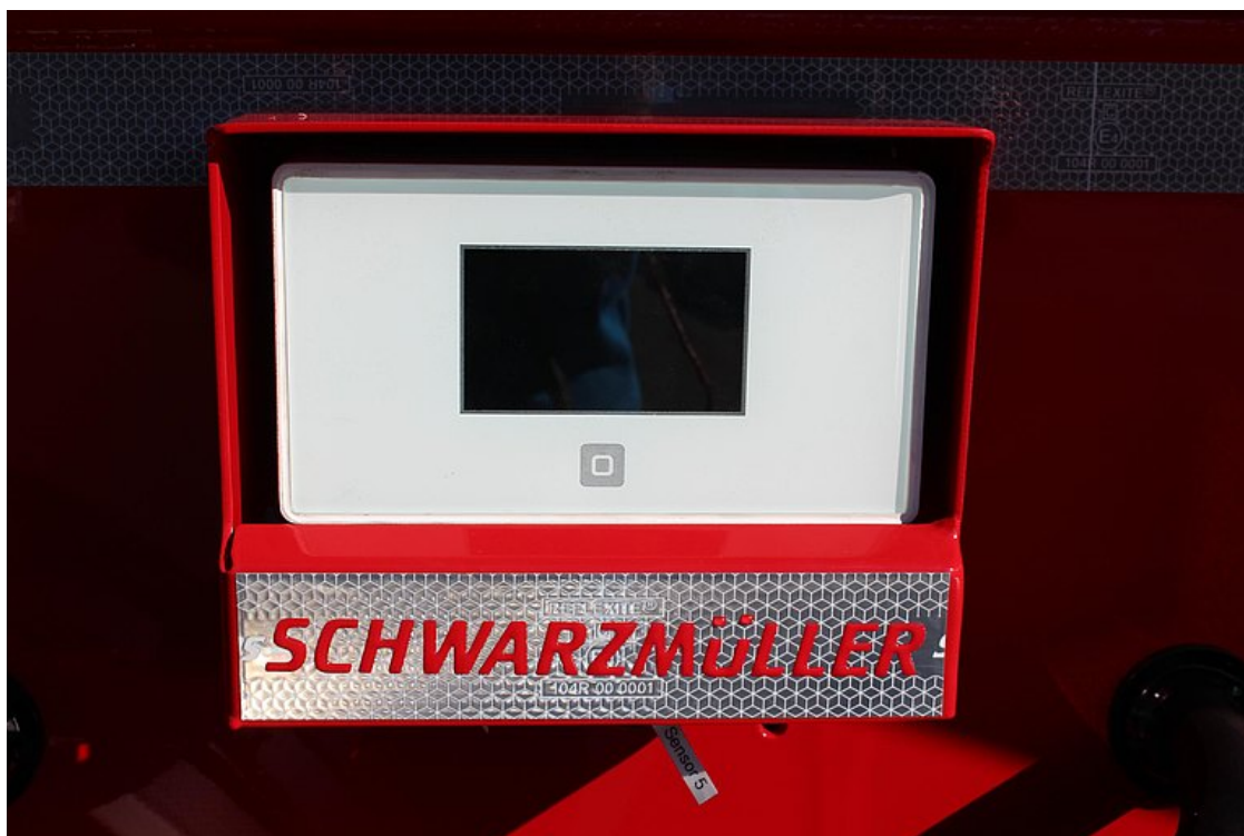
Jednotka pro vyhodnocování teploty v robustní schránce